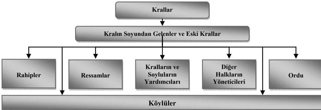
Şekil 1: Mayalar'ın Sosyal Örgüt Yapısı

Maya nüfusunun çoğunluğunu soylular tarafından istihdam edilen köylüler oluşturmaktaydı. Soylu sınıfı da Maya nüfusunun içerisinde geniş bir yere sahipti. Soylular, birden fazla kadınla evlilik yapma hakkına sahipti ve bu yüzden çok sayıda çocukları vardı. Soyluların örgüt yapısı; krallardan, eşlerinden ve çocuklarından oluşmaktaydı. Çocuklar belirli bir yaşa ulaştıklarında küçük kentlerin kraları oluyorlar ya da orduda önemli bir mevkiye getiriliyorlardı. Genel olarak Mayalar'ın sosyal örgüt yapısı Şekil 1'deki gibidir: