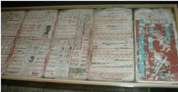
Resim 1: Maya Rahiplerinin Yazmış Olduğu Kutsal Taş Kitabeler