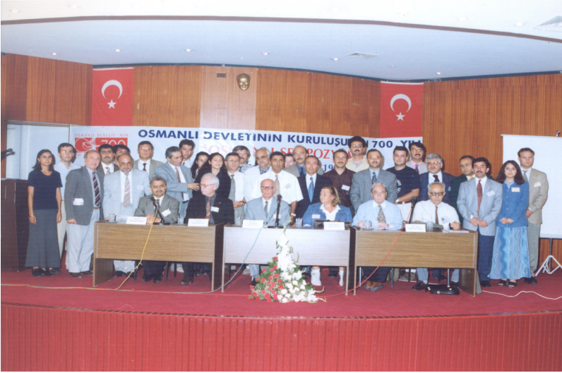
Resim 3: Eskişehir Osmangazi Üniversitesi Necla Özdemir Konferans Salonu (1999)