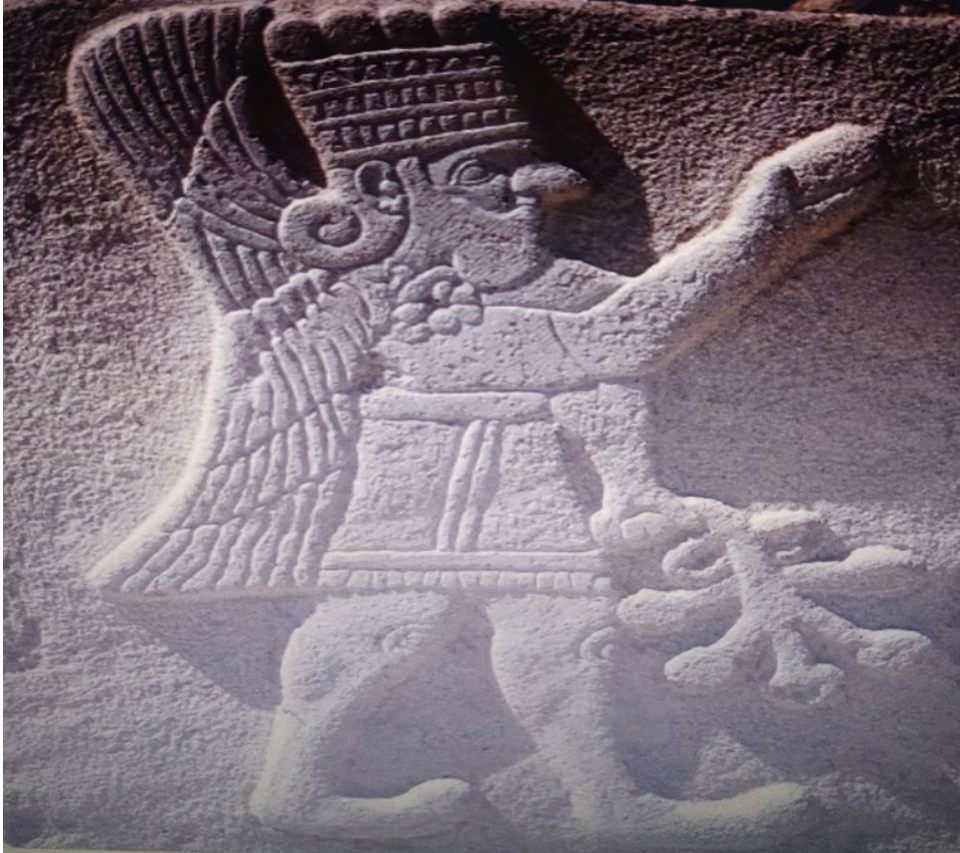
Resim 6: Malatya Arslantepe'de Bulunan Kaya Kabartması (Frangipane 2018: 92).