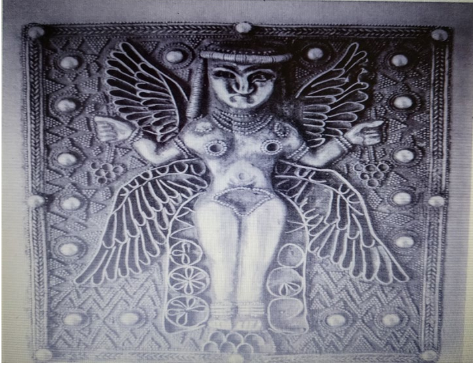
Resim 5: Elektrum Plak Üzerinde Kanatlı Şarap Tanrıçası (Barnett 1980: 173).