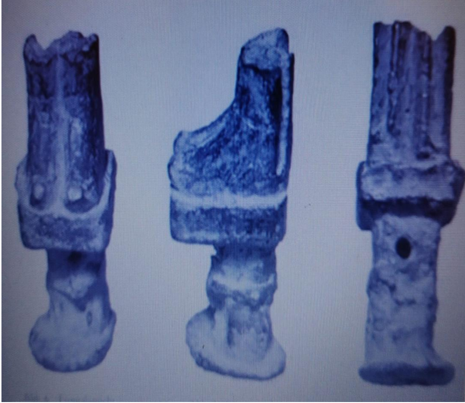
Resim 1: Ereğli Bronz Heykelciği (Maner 2014: 214).