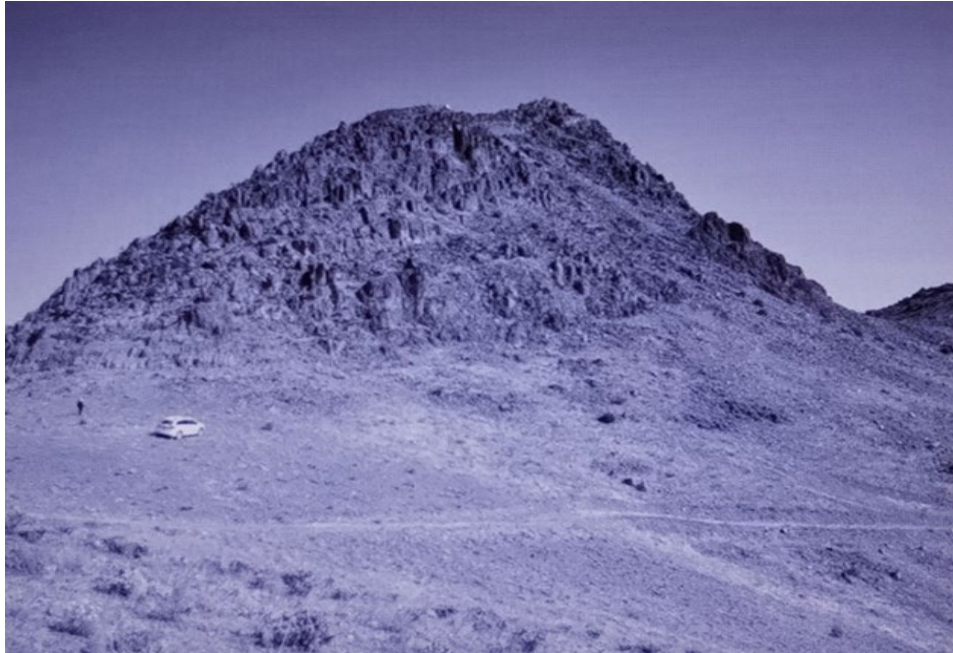
Resim 2: Arısama Dağı (Maner 2016: 241).