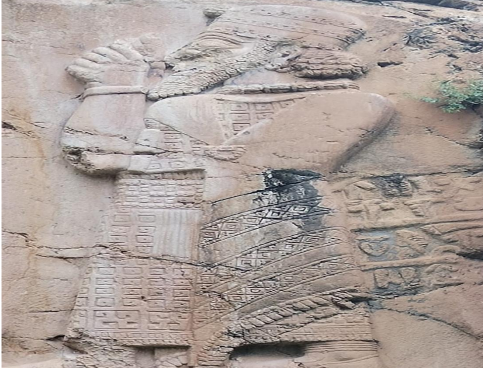
Resim 7: Tuwana Kralı Warpalawas'ın Üzeri'ndeki Frig Tokası.