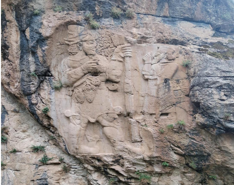
Resim 4: İvriz Kaya Anıtı.