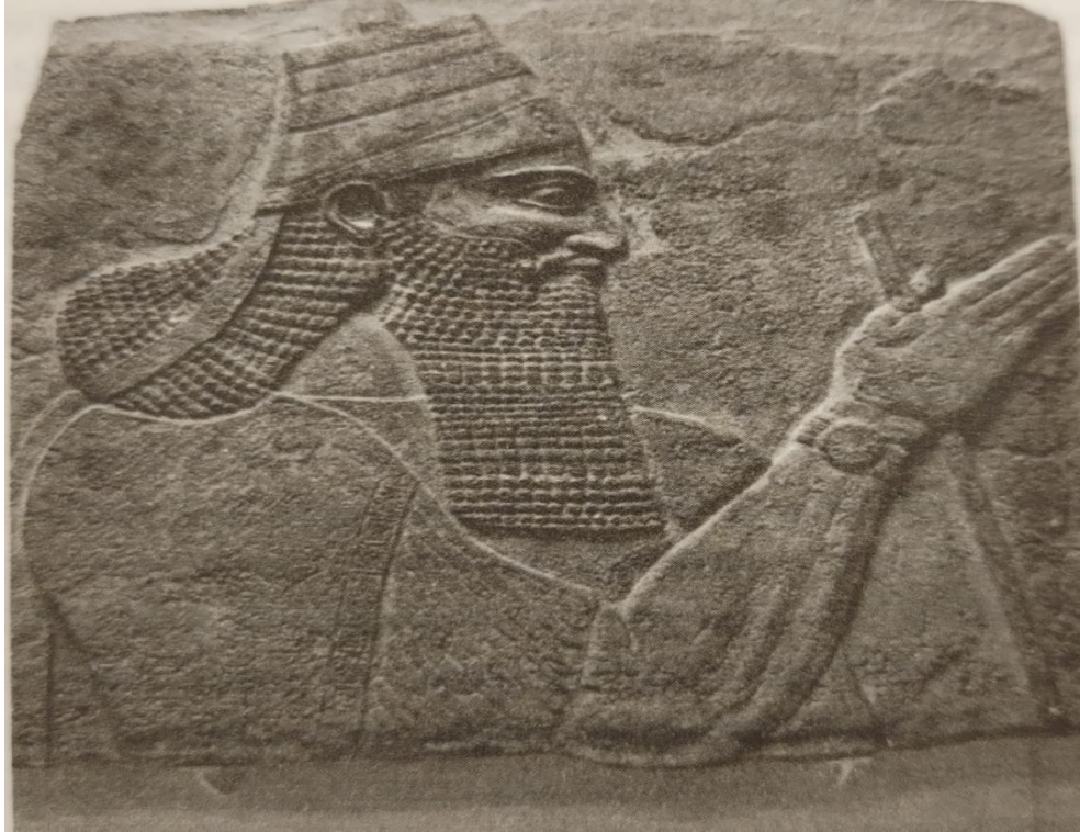
Resim 8: Asur Kralı III. Tiglatpileser (Bryce 2023: 388).