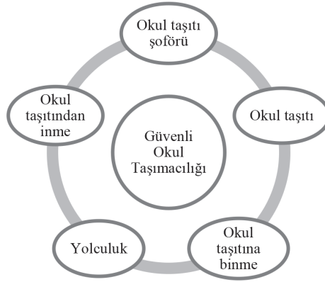
Şekil 2. Annelerin görüşlerine göre ulaşılan temalar