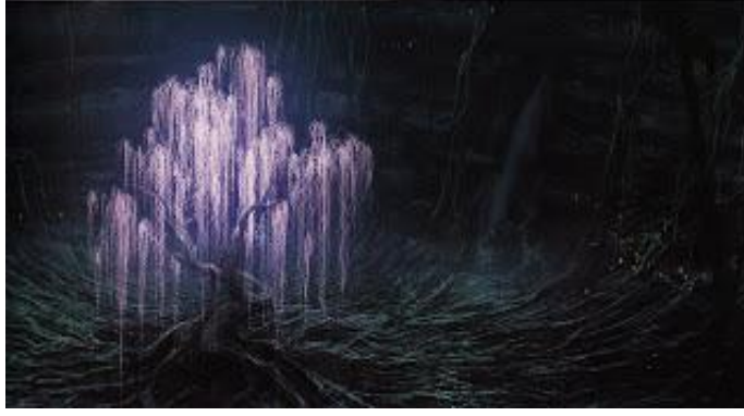
Şekil 3. Kutsal Ağaç “Eywa”. Avatar filminden bir sahne (URL-3).

Eywa da tıpkı mitolojilerde betimlenen hayat ağacı, kutsal ağaç, dünya ağacı gibi yerle göğü birleştiren ve kozmos yaratan bir ağaçtır. Bu yüzden “kozmos ağacı” olarak da adlandırılabilir. Kökü yerin altında, dalları ise göğe doğru çıkarak yayılmaktadır. Böylelikle dünya kültürlerinde bahsedilen ve üç âlemi birleştiren kutsal ağaca yani “dünyanın direğine” çok benzemektedir. Yaşamın merkezinde yer aldığı için Naviler zamanlarının küçük bir kısmını avlanarak, geri kalanını da bu ağacın dalları arasında eğlenerek geçirirler. Bu halkın, kendisini en güvende hissettiği yer de bu ağaç ve onun dallarının arasındadır. Çünkü Eywa’nın koruyucu bir gücü vardır. Dünya kültürlerinde benzer şekilde, bu kutsal ağaç da tanrıya ulaşmanın bir yoludur. O yüzden Naviler saçlarını bu ağacın dallarına bağlayarak tanrıya ulaşırlar ve dua ederler.