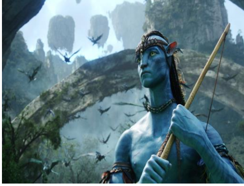
Şekil 2. Avatar (Jake). Avatar filminden bir sahne (URL-2).

Avatar kullanıcısı bir bilim adamının ölümünden sonra, görevi istenilen şekilde devam ettirebilecek olan tek kişi ölen bilim adamıyla aynı DNA'ya sahip ikizi eski bir sakat asker olan Jake'dir. Jake'in Avatar (Şekil 2.) bedenine girmesinden sonrasında da film tam anlamıyla başlamış olur. Pandora'da Neytiri adında bir Navi ile tanışır. İlk başta Navi halkı Jake'i bir yabancı olarak görürler ve onu istemezler. Ancak "kutsal ağaç" Eywa'nın tohumları Jake'in Avatar bedeni üzerine konmaya başlayınca bunu bir işaret olarak görürler ve bu da Jake'in Pandora'ya kabul edilmesi anlamına gelmektedir.