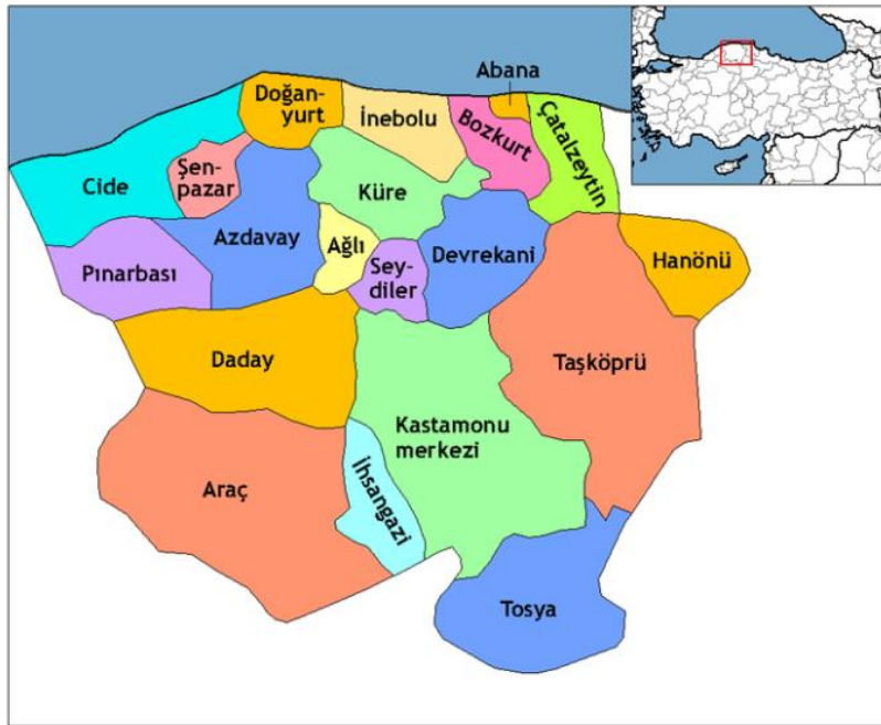
Harita 1. Araç İlçesi Lokasyon Haritası

Karadeniz Bölgesi Batı Karadeniz Bölümü'nde Kastamonu iline bağlı Araç ilçesi, 40°14' kuzey paraleli ile 33°19' doğu meridyeni arasında yer almaktadır. Batıda Safranbolu (Karabük), kuzeybatıda Eflani (Karabük), kuzeydoğuda Daday (Kastamonu), doğuda Kastamonu Merkez ilçe ve İhsangazi (Kastamonu), güneydoğuda Ilgaz (Çankırı), güneyde Kurşunlu (Çankırı) ve Bayramören (Çankırı), güneybatıda Ovacık (Karabük) ile komşudur (Harita 1). Kastamonu il merkezine 47 km, Kastamonu havalimanına 50 km, Ankara'ya 290 km ve İstanbul'a 450 km uzaklıktadır.