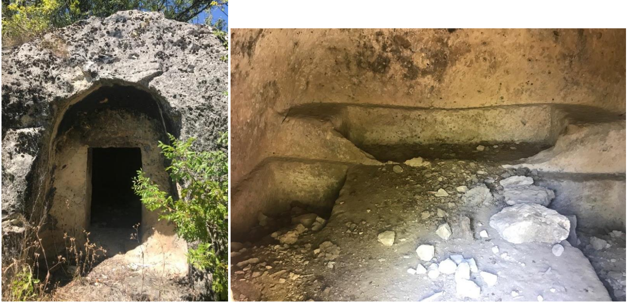
Fotoğraf 4-5. Merdivenli Kaya Mezarı Giriş Kapısı ve Ölü Çukuru (2023)

İlçede bulunan harabelerden Kahintepe Antik Yerleşkesi, Araç barajının suları altında kalmıştır. Deptepe Harabesi ve Kesüt Harabesi tamamen yok olma durumundadır. Aşağı Güney Harabeleri tahrip olmuş olsa da hala ayaktaadır.