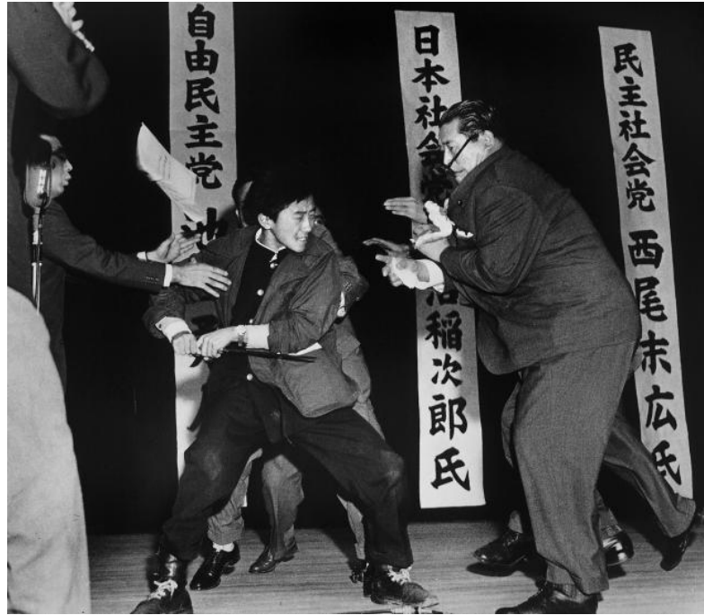
Resim.1: Death of Inejiro Asanuma, 1960.