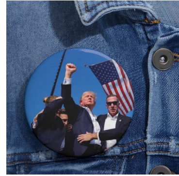
Resim.10: Yaka Rozeti, 2024.

Tüm dünya basınında yer alan bu ikonik fotoğrafın, özellikle Amerika Birleşik Devletleri iç siyaseti açısından Cumhuriyet destekçisi halkı, yapılacak olan seçimde partilerini destekleme konusunda konsolide ettiği, seçmenleri siyasal olarak yeniden şekillendirdiği söylenebilir. Bu bağlamda suikast fotoğraflarının ve yaşanan kaosun insanlar tarafından her ortamda konuşulması, sosyal inşayı gerçekleştiren ana unsurlarından biri olan iletişimin temelinde zemin bulunduğu gözlemlenmektedir. Çünkü insanlar birbirleriyle konuşurken dünyalarını yeniden inşa eder ve bu noktada dil icra edici bir rol üstlenmektedir (Burr, 2012, s. 6-8; Berger ve Luckmann, 2008, s. 3).