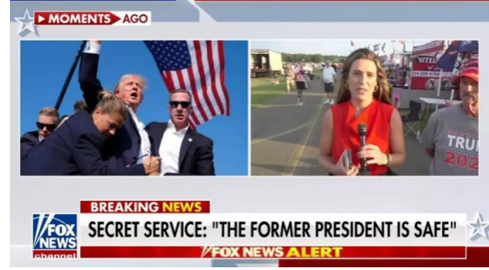
Resim.8: FOX News, 2024.

Geleneksel medya ve sosyal medya aracılığıyla ikonik bir temsile dönüşen Doug Mills'a ait bu fotoğrafın, Trump'ın yarış içinde olduğu seçim kampanyasında da önemli bir siyasi propaganda rolü üstlendiği görülmektedir. Seçim kampanyası sürecinde t-shirt, rozet gibi seçmenlerin kullanabileceği eşyaların üzerine bu ikonik fotoğrafın baskısı yapılmıştır. Böylelikle bu eşyaları kullanan Trump destekçileri, toplum içinde görsel bir propaganda görevi üstlenerek diğer seçmen grubundan olan ya da kararsız yaşayan seçmenleri kendi taraflarına çekmeye çalışmıştır. Bu süreç, toplumu siyasi açıdan yeniden inşa etmeye yönelik bir proje olarak karşımıza çıkmaktadır (Resim.9 ve 10).