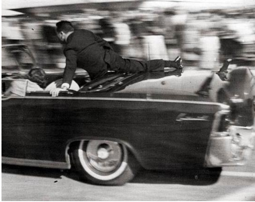
Resim.2: Assassination of President Kennedy, 1963.