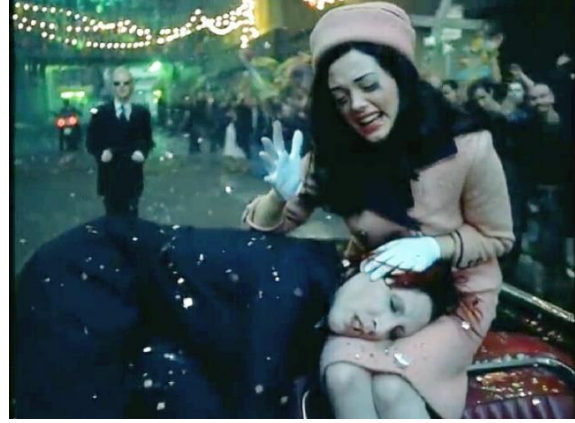
Resim.5: Marilyn Manson - Coma White, 1998.