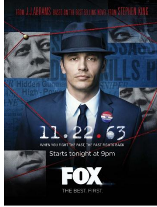
Resim.4: 11.22.63, 2016.