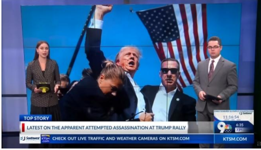
Resim.7: 9KTSM, 2024.

olayın kritik bir anda fotoğraflanarak dünya basınında yer bulması, birçok izleyicinin konu hakkında bilgi sahibi olmasına olanak sağlamıştır. Bunun yanı sıra, farklı haber ajanslarında gerçekleşen tartışmalarda suikast fotoğraflarına yer verilmesi ve bu fotoğraflar üzerinden semiyotik siyasi okumaların yapılması, fotoğrafın günümüzde ikonik bir temsile dönüştürmektedir (Resim.7 ve 8).