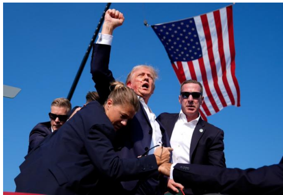
Resim.6: Attempted Assassination of Donald Trump, 2024.

Fotoğraflar toplumlara ortada neyin olduğunu, ne yaşandığını anlatan bir döküm ve envanter sunar (Sontag, 2011, s. 27). Bu açıdan fotoğraf aynı zamanda bir kanıt aracıdır. Yaşanan olayları ya da olaylara ilişkin durumları göstermede kanıt görevini üstlenir (Meskin ve Cohen 2018, s. 93). Bu özelliğinden dolayı, izleyicinin yaşanan olayları ya da durumları tanımlamasına ve değerlendirmesine olanak sağlar (Silverman, 2019, s. 13). Bu bağlamda değerlendirdiğimizde, yaşanan bu sansasyonel