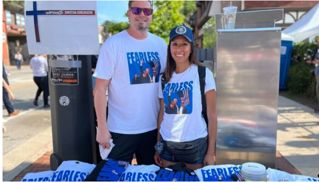
Resim.9: T-shirtler, 2024.

Geleneksel medya ve sosyal medya aracılığıyla ikonik bir temsile dönüşen Doug Mills'a ait bu fotoğrafın, Trump'ın yarış içinde olduğu seçim kampanyasında da önemli bir siyasi propaganda rolü üstlendiği görülmektedir. Seçim kampanyası sürecinde t-shirt, rozet gibi seçmenlerin kullanabileceği eşyaların üzerine bu ikonik fotoğrafın baskısı yapılmıştır. Böylelikle bu eşyaları kullanan Trump destekçileri, toplum içinde görsel bir propaganda görevi üstlenerek diğer seçmen grubundan olan ya da kararsız yaşayan seçmenleri kendi taraflarına çekmeye çalışmıştır. Bu süreç, toplumu siyasi açıdan yeniden inşa etmeye yönelik bir proje olarak karşımıza çıkmaktadır (Resim.9 ve 10).