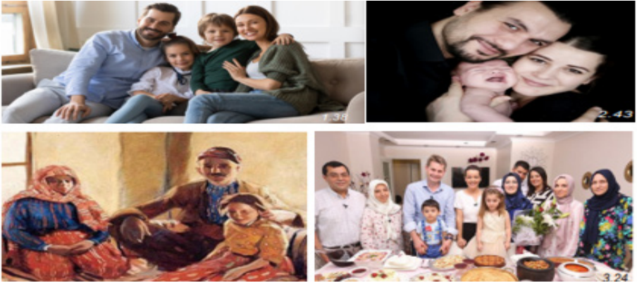
Şekil 8. Türkiye’de Kadının Aile Hayatındaki Temsiline İlişkin Görseller

Toplum için çalışanlar Türkiye’de yemek yardımı; İran’da ilk yardım görseli yer almaktadır. Türkiye’de bu konuya ilişkin daha fazla görsel içeriği mevcuttur.