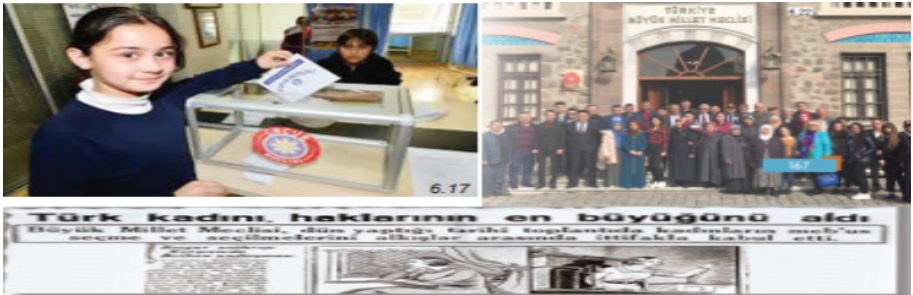
Şekil 11. Türkiye'de Kadının Siyasal Hayattaki Temsili