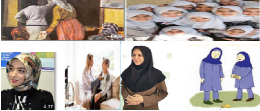
Şekil 17. Türk ve İran Ders Kitaplarında Yer Alan Kadın Görsellerinde Tek/Çok Boyutluluk

Şekil 17 incelendiğinde Türkiye’de kapalı-kadın erkek ve açık kadın görsellerine ilişkin kadınların çok boyutlu temsiline yönelik birçok fotoğraf bulunmaktadır. İran’da ise kadınlar genellikle hemcinsleri ile aynı görselde ve yalnızca tesettürlü şekilde tek boyutlu olarak ele alınmıştır.