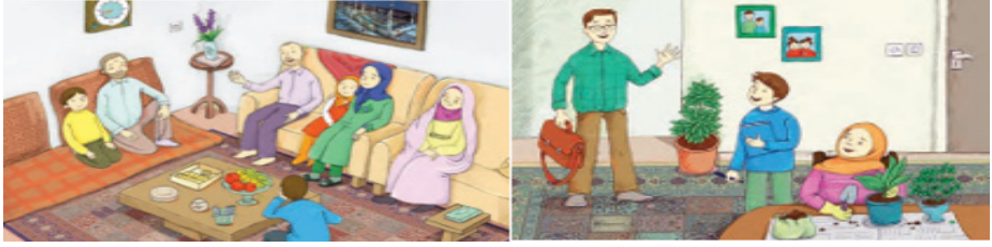
Şekil 9. İran İslam Cumhuriyeti'nde Görseller Kadının Aile Hayatındaki Temsiline İlişkin Görseller

İran'da kadın ve erkeğin aynı görselde yer aldığı fotoğraflar çoğunlukla aile yapısına yöneliktir. Bu fotoğraflardaki görsellerin tümünde ise kapalı kadın profili mevcuttur.