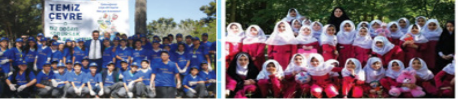
Şekil 1. Türkiye ve İran 1. Ünite Öğrenci Profili

Görseller incelendiğinde Türkiye’de karma eğitim doğrultusunda kız ve erkek öğrenciler bir arada yer alırken İran’da kız ve erkek öğrenciler birlikte öğrenim görmemektedir.