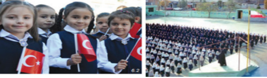
Şekil 6. Her İki Ülkenin Milli Değerlerine Yönelik Görsellerde Kadın Temsili

Türkiye’de tarihi ve kültürel değerlerimiz ünitesinde bayrak, anıtkabir; İran’da bizim ülkemiz konusunda bayrak ele alınmıştır.