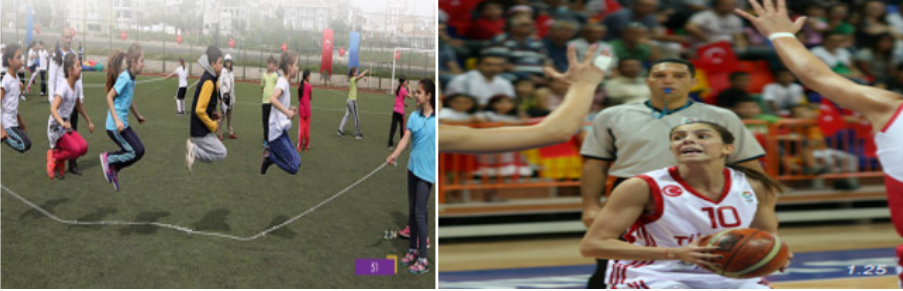
Şekil 13. Türkiye'de Kadının Sportif Etkinliklerde Temsili

İran'da kadınların herhangi bir spor dalına ilişkin tek bir görsel bile mevcut değildir. Türkiye'de kadın-erkek ip atlayan öğrenciler, basketbol oynayan kadın profili mevcuttur.