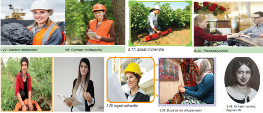
Şekil 12. Türkiye'de Kadının Çalışma Hayatındaki Temsili

Şekil 12 incelendiğinde Türkiye'de inşaat, maden, ziraat, orman mühendisi, avukat, eğitimci, resepsiyonist, tekstil sektöründe çalışan kadınlara ilişkin görsellere yer verilmiştir.