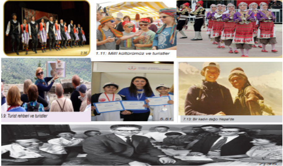
Şekil 14. Türkiye'de Kadının Sosyal Hayattaki Temsili

İran'da kadın çoğunlukla aile ve kızlara yönelik okul hayatında ele alınırken Türkiye'de gezi, mesleki etkinlik, bir kadın dışında tamamı erkeklerden oluşan bir görsel yer almıştır. Bu görseller Türkiye'nin kadını bir birey olarak kabul ettiğini ve erkekler ile kadınlar arasında ayrımcılık yapmadığını, her vatandaşın eşit değerlendirildiğini göstermektedir.