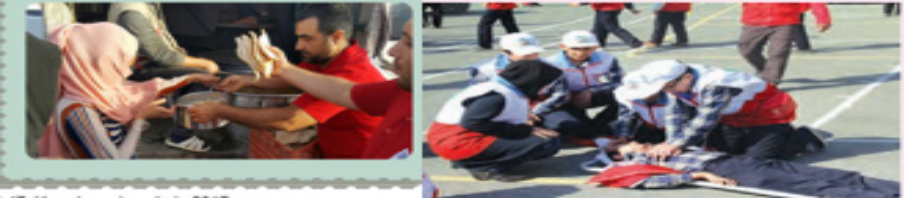
Şekil 7. Toplum İçin Çalışanlara Yönelik Görsellerde Kadın Profili

Toplum için çalışanlar Türkiye’de yemek yardımı; İran’da ilk yardım görseli yer almaktadır. Türkiye’de bu konuya ilişkin daha fazla görsel içeriği mevcuttur.