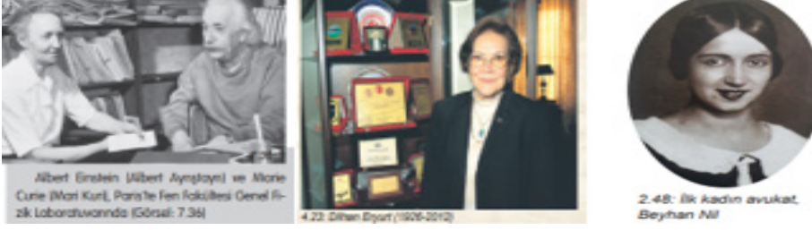
Şekil 16. Türkiye’de Önemli Kadınların Ders Kitaplarındaki Görselleri

Türkiye Sosyal Bilgiler ders kitaplarında ilk Türk kadın avukat ile astrofizikçi kadın görseli ile birlikte Albert Einstein’ın yanında Nobel Ödülü almış kadın kimyager Marie Curie’nin fotoğrafına yer verilmiştir. İran’da ise yalnızca erkek bilim adamları ve âlimlerin görselleri ele alınmıştır.