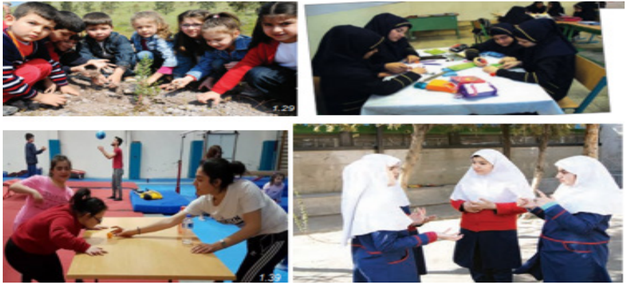
Şekil 5. Birinci Ünite Dördüncü Ders/Konu İçerisindeki Görseller

Görseller incelendiğinde Türkiye'de laik ve modern eğitim anlayışı çerçevesinde eşitlik anlayışı ile kadın ve erkek ele alınmaktadır. İran'da bir kadın ve kız çocuğunun diyalogunda "grubun etkili üyesi olmak için neler yapmalıyım?" sorusu sorulmuştur. İran'da kız-kıza topluluklar ele alınmıştır. Toplumun diğer yarısının erkek olduğu düşünüldüğünde karma eğitimin çocukları gerçek hayata hazırlama konusunda etkili olduğu söylenebilir.