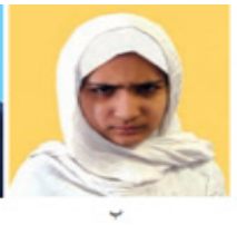
Şekil 3. Birinci Ünite İkinci Ders/Konu İçerisindeki Görseller

Şekil 3’te görüldüğü üzere İran’da şeriat hükümleri doğrultusunda kadın profilleri kapalı ele alınırken Türkiye’de kadın imajı daha modern ele alınmıştır.