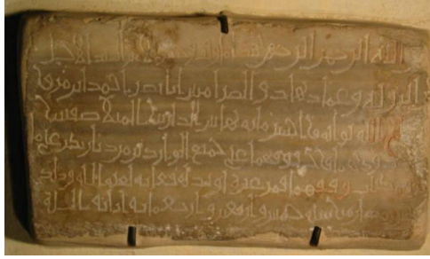
Fotoğraf 12. Nasrüddevle Ahmed'in Kudüs'teki 445/1053 tarihli vakıf kitabesi, ( https://islamicart.museumwnf.org )

Diyarbakır'ın 1540 tarihli tapu tahrir defterlerinde Harem-el Şerif Vakfı'na rastlanmaktadır. Şehirdeki bazı köylerin vakıf defterine kaydının sonradan yapılmış olması Harem-el Şerif Vakfı'nın Osmanlı öncesinde kurulmuş olabileceğini düşündürmektedir 25 . Harem-el Şerif ifadesi Diyarbakırlı hacılar için hac güzergâhında önemli bir konaklama ve inanç merkezi olan Kudüs için de