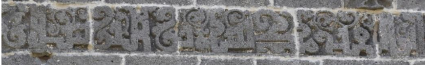
Fotoğraf 4. Büyük Selçuklu Burcu (481/1088-1089) Ebu'l Feth Melikşah b. Alparslan ibaresi