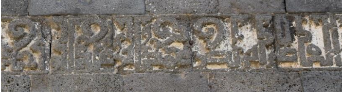
Fotoğraf 8. Tek Burç /Kadı Ebi Nasr Muhammed ibn Abdulvahid ibaresi