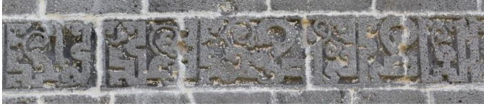
Fotoğraf 9. Melikşah (Nur) Burcu/ Kadı Ebi Nasr Muhammed b. Abdulvahid ibaresi