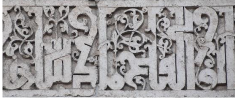
Fotoğraf 5. Ulu Camii kitabesinde geçen Ebu'l Feth Melikşah ibaresi

Kitabede adı geçen Cehir 1007-1008 yılında varlıklı bir ailenin ferdi olarak Musul'da dünyaya gelmiştir. İlk dönemler bölgede hüküm süren Ukayliler'in hizmetine girmiş ve bazı anlaşmazlıklar sonucu Halep'e gitmek zorunda kalmıştır. Halep'ten Malatya'ya ve daha sonra Diyarbakır'a geçerek Mervani emiri Nasrüddevle Ahmed'in vezirliğine tayin edilmiştir (1054-1055) (Amedroz, 1903, s. 136; İbnü'l Ezrak, 1975, s. 144-145; İbn Hallikan, 1978, s. 131; Cahen, 1991, s. 384; İbnü'l Esir, 1991, s. 162; Özaydın, 1992, s. 447; Yaz, 2019b, ss. 77-78) 13 . Büyük Selçuklu Sultanı Melikşah şehrin fethi (1085) için daha önce hem Mervaniler'in hem de Abbasiler'in vezirliğini yapmış olan Fahrüddevle 14 Cehir'i- Fahrüddevle Muhammed bin Cüheyr'i görevlendirmiştir 15 . Fetih