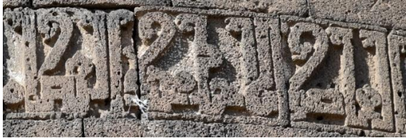
Fotoğraf 10. Fındık Burcu, Kadı Ebi Nasr Muhammed'e yapılan övgüler

Sultan Melikşah'ın 1088-1093 yılları arasındaki inşa faaliyetlerinde yalnızca Ulu Camii yazıtında bina nazırına vekil atandığı açıklanmıştır. Bu atama şehirde onarım ve inşa çalışmalarının yoğun olduğunu, Ulu Camii ile eş zamanlı imar çalışmalarına girilmiş ve Kadı Ebu Nasr Muhammed'in başka yapılarla da ilgilenmiş olabileceğini akla getirmektedir. Urfa Kapı ile Dağ Kapı arasında, bugün Çift Kapı olarak bilinen mevkinin kuzeyindeki burç 1091-1092 yılında onarılmıştır (Combe, Sauvaget ve Wiet, 1936, s. 265; Gabriel, 1940, s. 318; Beysanoğlu, 1987, s. 253). Buradaki kitabede sadece burcun yenilendiğini belirten ibare ve tarih kısmı günümüze ulaşmıştır. Kadı Ebu Nasr Muhammed,