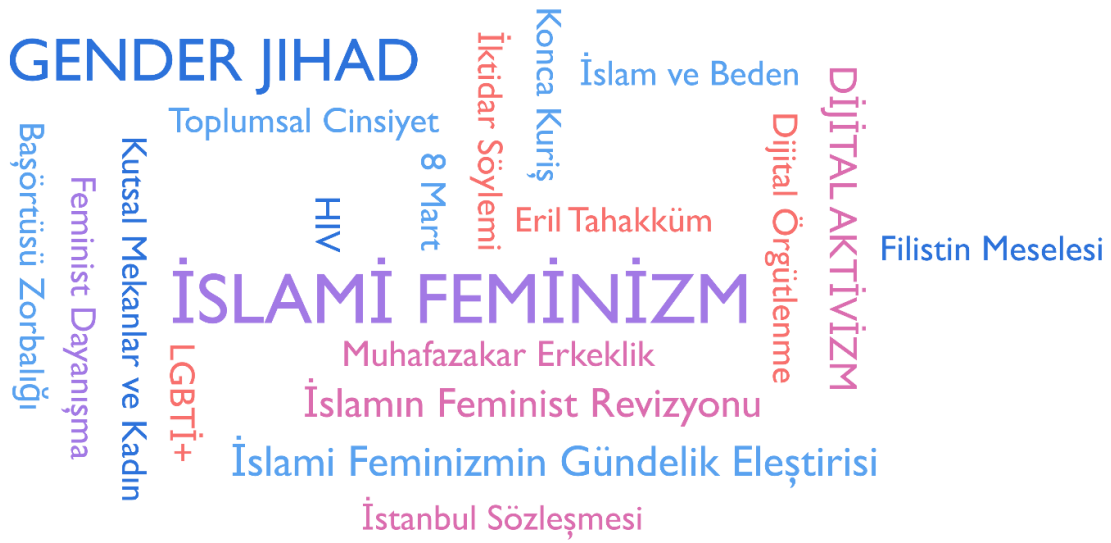
Şekil: 1. Kod Bulutu

Araştırma kapsamında ortaya çıkan tema ve kodların iki ayrı yöntem uygulanarak oluşturuldukları ifade edilebilir. Bunlardan ilki mevcut literatüre dayanmaktadır. Özellikle de bu çalışma açısından ayrıcalıklı bir önem atfeden “gender jihad” kodunun gerçekte literatürde toplumsal cinsiyet adaletini İslami feminist bir bakış açısıyla harekete geçirmeye çalışan toplumsal mücadeleyi açıklamak üzere kullanıldığına tanıklık etmekteyiz (Wadud, 2008). Kavramsal olarak kendisine gender jihad olarak karşılık bulan toplumsal gerçeklik aslında Türkiye’de İslami feminist hareketi örgütlemeye çalışan kadınların toplumsal mücadelesi anlamına da gelmektedir.