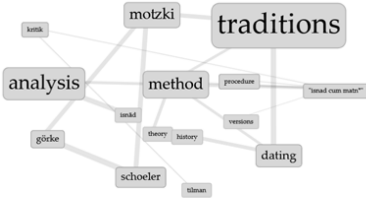
Tablo 3. Isnad cum Matn analiziyle ilgili kelimelerin metin içindeki bağlantılarını gösteren görsel

Hadis ilimleri, hadis problemleri ve hadis yorumuna dair makale sayısı ise toplamda 32'dir. Tüm bunlar haricinde hadisle ilgili eserlere dair 23, kültür tarihi kapsamında kabul