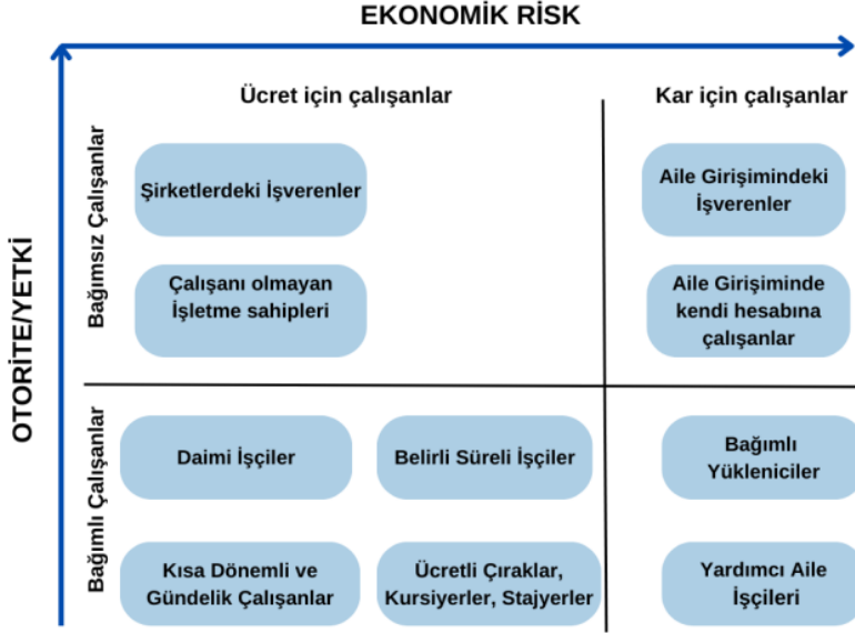
Şekil 2: ICSE-18 İstihdam Matrisi

*ICSE-18 Kılavuzundan(ILO,2023) alınarak Türkçeleştirilmiştir. Tablodaki “yardımcı aile işçisi(contributing family workers)” kategorisi “ücretsiz aile işçisi” kategorisi ile teknik olarak aynıdır