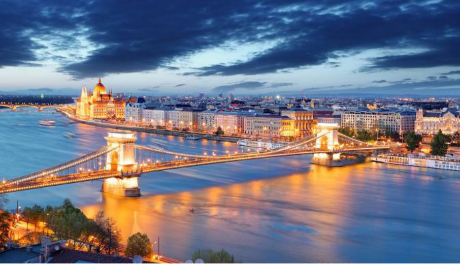
Fotoğraf 6: Budapeşte Tuna'nın Üstündeki Zincirli Köprü (1840-49)

Budapeşte'de Tuna'nın iki yakasını oluşturan Buda ve Peşte'yi birbirine bağlayan inşa zamanının (1840-49) mühendislik harikası Zincirli Köprü (Szechenyi/ Chain Bridge) ve aslan heykelleri ile Kahramanlar Meydanı her turist kfilesinin uğrak yeriydi. Ancak şehrin ortasından akan Tuna Nehri ile iki yakasındaki mimari uyum görmeye değerdi. Avrupa Medeniyet dairesindeki şehirler modernizmin çirkin yüzü apartmanlara kurban edilmemiş. Yüz elli yıllık Osmanlı hâkimiyeti devrinden kalma yegâne eser Gülbaba Türbesi ve Bektaşî Tekkesidir. Gülbaba buraya 1531 yılında Kanuni Sultan Süleyman tarafından gönderilmiş ve burada bir tekke kurmuş, Bektaşî hoşgörüsü ile kısa zamanda Buda (Budin) halkının sevgilisi haline gelmiş, 1 Eylül 1541 günü Budin Savaşı'nda şehit düşmüş, cenaze namazını, Kanunî kumandasındaki Osmanlı Ordusunun katılımıyla Ebussuud Efeni kıldırmış ve şimdiki türbesinin bulunduğu yere defnedilmiş, Budin Beylerbeyi Mehmed Paşa tarafından üzerine bir türbe yaptırılmış, daha sonra da yanına bir tekke eklenilmiştir (Eyice, 1996: 228-230). Gülbaba ziyaretinden sonra Hun-Türk Kurultayı'nın yapılacağı Bugaç'a doğru yola çıktık.