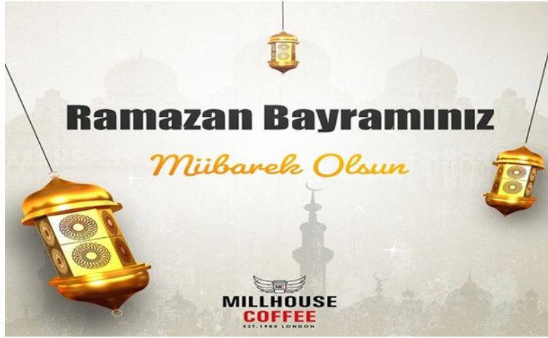
Görsel 7. Millhouse Coffee,

https://www.instagram.com/millhousecoffee?igsh=MTA4dTR6YjBiNHB6OQ== (09.04.2024)