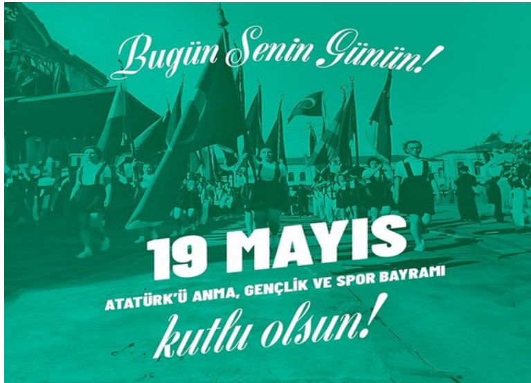
Görsel 6. Coffy, https://www.instagram.com/coffy_tr?igsh=MWJONmxlcNzZMjZ3Mg==