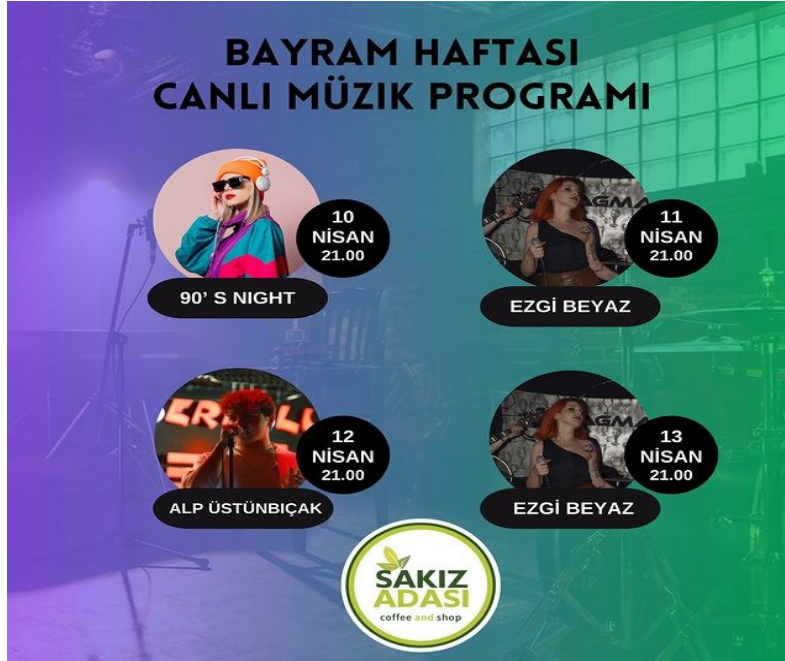
Görsel 9. Sakız Adası Buca,

tercihini etkileyen bir diđer faktör olarak karşımıza çıkmaktadır. Bireyler kültür ve sanatın mekânla birleşiminden etkilendiđi gibi mekân tercihini de buna bađlı olarak belirleyebilmektedir. Müzik vb. kültür sanat alanlarında müşterilere sunulan görsel ve işitsel deneyim tüketiciler için önem arz ederken bu ekseninde mekânın tercihi için önemli bir faktör olmaktadır. Sosyal medya aracılıđıyla da bunun paylaşılması bu ekseninde mekânın tercih edilebilirliđini arttırmaktadır. Gönderilerin açıklamalarında yer alan řu ifade, paylaşımları destekleyici nitelik taşımaktadır: Bayram Haftası Etkinlik Programımız ile Sizlerleyiz!! (Görsel 9),