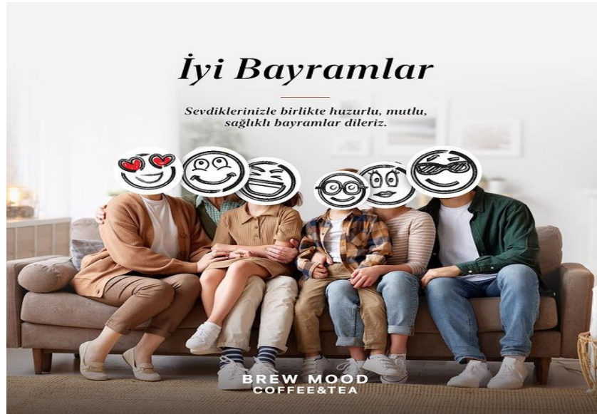
Görsel 8. Brew Mood Coffee-Tea,

Ayrıca bir işletme aile ve dini bayramı bir görselde sayfasında yer vermiştir ( Görsel 8 ).