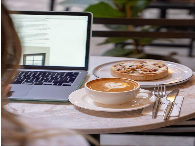
Görsel 3. Fabbro’s Coffee,

Yapılan arařtırmada, 108 kafe incelendiđinde, kafelerin 34 tanesinin sosyal medya paylařımlarında görsel öđelerle haz kategorisini vurguladıđı görülmektedir. Haz, kafelerin sosyal medya hesaplarında en çok önem verdiđi kategori olarak ön plana çıkmaktadır. Görsellerin sosyal medya kullanıcılarına hitap edecek řekilde sunulması kullanıcılar ağısından merakı arttırdıđı gibi kafenin de bu bağlamda müşteri kazanmasını sađlamaktadır. Tat müşterilere yansıtılan görsellerden çok daha önemlidir. Ancak müşterilerin kafenin ürünlerine olan yaklařımını belirleyen en önemli faktör görseldir. İyi görseller müşterilerde haz uyandırmakla birlikte kafenin işleyişine de önemli katkı sađlamaktadır. Bu sebeple hazın görseller aracılıđıyla sađlanması kafelerin sosyal medya hesapları için önem taşımaktadır. Bununla birlikte gönderilerin altında yer alan ağıklamalar da görselleri destekleyici niteliktedir. Örneđin İşte o hafta sonuna kadar modunuzu düşürmeme garantisine sahip ikili! (Görsel 3), müşterilere iyi tatlar sunulacađının garantisini vermektedir. Ayrıca “Sosyal medya araçlarının her geçen gün artması ile birlikte bireylerin gösteriřçi tüketimlerini sergileme mekânları da o derece artmaktadır” (İflazođlu ve Ünlüönen, 2020, s. 2610). Haz alma ve bunun görseller aracılıđıyla sosyal medyaya tařınması tüketici ağısından çekici bir faktör olmaktadır. Kafeler tüketicileri etkilemek amacıyla paylařımlarında haz duygusunu, yeni tatları, lezzetleri vurgulamayı sıkça yapmaktadır.