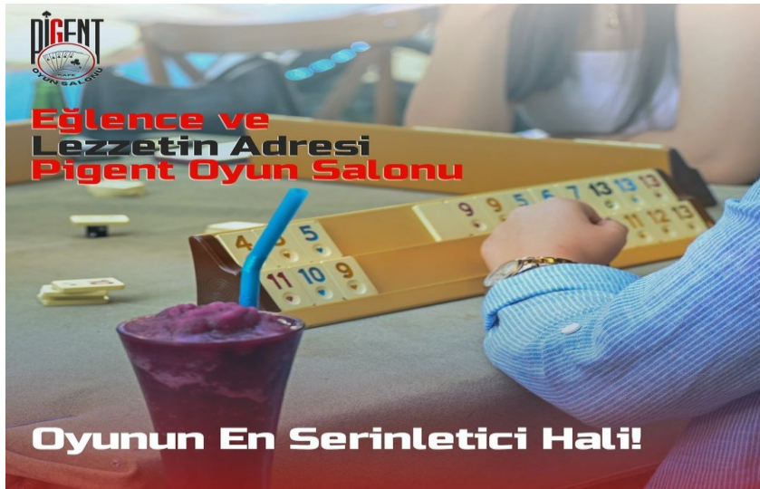
Görsel 10. Pigent Cafe, https://www.instagram.com/pigentcafe?igsh=MTN3dWZ4dDRiajJ2NA==

Buca'daki bazı kafelerin boş zaman geçirme, eđenceye, oyuna yönelik paylařımları tercih ettiđi ve de çekiliř yaparak bunu teřvik ettiđi söylenebilir.