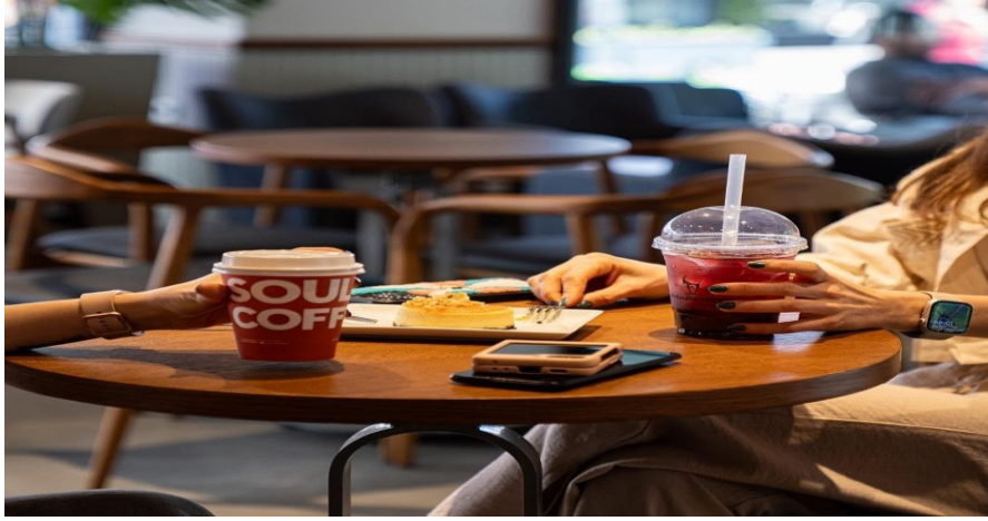
Görsel 1. Soulmate Coffee, https://www.instagram.com/soulmatetr?igsh=eHdjeXhieTUzOHQ3 (Gönderi tarihi 10.06.2024).

İçeceklerinin tadını çıkarın! (Görsel 1) cümlesi kafenin sosyalleşme-arkadaşlık kategorisine vurgu yaptığını göstermektedir. Ayrıca Güzel dostlukların ve lezzetli kahvelerin buluşma noktası (Görsel 2) gönderisindeki ifade kafelerin sosyalleşme açısından önemli bir mekân niteliđi taşıdığı görülmektedir.