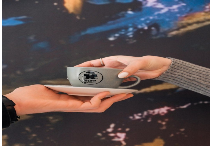
Görsel 2. Coffee Ninova, https://www.instagram.com/coffeeninova/ (Gönderi Tarihi 01.05.2024).