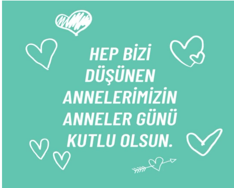
Görsel 4. Coffy, https://www.instagram.com/coffy_tr?igsh=MWJONmxlcNZZMjZ3Mg== (12.05.2024)