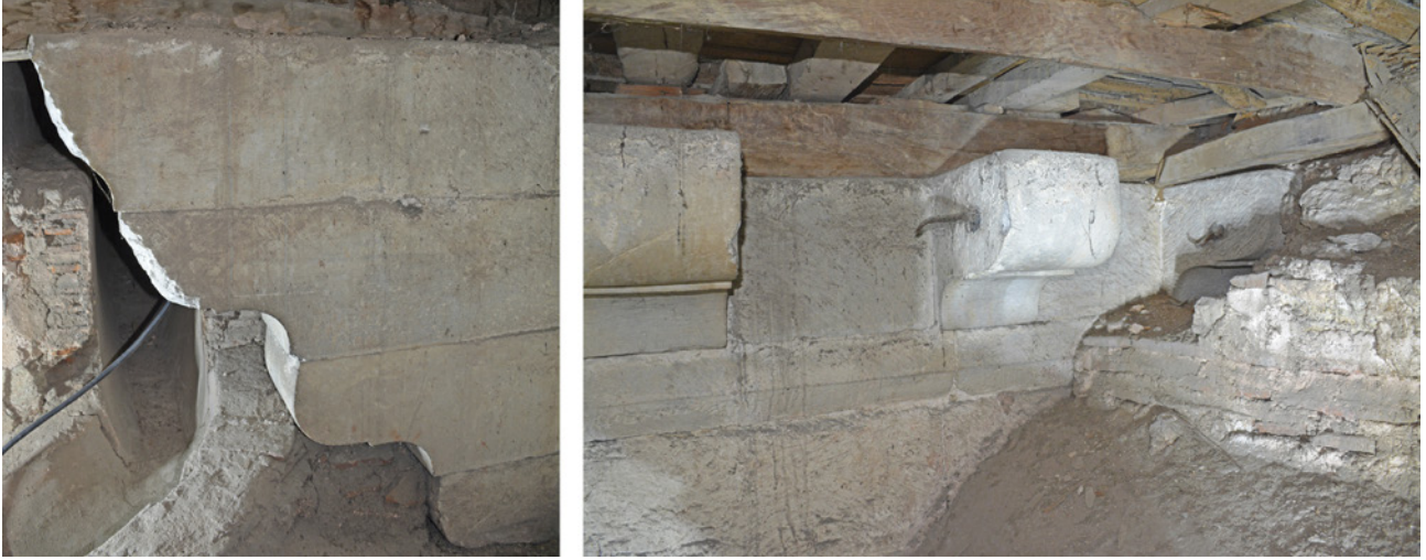
4 17. yüzyıl gravürlerinde görülen, günümüzde döşeme altında kalmış taş konsollar, 2018 (Furkan Al)

Guillaume-Joseph Grelot'un Haliç kıyılarında Topkapı Sarayı'nı gösteren gravürü (yak. 1672), 17. yüzyılda odanın dışarıdan eğimli bir çatı ve kubbeye örtüldüğüne dair en önemli kanıtını sunmaktadır. (Resim 5)