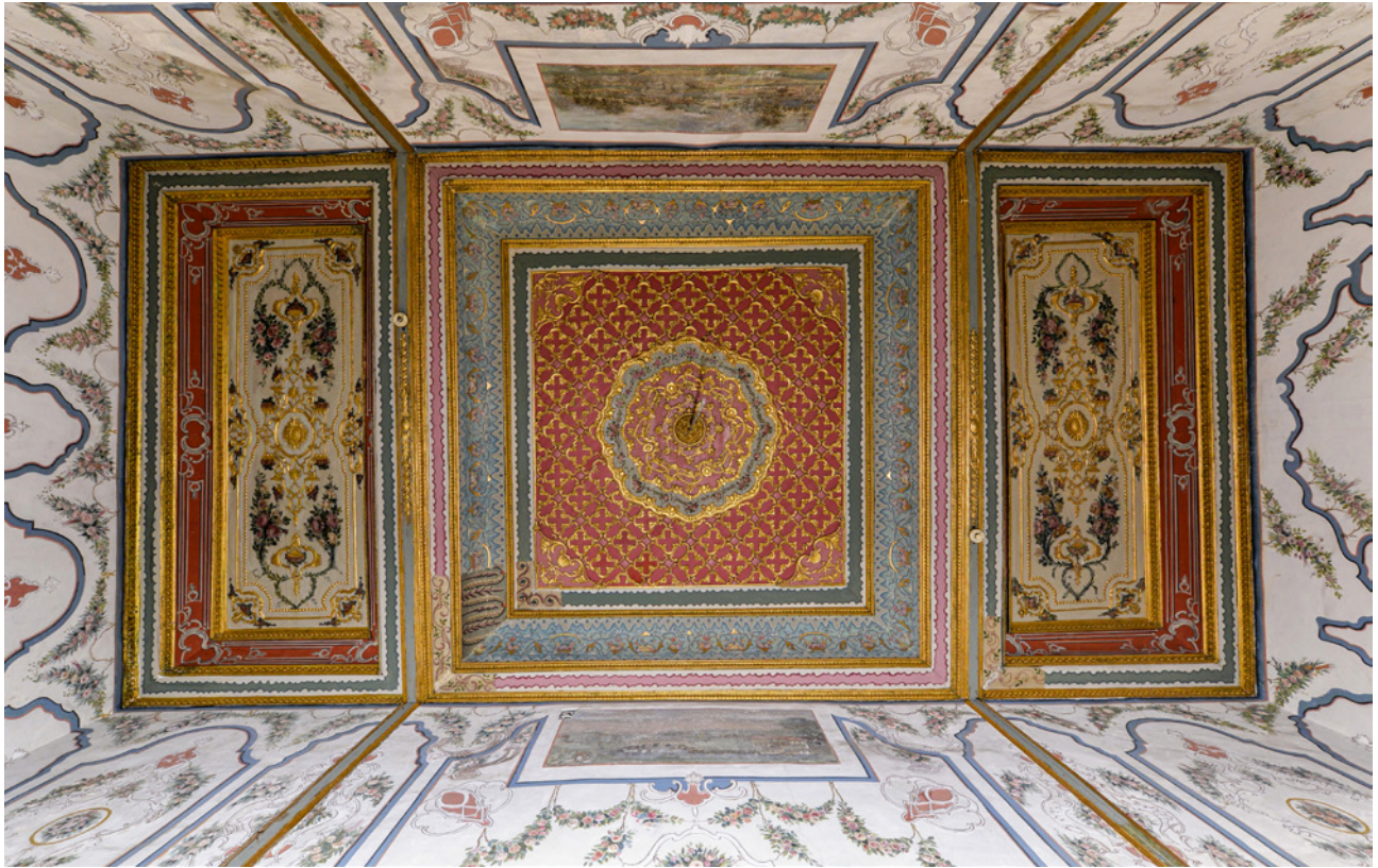
6 Sultan I. Abdülhamid Odası'nın tavanının restorasyon öncesi görünümü

Odada barok üsluptaki gösterişli çeşme ve ocağın bulunduğu ana mekân kâgir duvarlarla çevrilmiş, taşlığa eyvan biçiminde bir çıkma yapan alçak tavanlı sofası ise ahşap strüktür olarak yapılmıştır. Duvarlar yer yer 18. yüzyılda Avrupadan ithal edilen çinilerle bezelidir. Ocağın arka tarafında Hazine Odası olarak bilinen küçük bir oda bulunmaktadır. Hazine Odası'nın pencereleri, üst kotuna III. Selim Odası yapıldıktan sonra merdiven sofasının içinde kalmış, böylece bu mekân loş bir odaya dönüşmüştür. 8 Ocaklı ana mekânın üzerinde ise III. Selim'in Meşk Odası yer almaktadır.