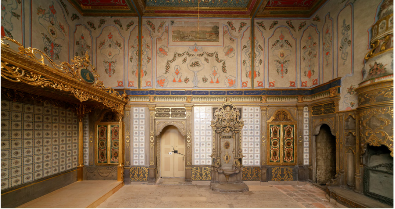
2 I. Abdülhamid Odası'nın genel görünümü, 2023

bölümünün Sultan IV. Mehmed döneminde kubeli olduğunu gösteren izler tespit etmiştir. Ayrıca odanın daha sonra III. Osman Köşkü'ne geçiş mekânı olarak kullanıldığını, Sultan I. Abdülhamid döneminde tekrar dekore edildiğini, Sultan III. Selim zamanında ise ek inşaatlar yapıldığını, bu sırada kubbesinin ve III. Osman Taşlığı yönündeki cephesinin yıkılarak ahşap bir tavanla örtüldüğünü, ahşap karkaslı kâgir dolgulu çıkmalı bir bölüm eklendiğini belirtmiştir. 5