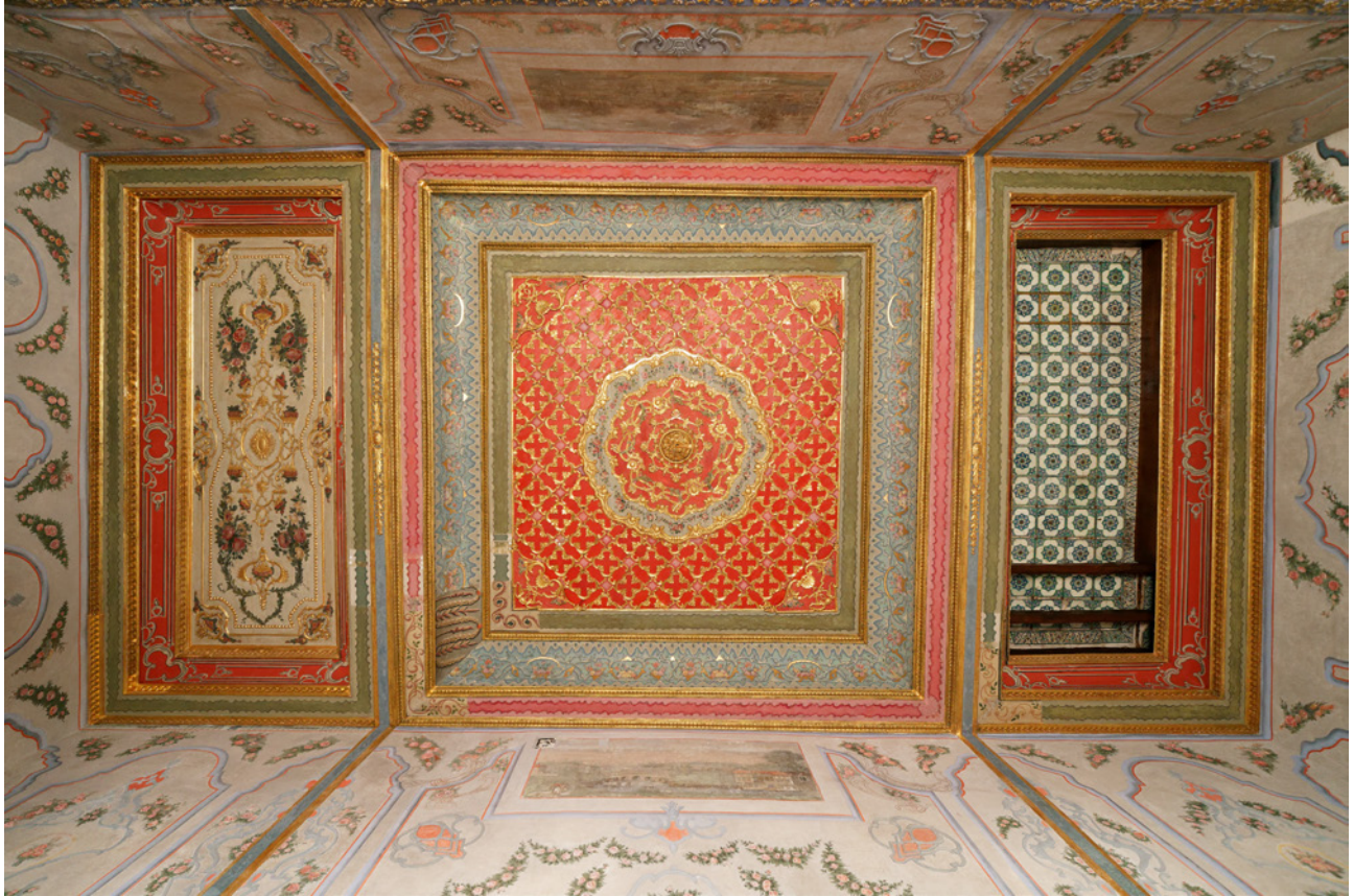
7 Sultan I. Abdülhamid'in Odası'nın tavanının restorasyon sonrası görünümü

I. Abdülhamid Odası'nın tavanlarındaki bezemeli kanvasların altında yeni keşfedilen çiniler, 1665 yangınından sonra Harem mekânlarında kullanılan çinilerin çoğunluğunda 10 olduğu gibi 17. yüzyılda İznik çini fırınlarında üretilen şeffaf sıraltı boyama tekniğinde yapılmışlardır. Çini karoların beyaz yüzeyleri üzerindeki motiflerin zeminleri mavi, konturları turkuaz veya yeşildir. Bu karolarda sarı ve kırmızı renkler de kullanılmıştır. Çini kaplı tavanlar, Osmanlıların mimarlık pratiklerinde ender görülen bir uygulama olmasına rağmen erken dönemin ünlü yapısı Bursa Yeşil Camii'nin hünkâr mahfilinin tavanına altın yaldızlı başları olan çivilerle mihlanmış renkli sırla boyama tekniğinde kare levhalar tespit edilmiştir. 11 Fakat bu kullanımın yaygınlaşmadığı gözlenmektedir.