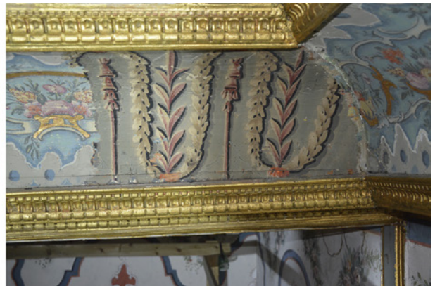
3 II. Mahmud dönemine tarihlenen ampic üslubunda kalem işi uygulamaları, 2019 (Furkan Al)