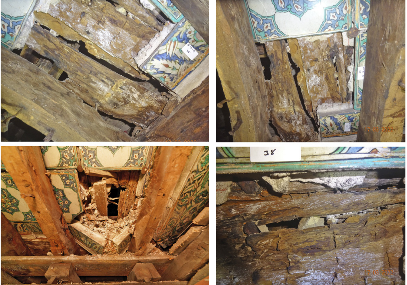
11 Kanvas söküldükten sonra Hünkâr Sofası yönündeki çinili tavanda görülen bozulmalar

sökülmüş, çini atölyesinde konservasyonları yapılmıştır. Sözü edilen çinilerin tekrar montajının mümkün olmaması sebebiyle kurul kararıyla saray deposunda muhafaza edilmesine karar verilmiştir.