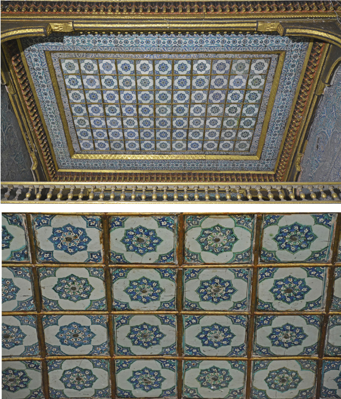
8 Valide Sultan Yatak Odası'nda şirvan üzerine konumlanan çini kaplı tavanın görünümü, 2022

teknik, motif ve kompozisyon açısından aynı özellikleri paylaşmaktadır. (Resim 8) Her iki odadaki dikdörtgen biçimli tavan, birbirini kare biçiminde kesen varaklanmış ahşap çıtaların arasına yerleştirilen çini karolarla yapılmış, çini karolar varaklı çivilerle mihlanmıştır. Bu benzerlik, her iki odadaki çinili tavanların 1667 yılındaki yenilemeler sırasında beraber tasarlandıklarını düşündürmektedir.