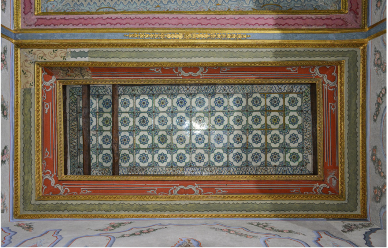
9 Kanvas söküldükten sonra ortaya çıkan çinili tavanın görünümü, 2023 (Furkan Al)

dolanmaktadır. Onun dışında ahşap mukarnaslı bir çerçeve, en dış kuşakta ise yine çinili bordürler görülmektedir. (Resim 9-10) Hazine Odası yönünde bulunan tavandaki çinilerin durumu, Hünkâr Sofası yönündeki çinili tavana göre oldukça iyi durumdadır. Özellikle Hünkâr Sofası yönündeki çinili tavanda geçmiş dönemlerde çatıdan su sızmış, ahşap elemanlarda çürüme ve mantara bağlı olarak kesit kayıpları oluşmuştur. Çinilerin sabitlendiği kaplamaların çürümesi sonucunda çinilerin birçoğunun kırışlar üzerine düşerek sıkıştığı, bu nedenle sabit