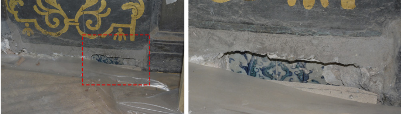
14 Sultan I. Abdülhamid Odası’nda süpürgelik seviyesinde yapılan sıva onarımları sırasında bulunan 17. yüzyıl çinileri (Furkan Al)

I. Abdülhamid Odası’nda 2022 yılındaki restorasyon çalışmaları sırasında odanın 17. yüzyıl çinilerine dair yeni bir bulgu daha ortaya çıkmıştır. Hamam koridoruna bakan kapının bitişiğindeki süpürgelik seviyesinde sıva onarımları yapılırken, kalın sıvanın altında çini karolar bulunmuştur. Şimdiye kadar gün yüzüne çıkmamış bu çinilerde kullanılan sırrın kalitesi ve renk tercihleri değerlendirildiğinde, bunların da tavanlardaki çiniler gibi 17. yüzyıla ait olduğu kanaatine varılmıştır. Bu alan, duvar yüzeyinin 18. yüzyıla ait bezemesini bozmamak amacıyla daha fazla açılmamış, sadece sıva katmanı altındaki bulguyu gösterecek şekilde bırakılmıştır. Bu çinilerin süpürgelik seviyesinde kalmadığı, koridora açılan duvarı en azından belli bir yüksekliğe kadar kapladığı düşünülebilir. (Resim 14)