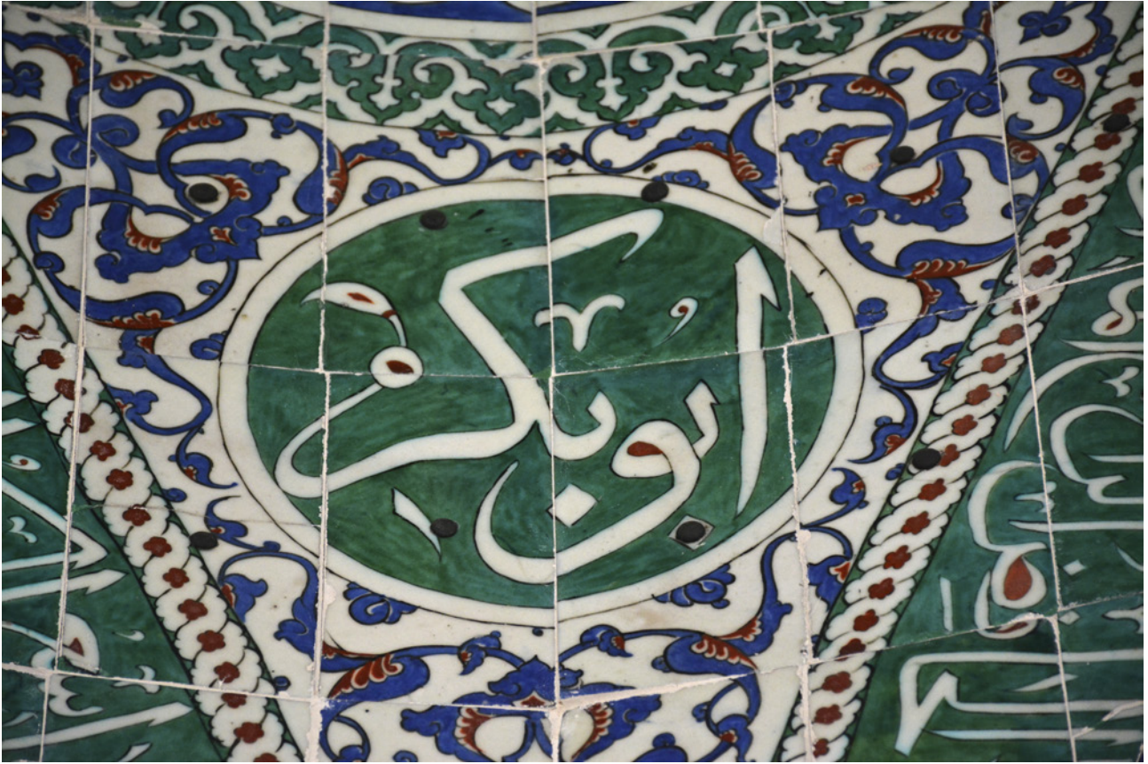
13 I. Ahmed Okuma Odası'nda çivili çini uygulaması, 2021 (Furkan Al)

Bursa Yeşil Camii ve Türbesi'nde ve Edirne Muradiye Camii'nde, 16 yüzyılda Eyüp Sultan Türbesi'nde, 17. yüzyılda ise Şehzade Camii'nin avlusundaki Destarî Mustafa Paşa Türbesi'nde de kullanılmıştır. Topkapı Sarayı'ndaki çiviyle zapt edilen çinilere örnek olarak Valide Sultan Taşlığı, Valide Sultan Yatak Odası, Şadırvanlı Sofa, Kızlar Ağası Yatak Odası ve I. Ahmed Okuma Odası'ndaki 17. yüzyıla tarihlenen çini kaplamalar verilebilir. 14 (Resim 13)