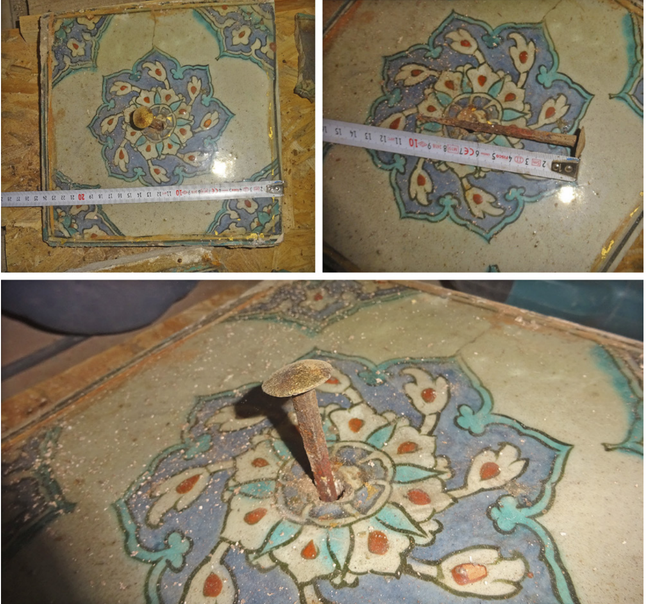
12 Çini karo ve merkezindeki altın varaklanmış mihlin görünümü

çıkılmış, çiviler ise zaman içinde paslanmış. Çalışma sırasında çivilerin üzerinde yer yer altın varak kalıntıları da tespit edilmiştir. Bu tespit, çivilerin korozyona uğramadan önce çinilerin yüzeylerinde görülen geniş başlarının altın varaklı olduğunu ispat etmektedir. (Resim 12)