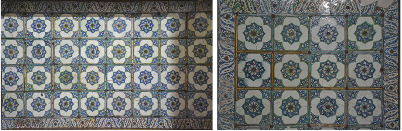
10 Kanvas söküldükten sonra ortaya çıkan çinili tavandan ayrıntı, 2023 (Furkan Al)

durduğu, bazı çinilerin ise kanvasın arkasına düştüğü tespit edilmiştir. (Resim 11) Bu kısımdaki çiniler, kanvas yerinden çıkarıldıktan sonra belgeleme çalışmaları sonrası numaralandırılarak dikkatle