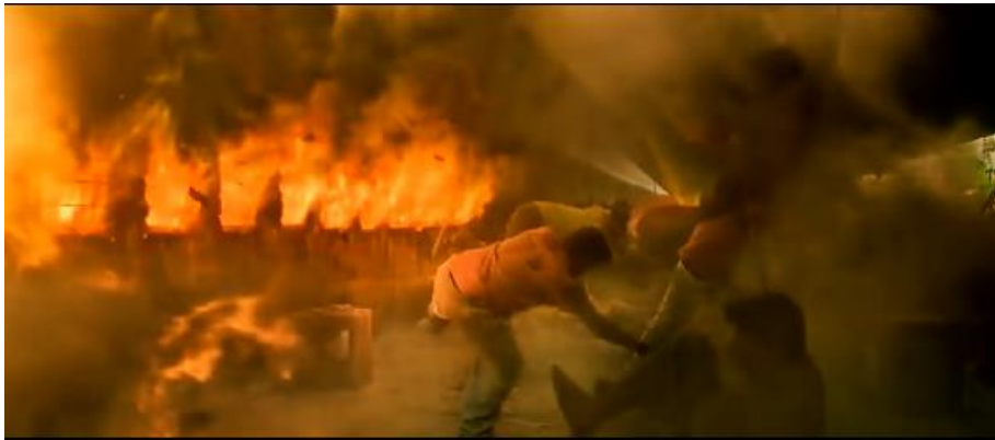
Şekil 7. PK Filminde Sahnelenen Terör Saldırısı

İnsanların dini hassasiyetlerinden faydalanıp onlar üzerinden maddi ve manevi kazanç elde eden ve inanç sömürsü yapan insanlar da PK filminde eleştirilmiştir (Hirani, 2014a, s. 53:50, 1:32:00, 1:45:31). Allport'un dış güdümlü dindarlıkta tarif ettiği insan tipi PK filmindeki ilgili sahneler ile oldukça yerinde yansıtılmaktadır. Filmde dikkat çekilen ve dış güdümlü dindarlıkla ilişkilendirilebilecek bir başka nokta ise din-terör ilişkisidir. Şekil 7'de de görülebileceği üzere filmde Müslümanlarla bağdaştırılarak bir terör eylemi sahnesi kullanılmıştır. Filmde bu eylemin dini korumak amacıyla gerçekleştirildiği vurgulanmıştır (Hirani, 2014a, s. 2:01:53-2:03:55). Naimi (2018) çalışmasında bu tarz terör saldırılarını "sağ motifli" olarak nitelendirmiş; dini temellerin kullanılarak eylemlerin yaptırıldığını; dini kendi çıkarları doğrultusunda anlamlandırarak zulme kılıf uydurduklarını, teröre dini mesnet göstererek eylemlerine meşruiyet kazandırmaya çalıştıklarını ve dini istismar ettiklerini ifade etmiştir. (Naimi, 2018, s. 60-62).