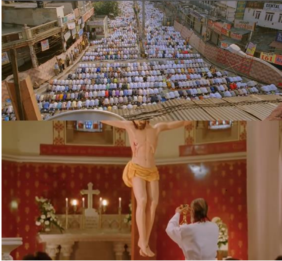
Şekil 9. PK Filminde İbadet Boyutu ile İlgili Örnek Sahneler

Hinduizm üzerinden örneklendirilen, insanların din adına yaptıkları bazı dini davranış ve halk inanışları çalışmanın dindarlık temasında belirlenen son konusunu oluşturmaktadır. PK filminde özellikle din adına yapılan bazı davranışların doğrudan eleştirildiği görülmektedir (Hirani, 2014a, s. 1:26:56-1:27:40). Eleştirilen dini davranışlara Tanrıların süt ile yıkanması, tapınaklara yuvarlanılarak ya da dizlerin üzerinde gidilmesi, türbelere kutsallık atfedilmesi ve ağaçlara ip bağlanması örnek olarak verilebilir (Hirani, 2014a, s. 1:07:55, 1:05:34, 1:07:32). Filmde de konu olan İslam'ın yanlış anlaşılmasına mahal verdiği için Kerbelâ Matemleri kapsamındaki Şiilerce yapılan yumruk, zincir ve bıçak kullanarak kendi vücutlarını harap etmeye yönelik uygulamalar da bunlara dâhil edilebilir (Hirani, 2014a, s. 1:06:45).