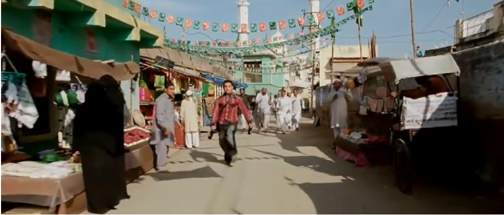
Şekil 4. PK Filminde Yansıtılan Müslüman Mahallesinden Bir Sahne

Müslümanların tanıtımında ise cami, ezan sesi, namaz ibadeti, kıyafetler ile hilal ve yıldız sembolü tercih edilen başlıca öğeler arasındadır (Hirani, 2014a, s. 1:01:12, 1:23:58, 1:06:20, 1:45:16). Müslümanların günlük yaşantısının yansıtılmasına yönelik bir örneği Şekil 4'te görmek mümkündür.