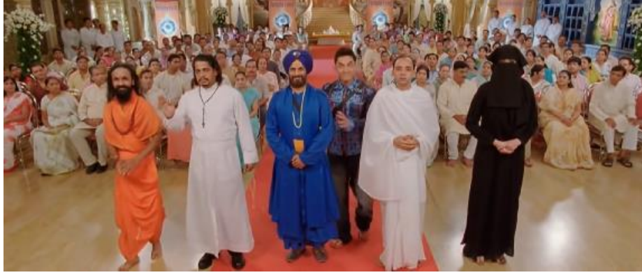
Şekil 1. Farklı Dinlerin Ele Alındığı Bir Sahne

PK filminde öne çıkan dinlerin Hinduizm, Hristiyanlık ve İslam dini olduğu söylenebilir. Bu düşüncenin oluşmasında, söz konusu dinlere filmde sistematik olarak farklı açılardan yer verilmesi etkili olmuştur. Örneğin Hinduizm (Hirani, 2014a, s. 17:35, 55:25, 1:04:16), sonra Hristiyanlık (Hirani, 2014a, s. 20:00, 58:00, 59:39, 1:04:43) daha sonra da İslam (Hirani, 2014a, s. 60:00, 1:00:32, 1:04:34, 1:06:20, 1,23:58, 2:10:36,) izleyiciye tanıtılmıştır. Buna ek olarak her bir dinin kapsamındaki belirli konular eleştirilmiştir. Şekil 2’de olduğu gibi dinlerin tanıtımında genellikle ideolojilerinden ziyade o dine ait görsel ve işitsel motiflere ağırlık verilmiştir. Hinduizm’in tanıtımında öne çıkan unsurlar; Tanrı heykelleri, Tanrı resimleri, Ganj nehri ve vimona gibi kutsal mekânlar ve törenlerdir (Hirani, 2014a, s. 17:35, 26:50, 55:25, 1:04:16, 45:45).