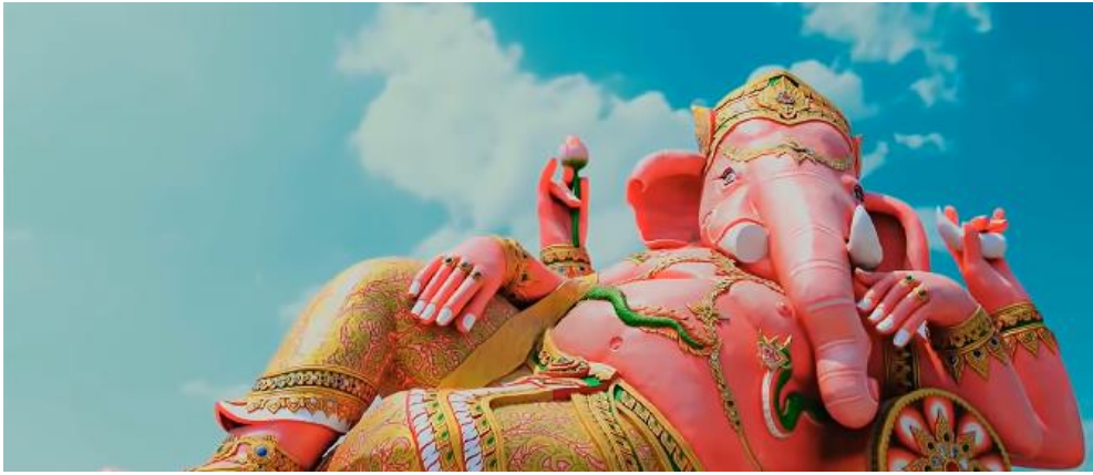
Şekil 2. Hinduizm Dininde Tanrı Ganesha’nın Heykelinin Gösterildiği Sahne

PK filminde öne çıkan dinlerin Hinduizm, Hristiyanlık ve İslam dini olduğu söylenebilir. Bu düşüncenin oluşmasında, söz konusu dinlere filmde sistematik olarak farklı açılardan yer verilmesi etkili olmuştur. Örneğin Hinduizm (Hirani, 2014a, s. 17:35, 55:25, 1:04:16), sonra Hristiyanlık (Hirani, 2014a, s. 20:00, 58:00, 59:39, 1:04:43) daha sonra da İslam (Hirani, 2014a, s. 60:00, 1:00:32, 1:04:34, 1:06:20, 1,23:58, 2:10:36,) izleyiciye tanıtılmıştır. Buna ek olarak her bir dinin kapsamındaki belirli konular eleştirilmiştir. Şekil 2’de olduğu gibi dinlerin tanıtımında genellikle ideolojilerinden ziyade o dine ait görsel ve işitsel motiflere ağırlık verilmiştir. Hinduizm’in tanıtımında öne çıkan unsurlar; Tanrı heykelleri, Tanrı resimleri, Ganj nehri ve vimona gibi kutsal mekânlar ve törenlerdir (Hirani, 2014a, s. 17:35, 26:50, 55:25, 1:04:16, 45:45).