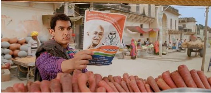
Şekil 10. PK Karakterinin Gandhi Posteriyle Havuç Satın Almak İstemesi

PK'in zihnindeki, çocuklardaki gibi somut düşünce evresine denk bir Tanrı tahayyülü filmin birkaç noktasında yansıtılmıştır (Hirani, 2014a, s. 52:14-55:15, 59:46, 1:11:00). Bu dönemde her inanç, ibadet ve Tanrı mutlak olarak haktır, sorgulanmaz. Piaget'ye (2016) göre, çocuklar bu evrede mantıksal kuralları ve sınıflandırmaları kullanabilmekte; ancak bunları sadece somut olay ve objelere uygulayabilmektedir (s.84-94). Bu evrenin filmde yansımalarını bulmak mümkündür. Örneğin PK, tapınaktan isteği kabul olmadığı için başını geri almak ister. Tanrı kavramının insanlar için kutsal olduğunu anladığından yanaklarına Tanrıların suretlerini yapıştırır. Tapınağın başı kutusundan para çaldığını zanneden görevliler PK'e vurmak istediğinde o, resimleri görevlilere gösterir ve onlar da PK'e vurmaktan vazgeçerler (Hirani, 2014a, s. 26:25-27:05).