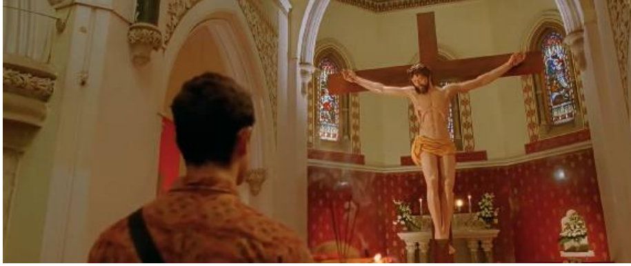
Şekil 3. PK Filmi Kilise Sahnesi

Müslümanların tanıtımında ise cami, ezan sesi, namaz ibadeti, kıyafetler ile hilal ve yıldız sembolü tercih edilen başlıca öğeler arasındadır (Hirani, 2014a, s. 1:01:12, 1:23:58, 1:06:20, 1:45:16). Müslümanların günlük yaşantısının yansıtılmasına yönelik bir örneği Şekil 4'te görmek mümkündür.