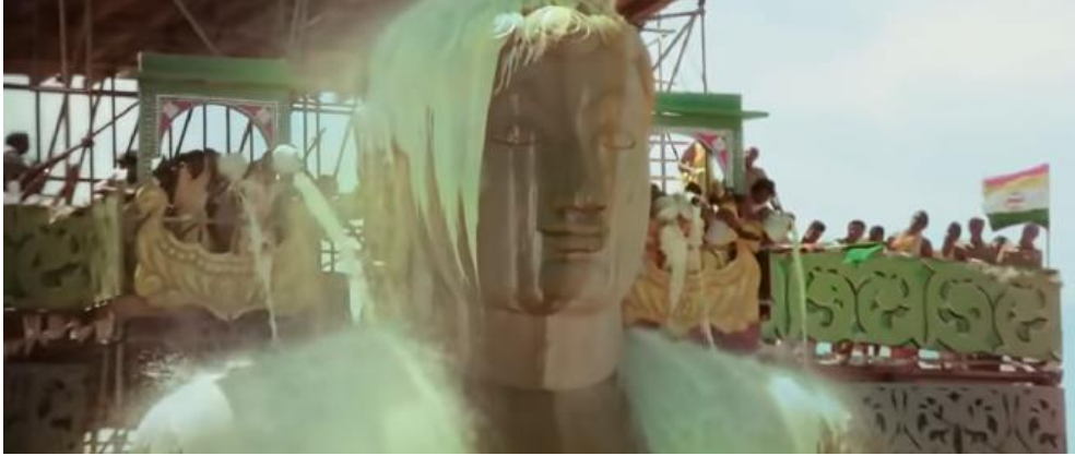
Şekil 6. PK Filminde Tanrı Heykelinin Süt ile Yıkanması Sahnesi

Hüseyin'in şehit edilmesinin anıldığı Kerbela Matemi etkinliklerinde Şiilerin yumruk, zincir ve bıçak kullanarak kendi vücutlarını harap etmesine yönelik bir sahne de bulunmaktadır (Hirani, 2014a, s. 1:06:45).