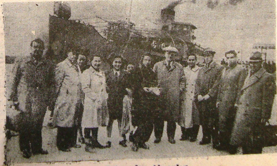
Dün gelen Almanlar

Bu para belki size az görünür, fakat etin kilosunun 60 Krş. olduğu nu söylemek bu hususta کافی fikir verebilir zannederim. Çorumda soğuktan başka hiç bir şikâyetimiz yoktur. Emniyetten izin aldığımız taktirde şehirden pek uzak olmanın bağlara bile gidebiliyorduk.