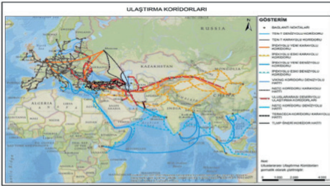
Şekil 2: Uluslararası Ulaşım Ağı (Ulaştırma ve Altyapı Bakanlığı, Türkiye Lojistik Master Planı Yönetici Özeti Raporu, 2017)