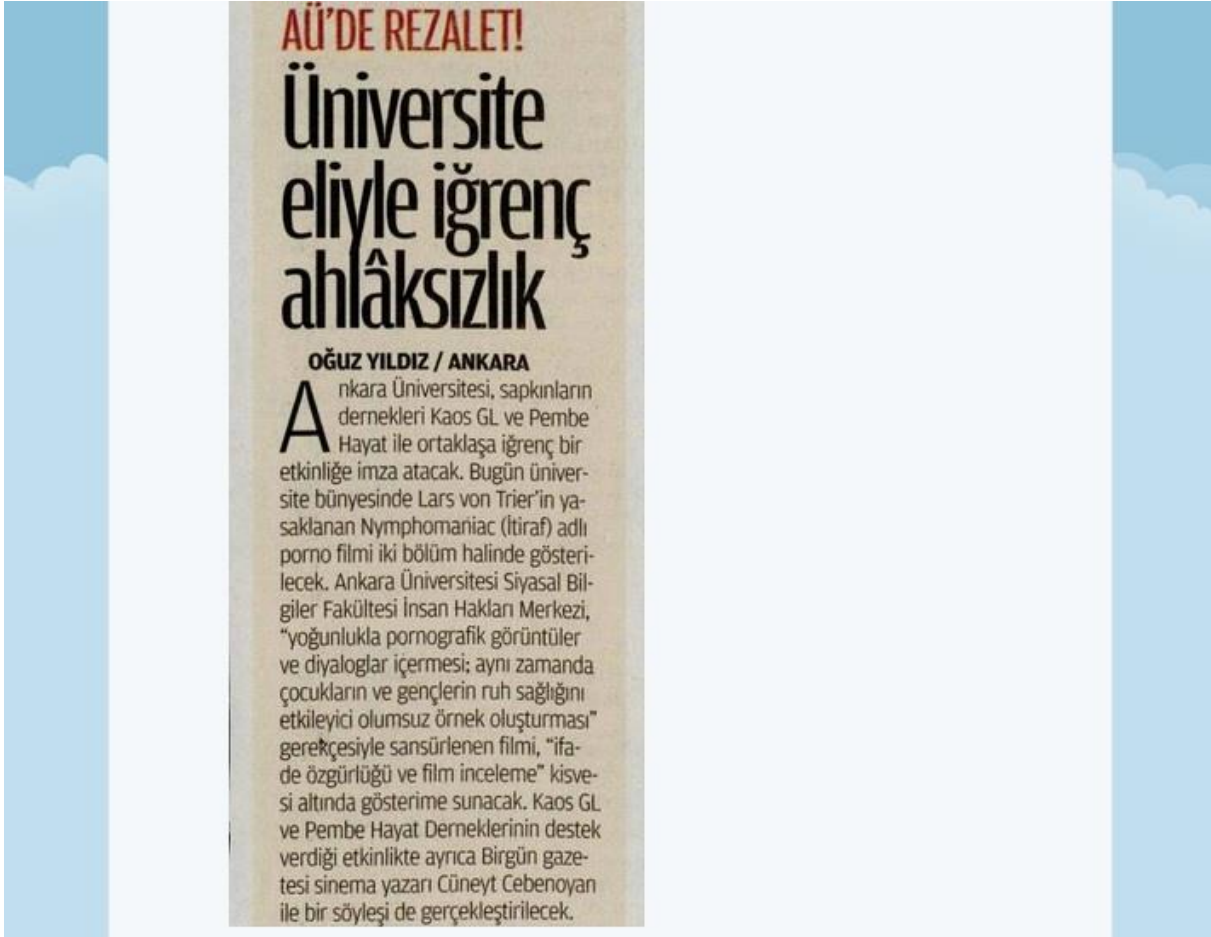
Görsel 3. Mahremiyet Teması Dâhilinde Görsel Öğe İçeren Tweet Örneği