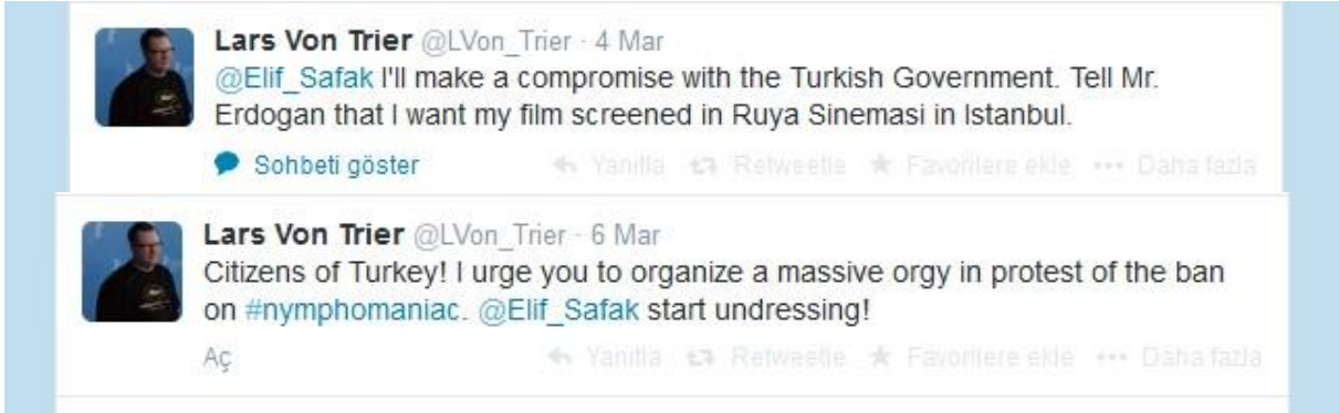
Görsel 4. Lars Von Trier'in Türkiye'deki İtiraf Sansürüyle İlgili Tweetleri

Keza, filmin yönetmeni Lars Von Trier'in ulusötesi ve evrensel bir çizgide, Türkiye halkını cinsel özgürleşmeye davet eden tweetleri (Görsel 4), # Nymphomaniac 'da yeniden tweetlenerek ( retweet ) paylaşımına sunulmuş, ulusal zeminde ilerleyen tartışma uluslararası boyutlara taşınarak geniş çaplı bir fenomene dönüşmüştür. 12