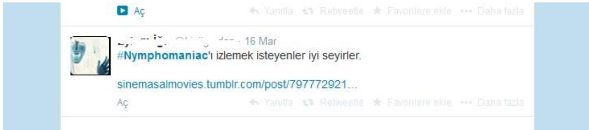
Görsel 2. Cinsel Özgürlük Teması Dâhilinde Link Paylaşımı İçeren Tweet Örneği

Tablo 1 ve Tablo 2'deki veri dağılımlarından anlaşılabilceği gibi, kullanıcıların kendi mahremelerini sorunsallaştırdıkları ya da Türkiye özelinde mahremiyetin olanaklarını sorguladıkları tweetlere rastlanmamış, buna karşın, cinsel özgürlük kavramını vurgulayan tweetler, bağdaşık bir hashtag ortaya çıkarmıştır.