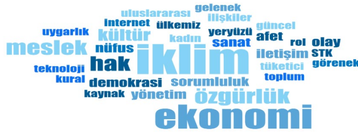
Görsel 1 Sosyal bilgiler derslerinde günlük yaşam deneyimlerinin kullanıldığı konular

Görsel 1’de yer aldığı üzere sosyal bilgiler öğretmenlerinin derslerde günlük yaşam deneyimlerini kullandıkları konular; iklim (f:7), ekonomik faaliyetler (f:6), hak ve özgürlükler (f:4), meslekler (f:4), demokrasi (f:2), doğal afetler (f:2), iletişim (f:2), kültürel özellikler (f:2), nüfus ve dağılışı (f:2), olaylar ve sonuçları (f:2), sorumluluklar (f:2), yönetim birimleri (f:2), çalışma hayatında kadınlar (f:1), doğal kaynaklar (f:1), dünyadaki güncel olaylar (f:1), gelenek ve görenekler (f:1), geleneksel el sanatları (f:1), genel ağıın kullanımı (f:1), halk oyunları (f:1), kültür ve uygarlık (f:1), sivil toplum kuruluşları (f:1), teknolojik gelişmeler (f:1), toplum (f:1), toplumsal kurallar (f:1), toplumsal roller (f:1), tüketici hakları (f:1), uluslararası ilişkiler (f:1), ülkemizin güzellikleri (f:1) ve yeryüzü şekilleri (f:1) olarak belirlenmiştir. Sosyal bilgiler derslerinde günlük yaşam deneyimlerinin kullanıldığı konulara yönelik öğretmenlerin görüşlerinden örnekler şöyledir: