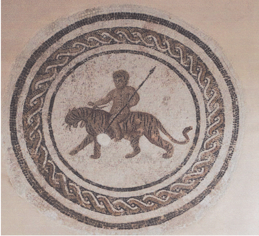
Resim 9 Kaplana binmiş Dionysos, Acholla Mozaïği (Sevilla-Sadeh 2021: fig. 4).