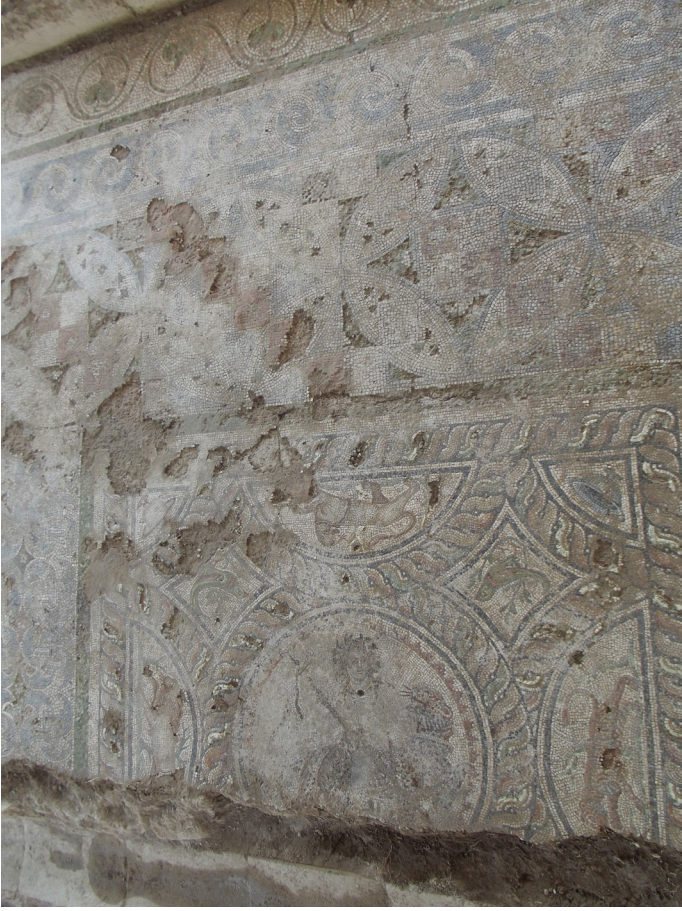
Resim 29 Figürlü sahne ve bordür, Claudiolopolis Mozađı.