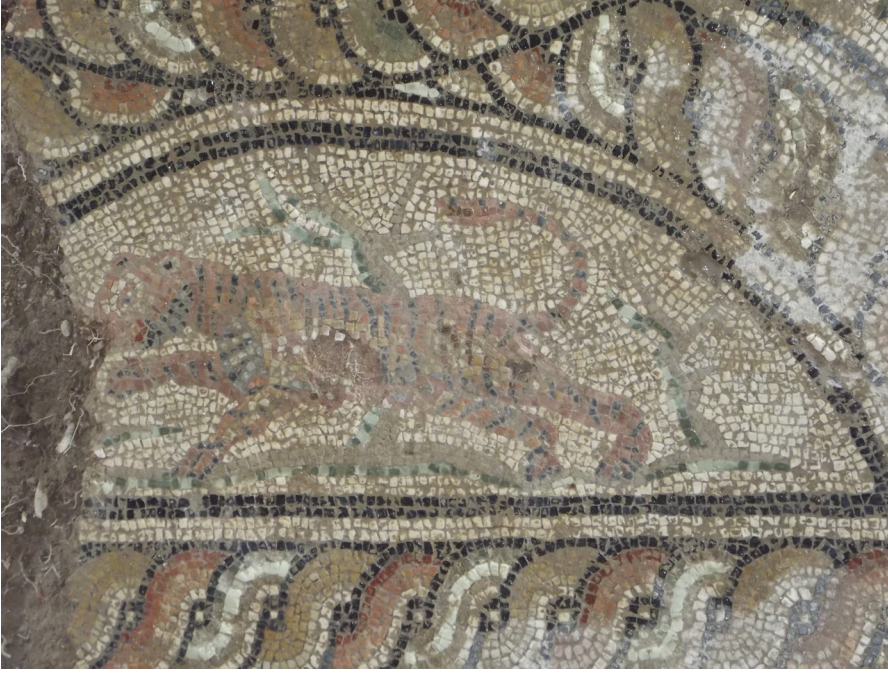
Resim 22 Kaplan, Kış mevsimi, Claudiopolis Mozaïği (Bolu Müzesi Arşivi).

Vücudunda açık pembe, açık kahve ve sarı renkte tesseralar kullanılmıştır. Göz çevresinde ve vücudunda krem rengi ile ışık-gölge etkisi sağlanmıştır. Derisinin üzerindeki çizgiler koyu kahve rengindedir. Zemin çizgisi açık yeşil iken yapraksız bitkilerin konturları koyu yeşil, gövdesi ise açık yeşildir. Zemin krem rengi tesseralarla oluşturulmuştur. Kaplan, hareket biçimi itibariyle aslan figürü ile benzerdir.