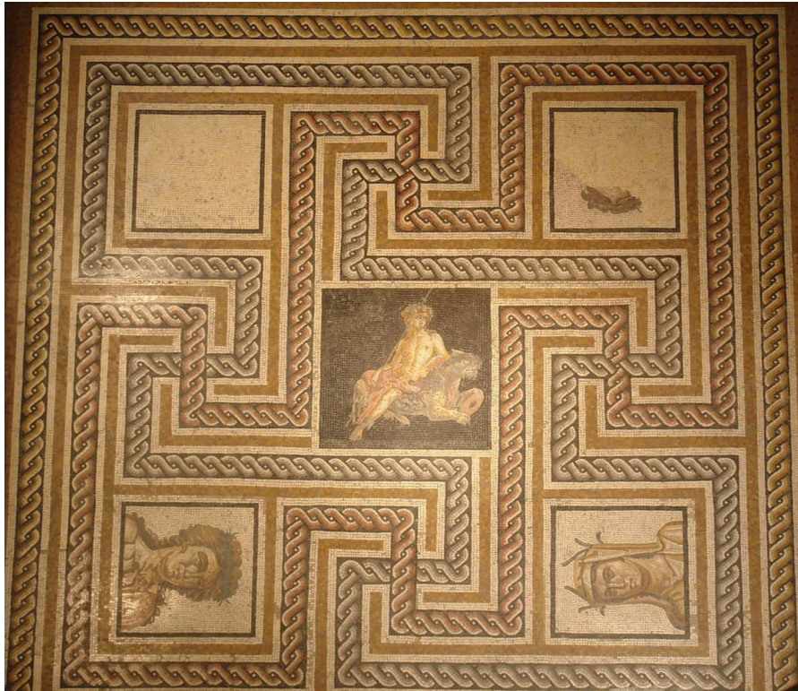
Resim 27 Dionysos ve Mevsimler, Lyon Mozağı