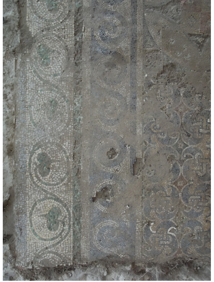
Resim 30-31 Bordür detayı, Claudiolopolis Mozađı.