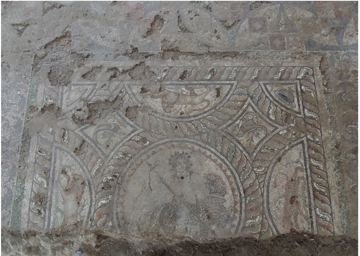
Resim 1 Claudiopolis Dionysos Mozaığı.

Claudiopolis (Bolu), Antik Dönem’de Bithynia Bölgesi sınırları içerisinde yer alan önemli bir kentti (Magie 1950: 307, 546, 590, 596, 614, 622, 1190-1191; Dörner 1952: 32-67; Vermeule 1968: 317-318, 151; Boatwright 2000: 100, 105). 2011 yılında Bolu İli, Merkez İlçesi, Büyükcami Mahallesi, Kentsel Arkeolojik Sit Alanı içerisinde Bolu Müzesi tarafından yapılan kurtarma kazısı çalışmaları sonucunda antik bir yapıya ait doğu-batı ve kuzey-güney doğrultusunda uzanan moloz taştan duvar kalıntıları açığa çıkarılmıştır. Yapı kalıntısında 1 adedi mozaik taban döşemeli 16 adet mekân tespit edilmiştir. Açığa çıkarılan kalıntılar antik yapının plan ve fonksiyonuna ilişkin kesin bir bilgi vermemektedir. Mozaik taban döşemesi 590 cm x 620 cm ölçülerindedir (Res. 1, Çiz. 1). Mozaığın orta bölümüne Bizans Dönemi’nde kuzey-güney doğrultusunda tabanı tuğla, kenarları moloz taşlı bir kanal açılmış bu nedenle mozaığın kanal geçirilen bu bölümü tamamen yok olmuştur. Figürlü pano ve geometrik bordürün yüzeyinde yer yer tessera kayıpları mevcuttur. Mozaığın tüm yüzeyi oldukça kalın bir kireç tabakası ile kaplanmıştır. Dikdörtgen panolar biçiminde kesilen mozaik, plakalar halinde kaldırılarak Bolu Müzesine nakledilmiştir.