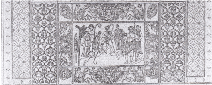
Resim 10 Leopara binmiş Dionysos, Saint-Leu Mozaïği (Dunbabin 1978: pl. 14).

Çocuk Dionysos tasvirlerinde (El Djem 1 (Res. 8), Acholla (Res. 9), El Djem 3 (Res. 16), El Djem 4 (Res.17), Saguntum (Res. 18), Djemila (Res. 19) tamamen çıplak (El Djem 1 (Res. 8), Acholla (Res. 9), Saint-Leu (Res. 10), Saguntum (Res. 18) ya da nebris (El Djem 3 (Res. 16), Djemila (Res. 19)) veya himation (El Djem 4 (Res. 17) giymiştir, başına bitkisel bir çelenk (El Djem 1 (Res. 8), Saint-Leu (Res. 10), El Djem 3 (Res. 16), El Djem 4 (Res. 17), Saguntum (Res. 18), Djemila (Res. 19)) yerleştirilmiştir. Elinde kantharos (El Djem 1 (Res. 8), El Djem 4 (Res. 17) ve thyrsos (Acholla (Res. 9), Saint-Leu (Res. 10), El Djem 3 (Res. 16), Saguntum (Res. 18), Djemila (Res. 19)) taşımaktadır. Bazen tek başına (Acholla (Res. 9), El Djem 3 (Res. 16), Saguntum (Res. 18) bazen de thiasosun üyeleri (El Djem 1 (Res. 8), Saint-Leu (Res. 10), El Djem 4 (Res. 17), Djemila (Res. 19)) ile birlikte. Kedigile her iki bacağını açarak (El Djem 1 (Res. 8), Acholla (Res. 9), Saint-Leu (Res. 10), El Djem 4 (Res. 17), Saguntum (Res. 18), Djemila (Res. 19) binmiş veya yan (El Djem 3 (Res. 16) binmiştir. Bunun yanı sıra yarım yaslanmış durumda (Pella (Res. 5), Leadenhall (Res. 7) oturmuştur.