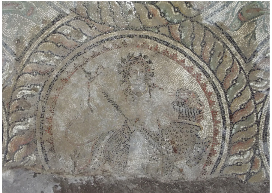
Resim 2 Leopara binmiş Dionysos Madalyonu (Bolu Müzesi Arşivi).

Zemini krem rengindeki tesseralardan oluşan merkezi dairesel panoda bir leopar üzerine yan binmiş olan genç Dionysos tasvir edilmiştir (Res. 2). Tanrı, tek başına betimlenmiştir. Vücudunun üst kısmı cepheden, belden aşağısı ise hafifçe sağına dönük vaziyette tasvir edilmiştir. Başını hafifçe kendi soluna doğru çevirmiştir. Bakışları da soluna doğru yönlendirilmiştir. Uzun ve dalgalı olan saçları, boynunun her iki yanından ikişer bukle olarak omuzlarının