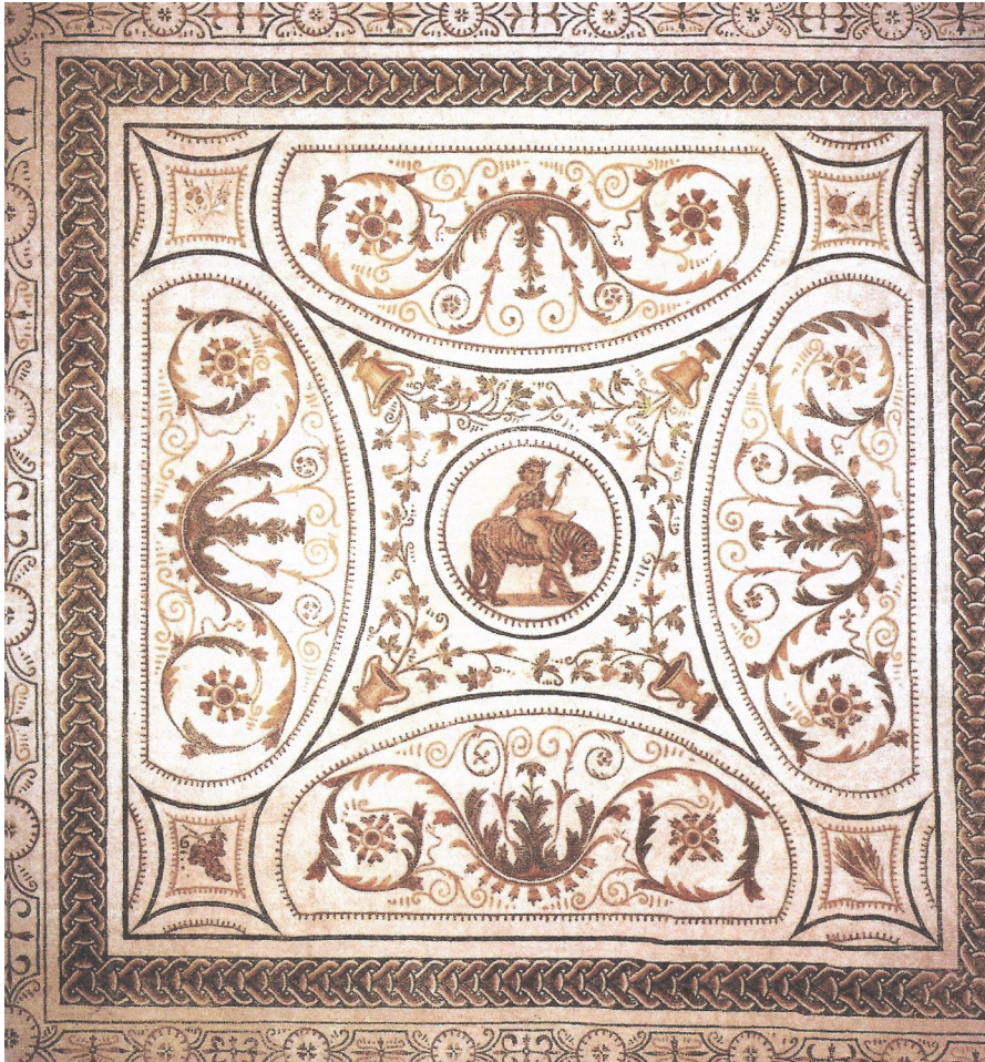
Resim 16 Kaplana binmiş Dionysos, El Djem 3 Mozaïği (Carr-Howard 2017: fig. 6).