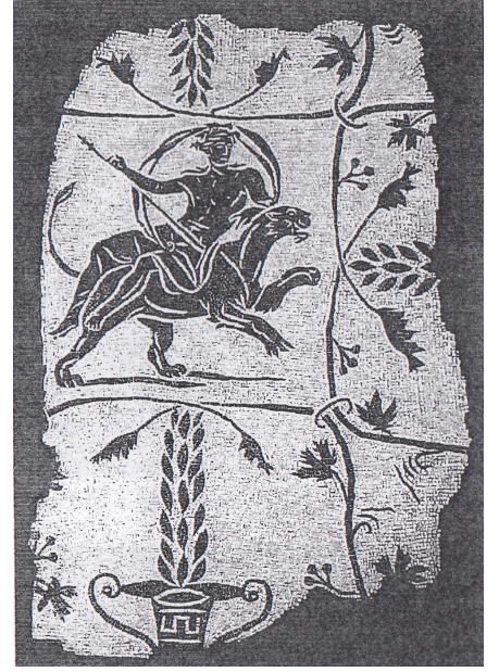
Resim 15 Pantere binmiş Dionysos, Ostia Mozaïği (Wylar 2009: pl. 91,7).