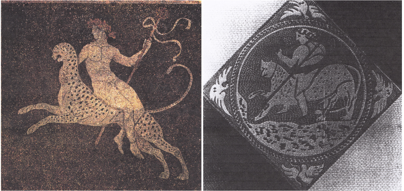
Resim 6 Leopara binmiş Dionysos, Eretria Mozaïği (Welch 1998: fig. 65).

Bu kompozisyon, mozaik sanatçıların repertuarlarında iki farklı tipte yer almıştır.