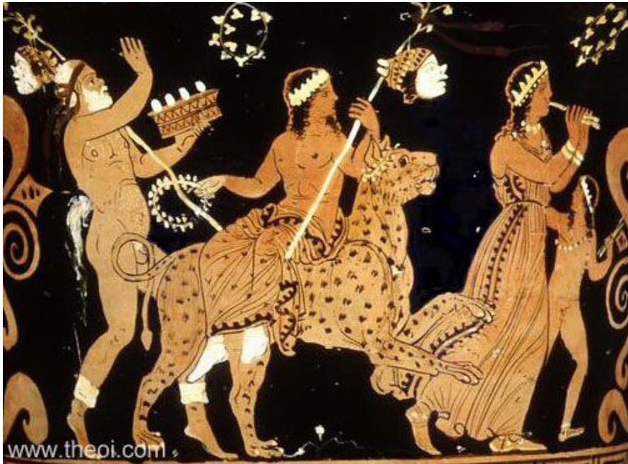
Resim 3 Pantere binmiş Dionysos, Çan Krater

Bir kedigil üzerine binmiş olan Dionysos kompozisyonu, MÖ 4.yüzyıl boyunca Attikalı ve Güney İtalyalı vazo ressamı (Res. 3) tarafından yaygın bir şekilde kullanılmıştır (Gasparri 1986a: 461 nos. 430, 433 pl. 349). MÖ 4. yüzyıldaki örneklerin tümünde Dionysos daima bir leopar üzerine binmiş şekilde tasvir edilmiştir. Bazen bacakları iki yana açık olarak bazen de yan binmiş (Gasparri 1986: 461 nos. 430, 433 pl. 349) olarak gösterilmiştir. Etrafı her zaman thiasosun