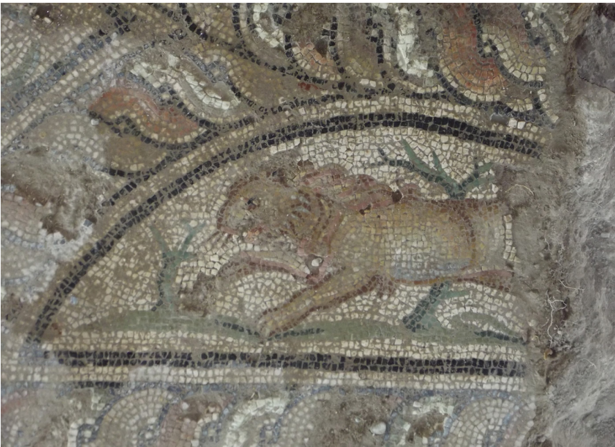
Resim 23 Aslan, Yaz mevsimi, Claudiopolis Mozaïği (Bolu Müzesi Arşivi).

Merkezi dairesel panonun sol tarafında yer alan yarım dairesel panonun içerisine bir aslan (Res. 23) yerleştirilmiştir. Aslanın arka bacaklarından sonrası eksiktir.