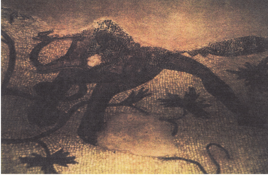
Resim 20 Leopara binmiş Dionysos, Chania Mozaïği (Welch 1998: fig. 74).