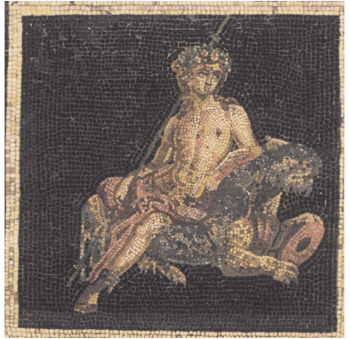
Resim 11 Leopara binmiş Dionysos, Delos Mozaïği (Welch 1998: fig. 69).