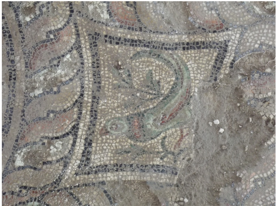
Resim 24 Dağ horozu, Sonbahar mevsimi, Claudiopolis Mozaïği.

Merkezi dairesel panonun sol üst tarafında yer alan içbükey kare pano içerisine bir dağ horozu (Res. 24) yerleştirilmiştir. Dağ horozu, sol profilden işlenmiştir ve ayakta durmaktadır. Yapraklı ve iki dallı bir bitki üzerine konmuş durumda tasvir edilmiştir. Sağ ayağı önde iken sol ayağı geridedir. Hafifçe yukarı doğru kaldırdığı başı ile ileri doğru bakmaktadır. Uzun kuyruğunu önce yukarı doğru kaldırmış sonra kuyruğunun ucunu gövdesinin üzerine gelecek biçimde geriye doğru çevirmiştir. Zemin, krem rengi tesseralarla oluşturulmuştur. Kuşun vücut konturları koyu yeşil, gövdesi ve başı yeşil iken kanadı, boyun kısmı, gözleri,