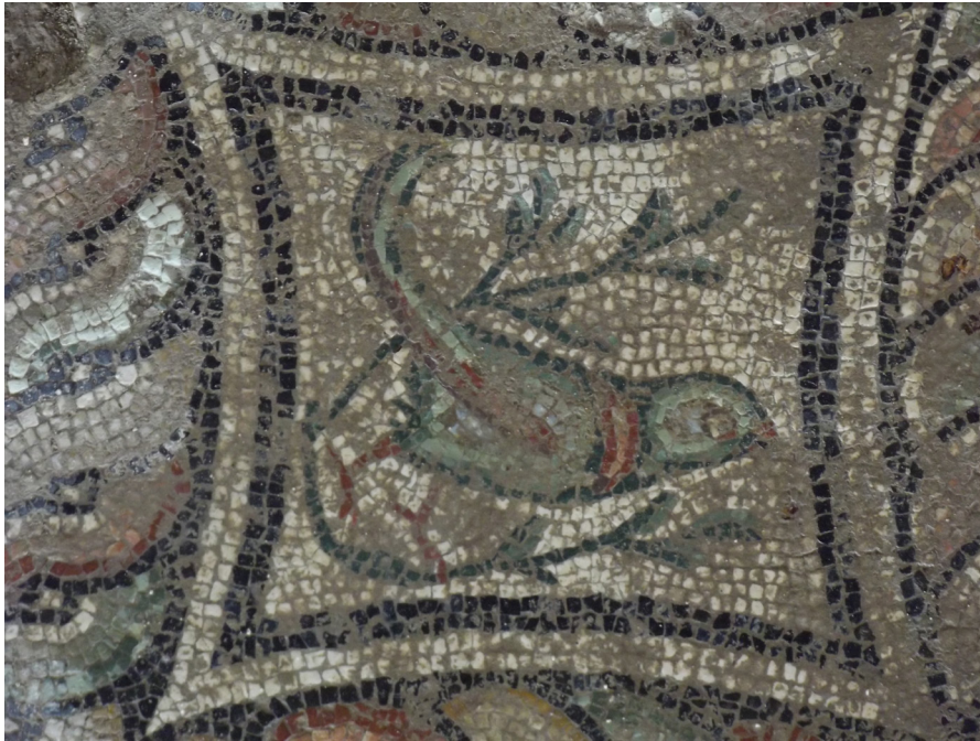
Resim 25 Dağ tavuğu, Kış mevsimi, Claudiopolis Mozaïği.

Dağ tavuğu, kış mevsimini simgelemektedir.