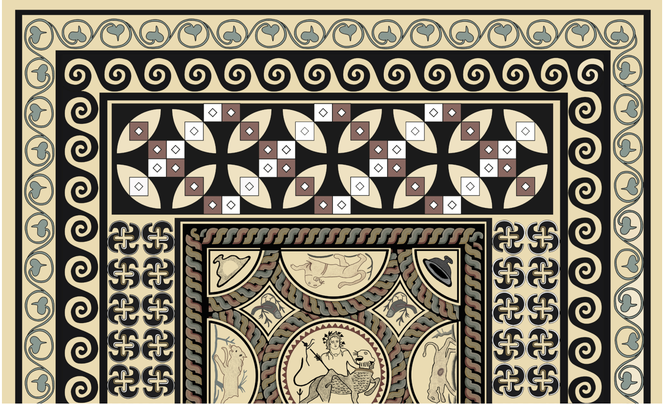
Çizim 1 Claudiopolis Dionysos Mozaiği.