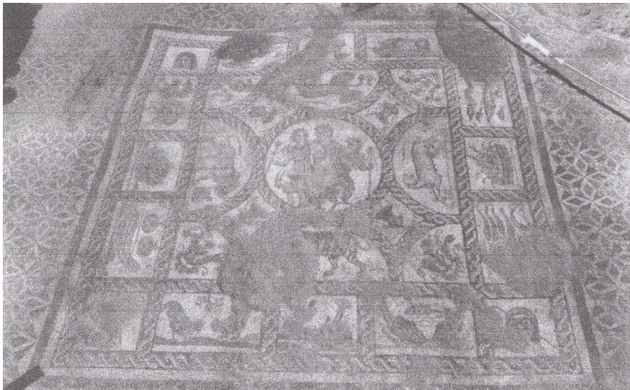
Resim 33 Kemer deseni, Herakleidon Dionysos Mozaïği (Raftopoulou 1998: fig. 12.8).

Herakleidon Dionysos Mozaïği (Res. 33), (MS 2.yüzyılın ortaları), (Raftopoulou 1998: 131 fig. 12.8) merkezi dairesel panonun etrafına yerleştirilen dört adet yarım dairesel pano, dört adet içbükey kare pano ve dört adet çeyrek dairesel