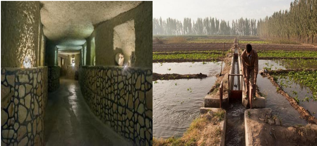
Şekil 2. İki Bin Yıl Önce Yapılmış Turfan Sulama Kanalı (Karız ve Su Şebekeleri)