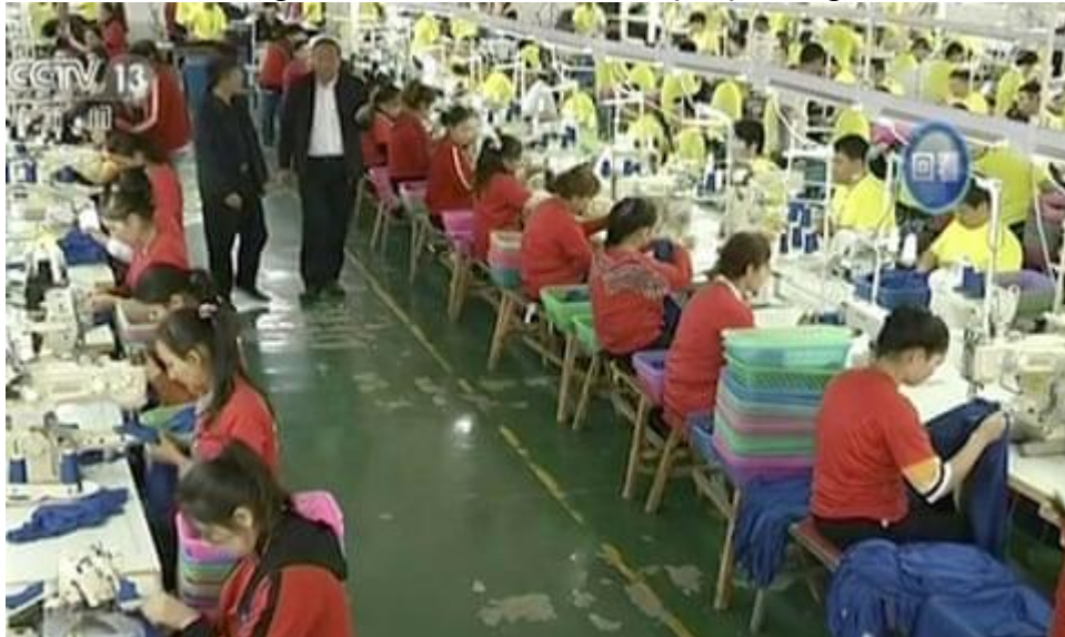
Şekil 5. Hoten Bölgesinde Tekstil Firmasında Çalışan Doğu Türkistanlılar

2019'da Washington'daki araştırmacılar Uygur bölgesinden gelen pamuk elyafının, bölgedeki fabrikalarla doğrudan bağlantısı olmayan Batılı şirketlerin bile tedarik zincirlerine nasıl girebileceği hakkındaki dış bağlantılarını anlatmıştır (SWISSINFO.CH, 2023). Uygur bölgesi sadece Çin için değil bazı sektörlerde dünya tedarik zincirinde kritik rol oynuyor. Bu bölgede üretilen ürünlerin tümüyle yasaklanması Çin'le beraber dünyayı da etkiliyor. Uygurlara yönelik zorla çalıştırma ve köleleştirme eylemleri dünya kamuoyunda tepki göstermeye başlayınca Amerika ve Avrupa'daki demokratik devletler başta olmak üzere birçok devlet Uygur bölgesindeki ve zorla çalışmayla üretilen ürünlerin ülkelerine girmesini yasaklamaya başlamıştır. Ancak Şekil 3'te gösterildiği pamuk ve onunla ilgili tekstil tedarik zincirinde olduğu gibi firmalar uluslararası üretim zincirindeki zayıf halkalardan istifade ederek bu engelleri aşmaya ve Çin'in Uygur bölgesindeki insan hakları ihlallerine ortak olarak ekonomik kazanç elde etmeye devam etmiştir.