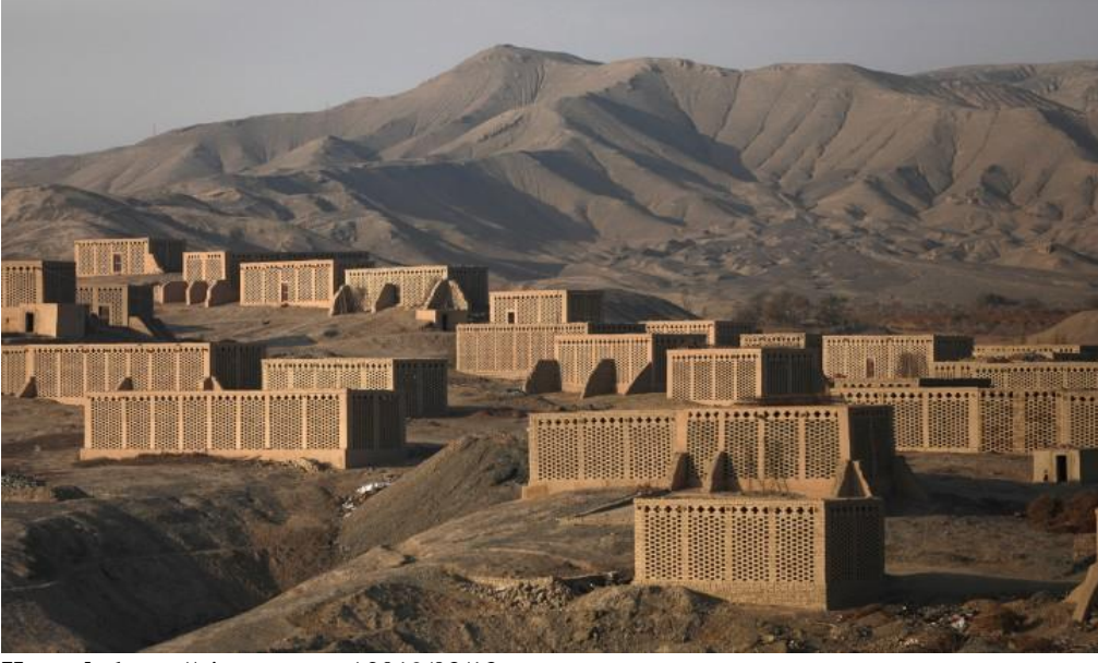
Şekil 3. Turfan Bölgesinde Üzümleri Kurutmak İçin Geliştirilmiş Binlerce Yıllık Geleneğe Sahip Çünçe Evleri