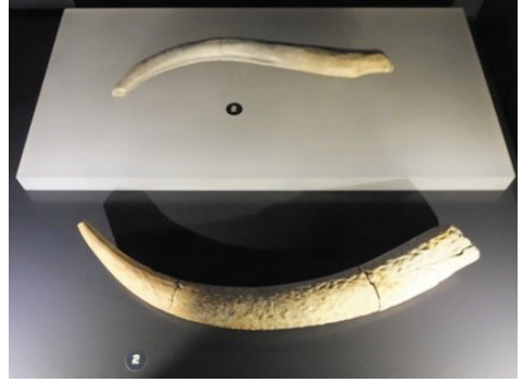
Şekil 7. Geyik boynuzundan oraklar (Diyarbakır Müzesi)

Çayönü (Ergani): Bölgede, arkeolojik kazılarda, geyik boynuzundan yapılmış orak (Şekil 7) ve aletler yanında av hayvanı olarak geyiklerin önemli yer tuttuğu anlaşılmıştır (Özdoğan, 2012).