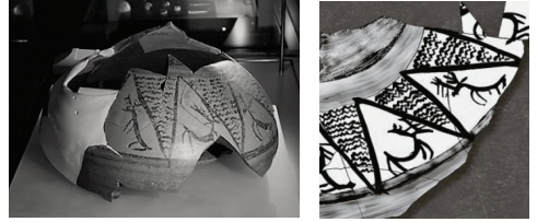
Şekil 8. Dans eden geyik kabı (solda) ve kap üstündeki geyikleri gösteren çizim (sağda) (Laneri vd., 2015’den)

Hurbemerdon Tepe (Bismil): Geçmişte bölgenin, geyiklerin yaşayabileceği ormanlarla kaplı olduğunu anlaşılmıştır (Laneri, 2013). Ayrıca bir geyiği farklı biçimlerde betimleyen bir kabın (Şekil 8) dinsel ritüellerde kullanılmış olduğuna kanıt olarak gösterilmektedir (Laneri, vd., 2015).