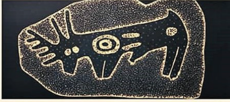
Şekil 6. Körtik Tepe’de bulunan geyik figürü ve çizimi (Diyarbakır Müzesi)

mevcut olduğu görülürken, gergedan ve antiloplara ait bir bulguya, aşağıda verilen kaynaklarda rastlayamadık. Diyarbakır il sınırları içerisinde yapılan arkeolojik alan kazılarında, geyik ile ilgili elde edilmiş başlıca bulgular aşağıda kısaca ele alınmıştır.