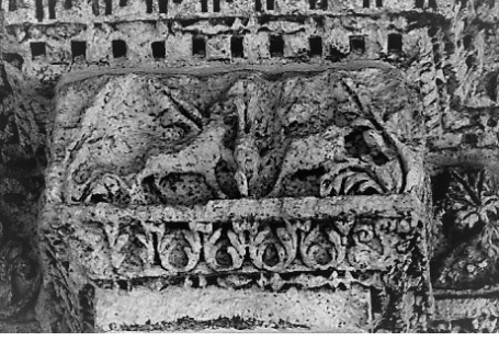
Şekil 3. Ulu Cami'nin batı cephesinde bulunan 3. sütündeki hayvan figürleri

Melikşah/Nur ve Selçuklu Burçları: Bu burçlarda farklı hayvanlara ait çok sayıda gerçekçi ve sembolize figür bulunmaktadır. Diyarbakır surlarının güneybatısında bulunan Selçuklu ve Melikşah/Nur burçlarında, karşılıklı duran, birbirlerine benzer iki çift hayvan figürünün tanımlanmasında görüş birliği yoktur. Farklı yazarlar bunları dağ keçisi, antilop, at, koyun, ceylan veya geyik olarak tanımlamıştır, fakat ağırlıklı fikir, dağ keçisi oldukları yönündedir (Tablo 1). Bu burçlardaki hayvanlar, Tek Beden ve Ulu Cami'deki geyik figürlerine benzemedikleri iddia edilebilir.