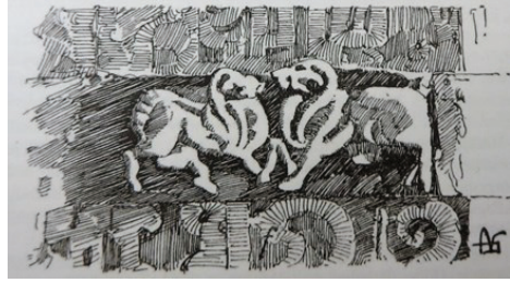
Şekil 4. Melikşah/Nur Burcundaki hayvan figürleri (Gabriel, 2014'dan)

Gabriel (2014), Melikşah Burcu'ndaki bu figürleri at veya koyun, Selçuklu Burcu'ndakileri ise geyik olarak tanımlamıştır. Parla (2014) ise, bu figürleri "ceylan/geyik" şeklinde tanımlamış, daha büyük olasılıkla geyik olduğu fikriyle birlikte bir efsaneyle ilişkilendirmiştir. Baş (2006), iki burçtaki figürlere "geyik (antilop)" başlığı altında yer vermiştir. Oysa "antilop" adıyla anılan hayvanların bölgede yaşamış olduklarına ilişkin arkeolojik ya da güncel herhangi bir kanıt rastlanmamaktadır. Melikşah/Nur Burcu'ndaki figürler daha çok dağ koyununa (Şekil 4), Selçuklu Burcu'ndakilerin ise, dağ keçilerine benzediklerini düşünmekteyiz. (Şekil 5).