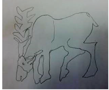
Şekil 2. Şekil 1'deki figürün çizimi

Diyarbakır surlarındaki hayvan figürleri üzerine yapılmış en detaylı çalışma, Baş'ın (2006) "Diyarbakır'daki İslam Dönemi Mimarisinde Süsleme" adlı doktora tezidir. Bu çalışmada, "Diyarbakır'da gergedan figürünün tek yerde, Diyarbakır Kalesi'nde Dağkapı'dan Urfa Kapısı'na doğru devam eden surların bugünkü ilk burcu üzerindeki küfi kitabenin başlangıcında" bulunduğu belirtilmektedir. Bu tezin yazarı, söz konusu figürü "geyik" olarak tanımlayan Günkut'u, (1937) tezinde kaynak olarak kullanmıştır.