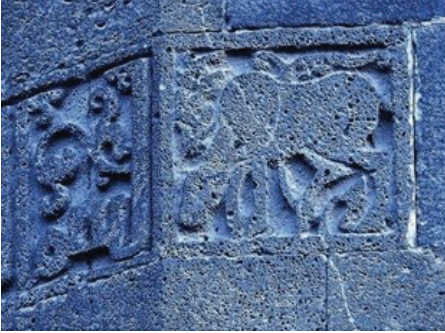
Şekil 1. Tek Beden'deki küfi kitabenin başında yer alan geyik figürü

Tek Beden : Tek Beden, bazı kaynaklarda 3., 4. veya 5. burç olarak geçmektedir (Tuncer, 2012; Parla, 2014). Bu burçta, bulunan küfi bir kitabenin başında, bir hayvan figürü bulunmaktadır. Bu figür ile ilgili farklı yazarlar farklı görüşler dile getirmiştir. Günkut (1937) tarafından bu figüre geyik denilmiştir. (Şekil 1), daha sonra başka yazar ve araştırmacılar tarafından bu figür ya hiç görülmemiş ya da farklı şekilde tanımlanmıştır. Amida adlı kitapta bu figür kedigil veya aslan olarak tanımlanmıştır (Berchem vd., 2015). Bu kitabın yazarlarından olan Strzygowski, Fransız General De Baylie tarafından çekilen resimleri yorumlayarak bu sonuca varmıştır.