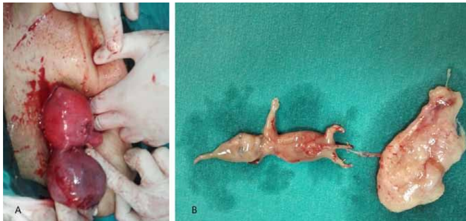
Şekil 2. Bikornuat uterus. A. Operasyon sırasında her iki uterus izlenmekte. B. Müdahale sonrası alınan 9 hafta 3 günlük fetus ve ekleri.