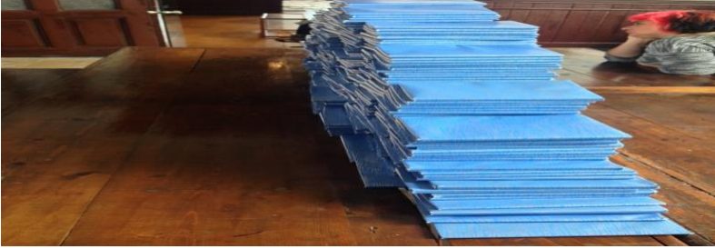
Şekil 5: “Önceki Günün Adası” adlı esere ait detay görseli.

okulun binası da bu eserler için anlamlı bir zemin sunmuş ve eserin etkisini derinleştirmiştir. Büyüktaşçıyan'ın projesi, mavi tonlarıyla bir ada formuna bürünerek, artık var olmayan öğrenciler ve kaybolmuş toplumu anma ve varlıklarını sürdürülebilir alanı yaratmıştır. Bu eser, mekanla kurduğu derin ilişki aracılığıyla kaybolmuş bir toplumu yeniden canlandırırken, mekanın atmosferini yaratıcı bir şekilde kullanmış ve böylece izleyiciye geçmişin hatıralarını etkileyici bir şekilde sunmuştur. Büyüktaşçıyan'ın “Önceki Günün Adası” yerleştirmesi, hem Galata Özel Rum İlköğretim Okulu'nun tarihsel bağlamıyla güçlü bir etkileşim içinde bulunarak mekanın hafızasını tazelemiştir, hem de kaybolmuş toplumu anma biçimiyle izleyicilere derin bir duygusal deneyim sunmuştur. Bu eser, mekanın tarihsel ve kültürel kimliğini sanat yoluyla yeniden canlandırarak, geçmiş ile günümüz arasında anlamlı bir köprü kurmayı başarmıştır.