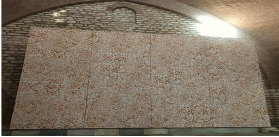
Şekil 6: Monica Bonvicini'n Küçük Mustafa Paşa Hamamı'nda sergilenen "Weave This Way" eseri, 2017.