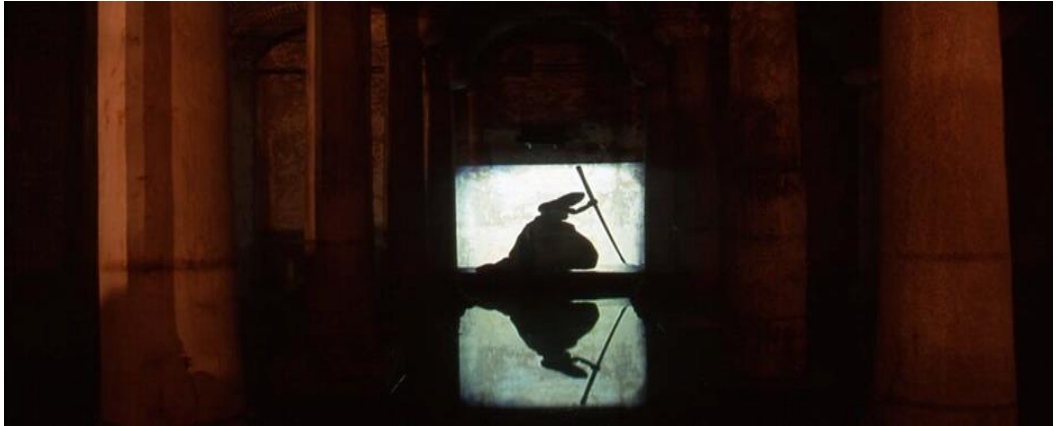
Şekil 2: William Kentridge'in "Gölge Kafilesi" adlı 35mm filmi gösterimi, Yerebatan Sarnıcı, 1999.

Kaynak: https://argonotlar.com/fotografarla-17-yilda-istanbul-bienali/