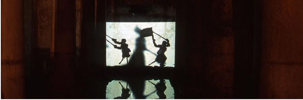
Şekil 3: William Kentridge'in "Gölge Kafilesi" adlı 35mm filmi gösterimi, Yerebatan Sarnıcı, 1999.

tarihi Yerebatan Sarnıcı ile derin bir etkileşim kurarak mekan ve sanat eseri arasındaki bağı güçlü bir şekilde ortaya koymuştur. Film, sarnıcın mimari unsurları ve atmosferinden yararlanarak, mekanın doğal gölgeleriyle birleşmiş ve böylece izleyicilere unutulmaz bir deneyim sunmuştur. Bu etkileşim, sarnıcın özgün özelliklerini ön plana çıkaran ve yeni bir görsel deneyim oluşturan bir sentez yaratmıştır. Sonuç olarak, Kentridge'in eseri, mekanın tarihi ve estetik derinliğini sanatsal bir şekilde yeniden yorumlayarak, izleyicilere mekanın ve sanatın birleşiminden doğan özgün bir deneyim sunmuş, bu da bienalin etkileyici ve hafızalarda kalan bir sergi olmasını sağlamıştır (Baydar, 2018).