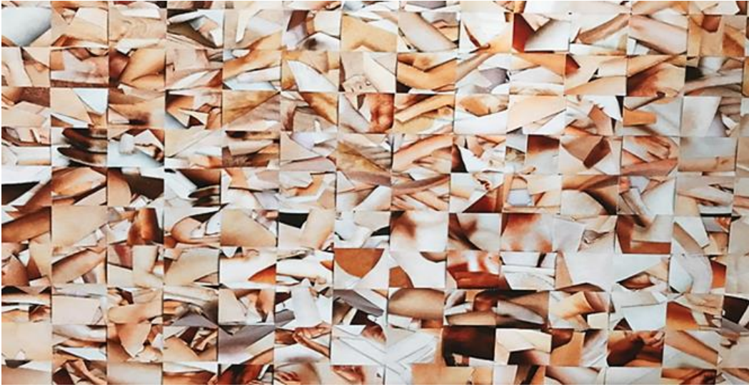
Şekil 7: "Weave This Way" adlı esere ait detay görseli.