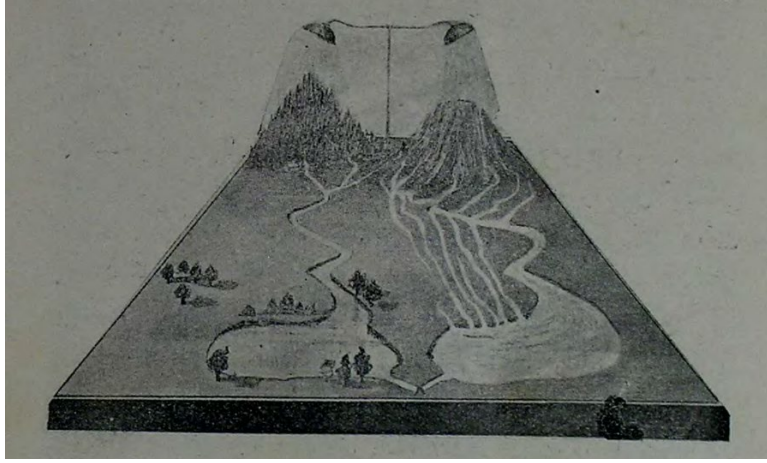
Resim 5. Ormanların faydasını anlatmak için kullanılan fenni oyuncak

Makalelerde Osmanlı Devleti'nde eğitim öğretim faaliyetlerinde bulunan yabancı mektepler hakkında da bilgi verilmiştir. Muallim dergisinde “Türkiye’de Rum Mektepleri I ve II” başlıkları ile yayımlanan makalelerde, enva’ ve teşkilatlanma bakımından Yunan mektepleri ile aynı olan Osmanlı Devleti’ndeki Rum mekteplerinin yalnızca sıbyanlar için olanının Fransızlardan örnek alınarak teşekkül ettirildiğinden söz edilmiştir. Sıbyan mekteplerinin 3-7 yaş arası kız ve erkek çocuklara eğitim verdiği, çocukların biraz okuma yazma ve çoğunlukla oyun, şarkı söyleme/öğrenme, el işi yapma ile vakit geçirdikleri anlatılmıştır. Sıbyan mektepleri dışında İstanbul, Edirne, Selanik, İzmir’de rüştiyelerin, darülmuallimlerin de bulunduğu bahsedilen makalede; İstanbul’daki Zapyon adlı mektebin mükemmeliyeti ele alınmış, bu mektepte ve kimi idadilerde pedagoji derslerinin verildiği açıklanmıştır. İstanbul’daki Zoğrafyon adındaki mektep hakkında da bilgi içeren makalede, bu mektepte Latince yerine Fransızca, riyaziyat ve usul okutulduğu ifade edilmiştir. İsteyenlere de geceleri Almance ve İngilizce ticaret derslerinin gösterildiği bildirilmiştir. Heybeliada’da açılan Rum ticaret mektebi ile ilgili açıklamaların da yapıldığı makalede, bu mekteplerde idadi bir şubenin olduğu, pedagojik bilgi içeren derslerin de verilebildiği aktarılmıştır (Muallim, 15 Kanun-i evvel 1332, 168-169).