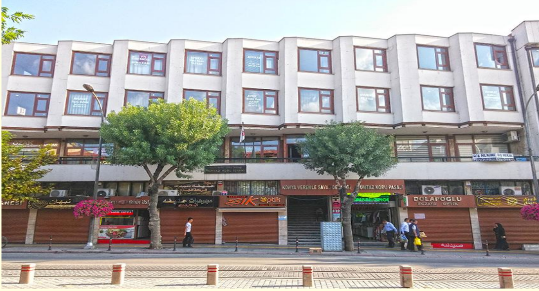
Şekil 13. Dernek binası, 1. kat, flamanın olduğu daire (2024). (Konya Veremle Savaş Derneği'nin resmi web sayfasından alınmıştır.)