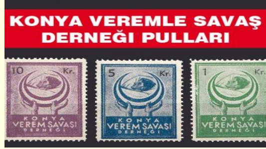
Şekil 9. Dernek pulları. (Konya Veremle Savaş Derneği'nin resmi web sayfasından alınmıştır.)