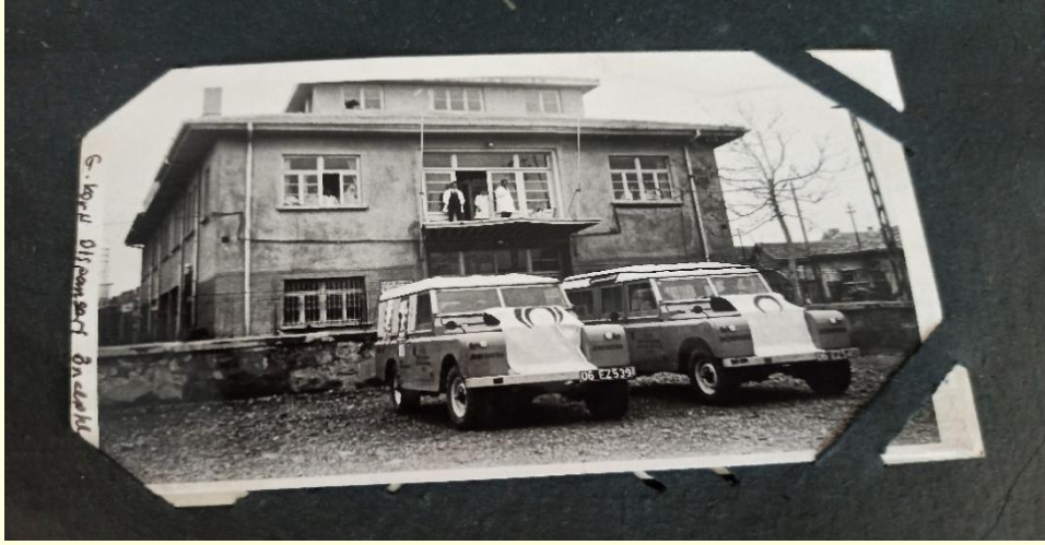
Şekil 8. Güzide Kuru Dispanseri (1955) binası. (Konya Veremle Savaş Derneği binasındaki fotoğraf albümünden alınmıştır.)

Önder (1954) dispanserler ( Şekil 7-8 ) hakkında halkın görüşlerini şöyle aktarır: