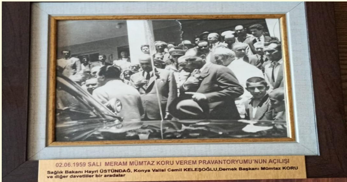
Şekil 11. Prevantoryum açılış töreni (1959).

Dernek, 1951 yılında geçici olarak Mümtaz Kuru Dispanseri'nde ve tamamlandıktan sonra prevantoryumun ilk yıllarında, yataklı tedavi hizmeti de vermiştir. Bu birimlerde, 1959 yılında laboratuvarları, röntgen ve radyoskopi alt yapısı, pnömo ve elektravital kapasite gibi dönemin en gelişmiş cihazları bulunmaktaydı. 4 Verem Hastanesi'nin 1962 tarihinde yapılması ile yataklı tedavi hizmetleri Sağlık Bakanlığı'na bağlı hastanede sürdürülmüştür. Verem Hastanesi'nin kurulması ile boşaltılan prevantoryum, resmi kurumlara kiralanmış ve elde edilen gelir verem hastaları için kullanılmıştır. 40