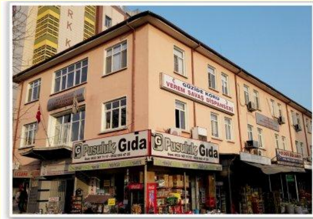
Şekil 15. Güzide Kuru Dispanseri binası (2024). (Konya Veremle Savaş Derneği'nin resmi web sayfasından alınmıştır.)