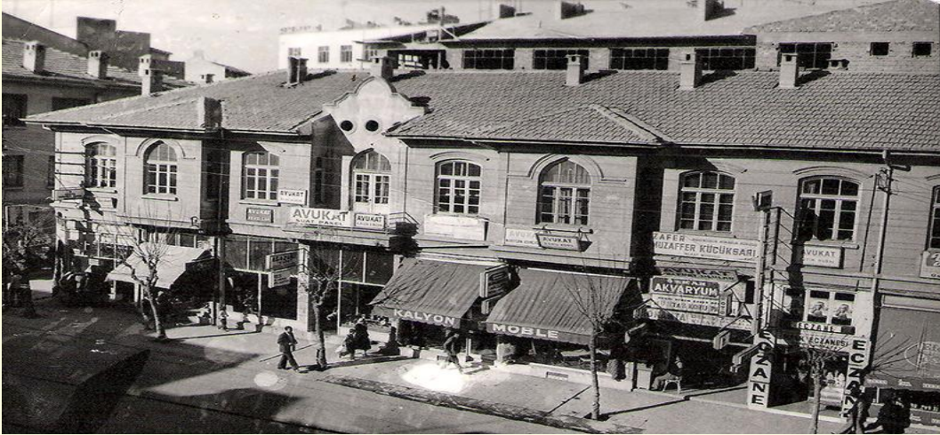
Şekil 3. Derneğin ilk binası. (Konya Veremle Savaş Derneği binasındaki fotoğraf albümünden alınmıştır.)