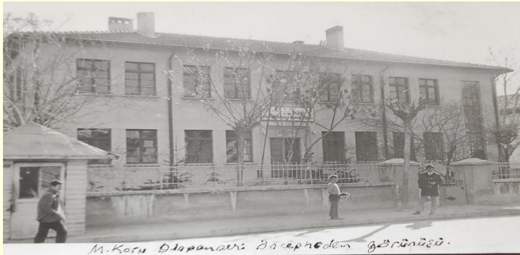
Şekil 7. Mümtaz Kuru Dispanseri (1949) binası.

Dönemin sınırlı yayınları kapsamında tüberkülozun toplumdaki yaygınlığı ve sosyal şartlar göz önüne alındığında mücadele yöntemlerinde toplumun bilinçlendirilmesi ve ekonomik destek sağlanması oldukça önemlidir. Bu koşullarda Kuru'nun faaliyetleri Konya'da halk arasında takdir görmüştür.