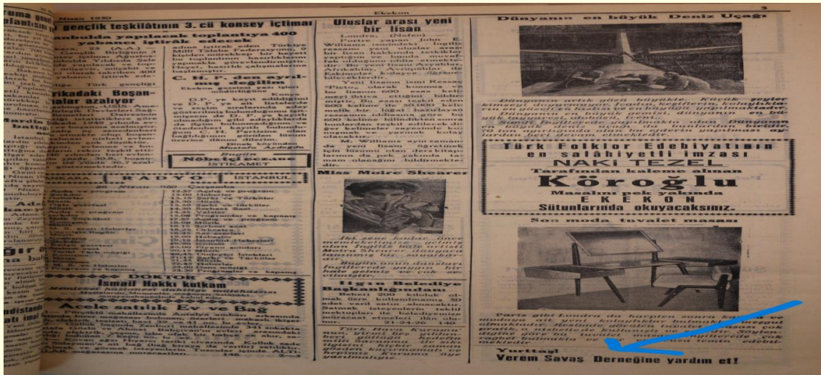
Şekil 10. 1950 yılına ait Ekekon isimli yerel gazetede destek çağrısı.

"...Bütün bunlara rağmen giriştiğimiz bu hayırlı ve nurlu yolda tam başarı elde etmek, hastalara deva ve şifa sağlamak ve sağları bu kötü salgın ve bulaşıcı hastalıktan korumak için eksikliklerimiz ile ihtiyaçlarımız, herhalde mevcudumuzdan çok fazladır. Aziz ve hamiyetli hemşehrilerimizin ve sayın hükümetimiz ve büyüklerimizin yardımıyla ve bıkmadan, usanmadan devamlı çalışmakla bunların kısa bir zamanda tamamlanacağına inancımız vardır." diyerek destek çağrısı yapmaktadır. O dönemde dernek, yerel basınla ( Şekil 10 ) halka ulaşmaya çalışmaktaydı. 25