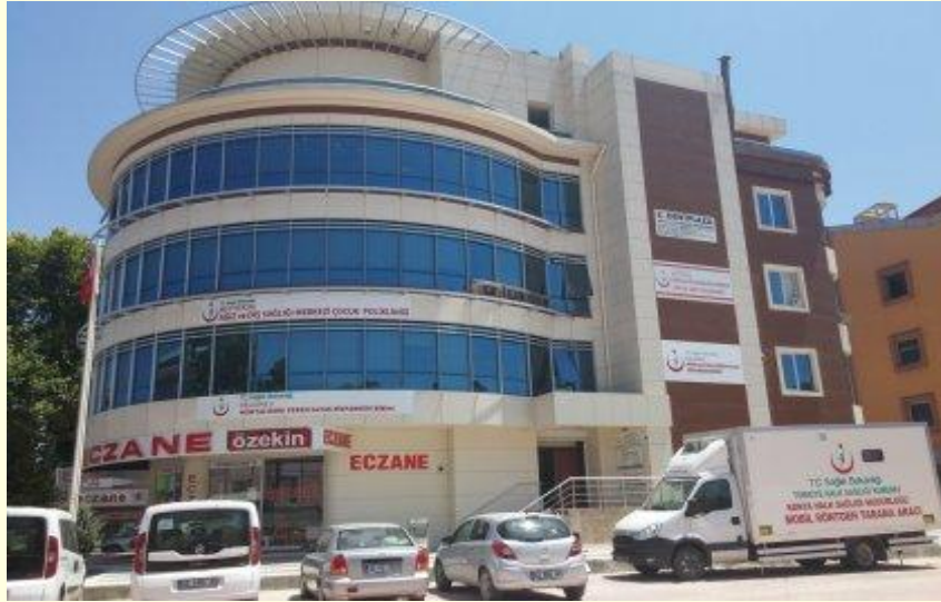
Şekil 14. Mümtaz Kuru Dispanseri binası (2024).