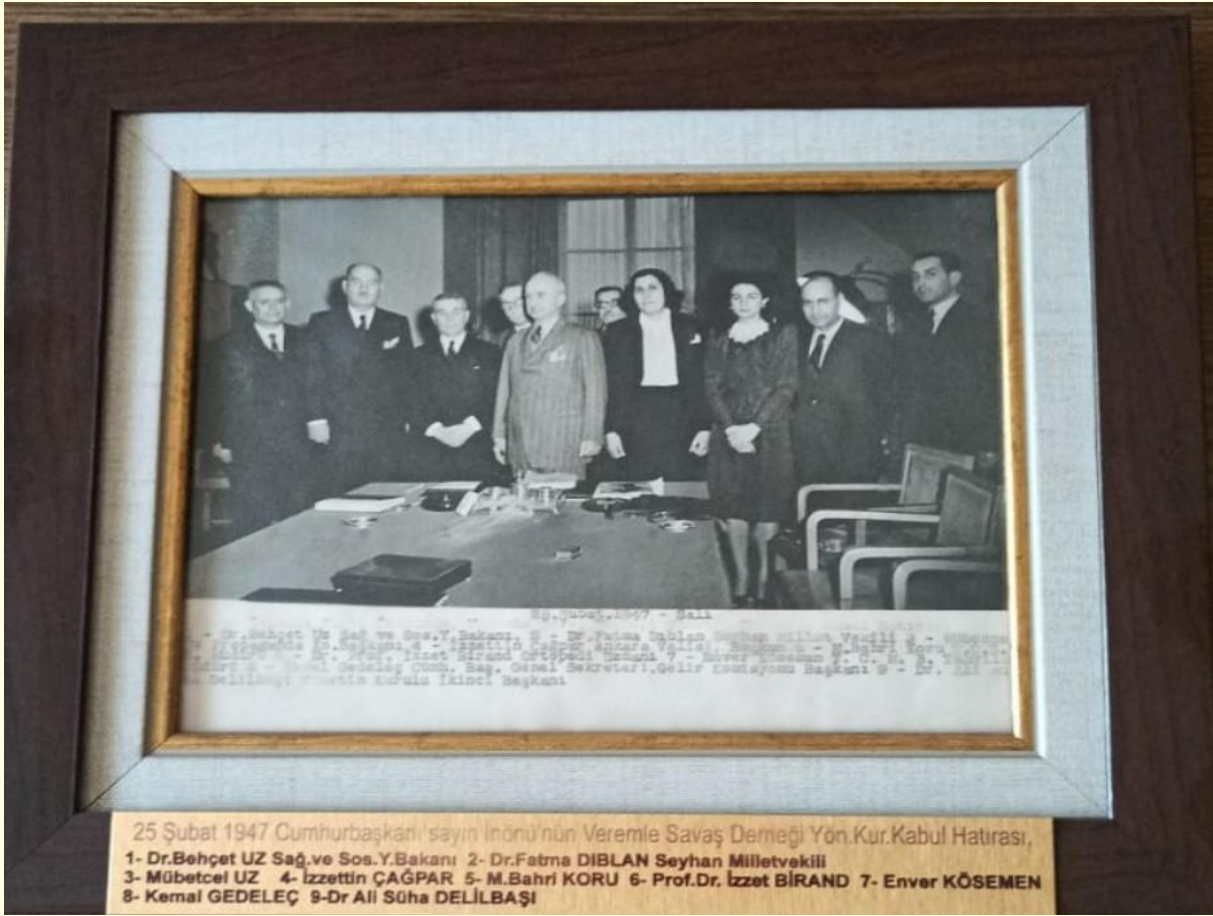
Şekil 4. Derneğin kuruluş aşamasında İsmet İnönü yönetim kurulunu kabul hatırası. (Konya Veremle Savaş Derneği binasındaki fotoğraf albümünden alınmıştır.)

Derneği adı altında birleşme kararı alınmıştır. 4 Konya Veremle Savaş Derneği ivedilikle bu oluşumda yer alarak 1949 yılında kamu yararına çalışan dernek statüsü kazanmıştır (Ek 1. Resmi Gazete).