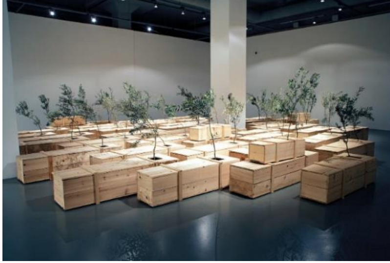
Resim 8. Yoko Ono, Ex It, 1997-2007