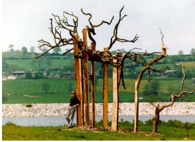
Resim 10. Lynne Hull, Rezervuar Ağacı, Derbyshire, İngiltere, 1994

“Rezervuar Ağacı”, (Resim 10) sanatçının ekolojik açıdan en iyi şekilde sergilediği çevresel sanat çalışmalarından biridir. Tüm nesne, garip gerçekçi veya neredeyse gerçeküstü bir fantezi ağacının birkaç gövdesi gibi toprağa dikey olarak çakılmış bir grup ahşap direklerle yapılmıştır. Tüm materyaller doğal duyuya saygılı bir şekilde dikkatlice düzenlenmiş, derin sanatsal öneriye sahiptir. Sanatçının ilk hedefi yaratıcılığı gerçek sorunlara uygulamak ve işini acil sosyal ve çevresel sorunlar üzerinde bir tür etkiyle uyumlu hale getirmektir. Sanatçının bu çalışması, sanatının ötesindeki düşüncesini göstermek için kullandığı bir başka yumuşak kontrastıdır. Hull’un ağacı ile çevredeki yaşam alanının geri kalanı arasındaki uyum, heykelin üzerinde duran gerçek kuşların hikâyelerine ve görüntülerine atıfta bulunan ziyaretçiler ve kuş gözlemcileri tarafından açıkça algılanmaktadır. Bu, sanatçının amacına ve “türler arası” sanatın tam konusuna ulaşmak için önemli bir başarıdır (Dilluns, 2022).