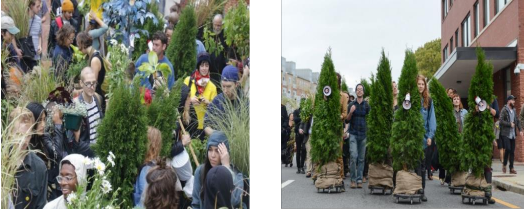
Resim 9. Monge Lima, Kamusal Taşınabilir Fidan Performansı, 2011

Monge'in çalışması, şehir yaşamının içinde kaybolmuş olan doğayı yeniden canlandırmayı ve kentsel yeşil alanların korunmasına yönelik toplumsal bir tartışma başlatmayı amaçlar (Zeybek, 2024). Taşınabilir Fidan projesinde, kentsel alanlardaki açık ve yeşil alanların korunması ve genişletilmesine odaklanılmıştır. Bu proje, çevresel sorunların, özellikle de su kıtlığı ve hava kalitesinin düşüklüğü gibi konuların aciliyetine dikkat çekmektedir. Monge, kentlerin aşırı yapılaşması sonucu doğal alanların kaybının, insan sağlığına olan etkilerini vurgulayarak, bu durumun şehir yaşamında yarattığı kopuklukları ele almaktadır. Monge'in manifestosu, kentlerdeki ekosistem sorunlarına değinerek, açık ve yeşil alanların korunmasının gerekliliğini ortaya koymuştur. Çalışma, doğanın kentsel yaşam ile olan ilişkisini yeniden tanımlama çabasıdır. Geçirimsiz yüzeylerin artması, suyun doğal döngüsünü bozmakta ve hava kalitesini olumsuz etkilemektedir. Bu bağlamda Monge'in sanat pratiği doğanın yeniden entegrasyonunu sağlamak için bir çağrı niteliği taşır. Taşınabilir Fidan, izleyicileri doğayla etkileşime geçmeye teşvik ederek toplumsal katılımı ön planda tutmaktadır (Monge, 2024).