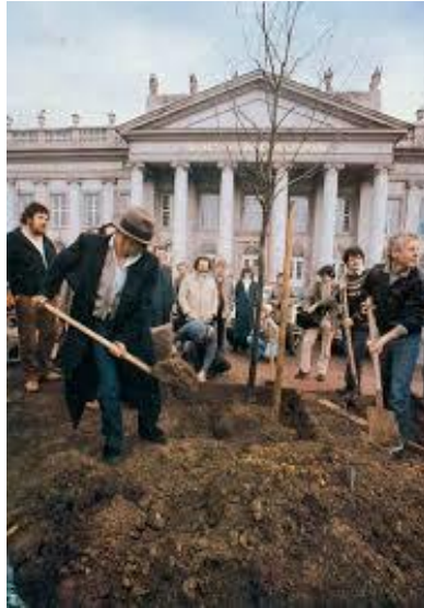
Resim 1. Joseph Beuys. Dokümente 7 Sergisi, 1982

Beuys 1982 yılında Dokümente 7 sergisinin bir parçası olarak Kassel’de başlatılan kent yeşillendirme projesi olan 7000 Meşe Ağacı dikme projesini gerçekleştirmiştir (Hopkinns, 2018). 7000 Meşe dikim projesi doğaya karşı gelişmesini sembolize eden bir eylem olarak sosyal heykelin bir parçası haline gelmiştir. Beuys, çukur kazarak katılımlı sanat anlayışı ile ağaç dikmektedir (Resim 1). Ağaç dikmek, Beuys’un oyuncusunun rolünü genişleten toplumsal paylaşım olarak tanımlanabilir. Sosyal heykel oluşumunda her birey, toplumun “biçimlendirici” bir ögesi olarak görülmektedir. Bu süreç, toplumsal ortak eylemler ve hedeflerin etrafında birleşmesini ve şekillenmeyi temsil etme rolüne sahiptir. Beuys projeleri, çevresel dengeyi bozan sanayileşmenin ve kirliliğin yarattığı olumsuzluklar, onun sanat anlayışında insan sağlığıyla doğanın derin bağlantısını ortaya koymaktadır. Temiz bir doğa, temiz bir toplum görüşü, sanatı dönüştürücü bir güç olarak kullanma amacını yansıtırken, projenin Kassel’den başlayarak küresel bir etki yaratma arzusu, sanatın evrenselliğini ve kolektif bir bilinç oluşturma potansiyelini vurgulamaktadır. Beuys, böylece sanat aracılığıyla toplumsal değişim için bir çağrı yaparak izleyiciyi bu sürecin bir parçası olmaya yöneltmektedir (Şahin & Arat, 2022).