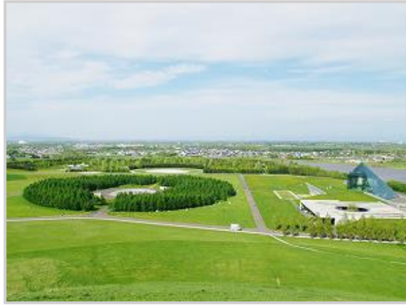
Resim 6. Noguchi, Moerenuma Park, Sapporo, Japonya, 2005

Isamu Noguchi'nin bütünün tek bir heykel olduğu konseptinden yola çıkarak temel tasarımını oluşturduğu "Moerenuma Park" Japonya'nın Sapporo şehrinde yer almaktadır. Yapımına 1982 yılında başlanmış ve parkın açılışı 2005 yılında gerçekleşmiştir. Moerenuma Park, sıradanlıktan uzak, sevgiyle tasarlanmış ve cömertçe hayata geçirilmiş kamusal alan olarak dikkat çekmektedir. Moerenuma Park'ın tasarım özellikleri, Noguchi'nin sosyal-psikolojik ve kültürel mirası mükemmel bir şekilde anladığını göstermektedir (Resim 6). Park sanatçının tasarımları doğrultusunda heykel projeleri, ağaç dikimi ile özel bir alana çekilmiştir. Moerenuma'daki pek çok nesne, ziyaretçiler tarafından çoklu kullanım için akıllıca tasarlanmıştır (Konečni, 2016).