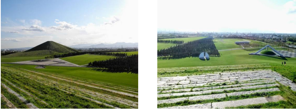
Resim 7. Isamu Noguchi, Moerenuma Park, Sappora, Japonya, 2005

Moerenuma Park, ekolojik sanat projelerinden farklıdır, kullanıcı dostu tasarım anlayışı ve çok işlevli kullanım alanları ile ayrılmıştır. Noguchi'nin sosyal, psikolojik ve kültürel oluşumları derin bir anlayışla yorumladığı heykel projeleri ve ağaç dikimlerini sanatla bütünleştirmesi, diğer ekolojik sanat projelerinden farklı olarak değerlendirilmektedir.