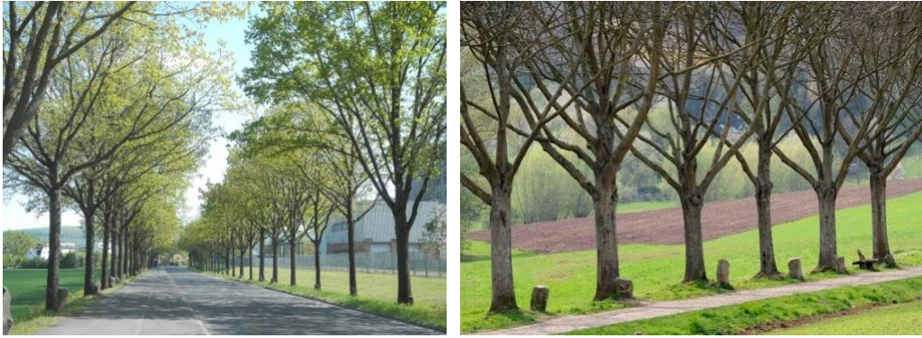
Resim 2. Joseph Beuys, 7000 Meşe, 1982, Dennhäuser Straße, Kassel, Almanya

zamanda da doğaya verilen zararlarda büyük payı olan Almanya'yı sanat yoluyla eleştirdiği bir çalışma olarak değerlendirmemize olanak tanır (Atakan, 2015). Meşe ağacı yayılan saçaklı kökleri ve göğe doğru yükselen dallarıyla yaşamlarının parçaları, değişim ve görüneni simgeleyen bir köprüdür. Kelt kültüründe meşe ağacı Druidlerle bağlı olarak özel kutsal ağaç gibi kabul edilmiştir. Bir varsayıma göre "Druid" kelimesinin kendisi "dru" kökünden olup, "meşe ağacını" bildirmektedir. Druidler meşe ağacı olan yerleri asıl tapınak ve dinî bir merkez haline getirmişler, meşe ağacı dallarını ise çeşitli ayin törenlerinde kullanmışlardır. Meşe ağacına onun sağlığı ve uzun ömürlü olmasından dolayı saygı göstermişlerdir. Aynı zamanda, Kelt bilginlerine verilen "Druid" sözcüğü de "Meşe bilgisi" anlamına gelmektedir (Gasımova, 2023). (Resim 2).