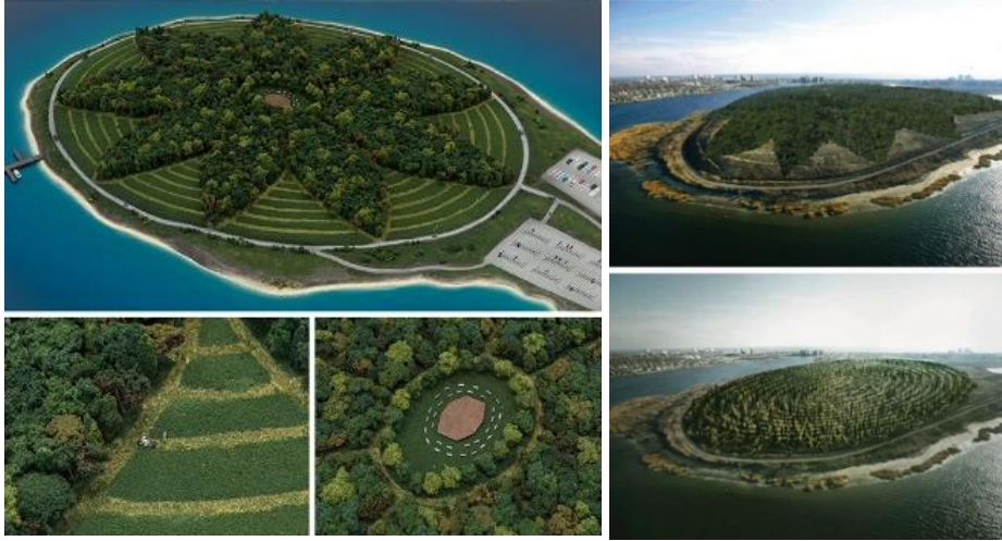
Resim 5. Agnes Denes, New York İçin Bir Orman, Zihin ve Ruh İçin Bir Barış Parkı, 2014

Agnes Denes'in ekolojik sanat içerisinde sosyal heykel kavramını karşılayan diğer projesi ise 2013 yılında New York'ta gerçekleştirdiği "New York İçin Bir Orman" projesidir (Resim 5). Yarımadanın ağaçlandırılması sonunda bir kıyı ekosistemi haline gelmiştir. İnsanları ağaç dikmeye, ormanı korumaya, okulların iş birliği ile diğer katılımcıları yönlendirmiştir (Denes, 2001).