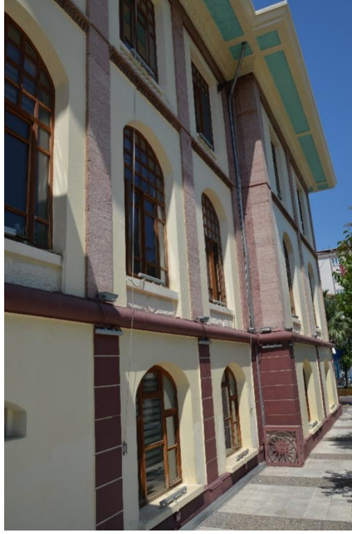
Fotoğraf 7. Manisa Hükümet Konağı kalın silmeler ve plastır detayları.