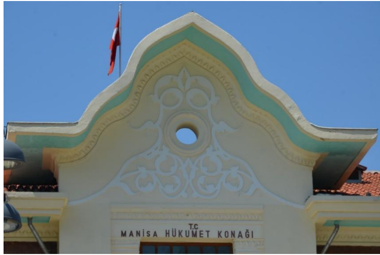
Fotoğraf 6. Dalgalı alınlığın içerisinde yer alan rumi ve palmet bezemeler.