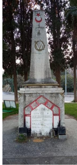
Fotoğraf 8. Salihli Şehitler Abidesi.

Kurtuluş Savaşı'nın önemli bir zaferi olan Salihli'nin 5 Eylül 1922 tarihinde Yunan işgalinden kurtuluşunun bir simgesi olarak, Mayıs 1924 yılında Mimar Kemal Altan tarafından tasarlanmıştır (Fotoğraf 8). Abide 1. Süvari Fırkası ile 10 ve 11. Alay'ın zaferini ölümsüzleştirmek amacıyla inşa edilmiştir (Altan 1948: 178; Eyice 1989: 530).