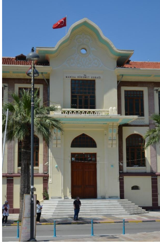
Fotoğraf 5. Manisa Hükümet Konağı güney cephedeki giriş.