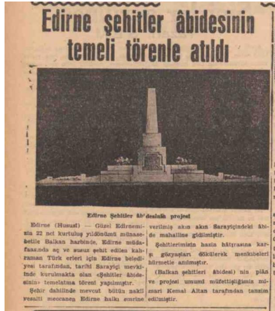
Fotoğraf 11. 29 Kasım 1944 Tarihli Son Posta Gazetesi Haberi (Anonim 1944: 6)

Edirne Balkan Savaşı Şehitleri Abidesi'nin inşası, dönemin önemli bir mimari olayı olarak Son Posta Gazetesi'nde geniş yer bulmuştur. Mimar Kemal Altan tarafından tasarlanan abidenin projesi, gazetede yayımlanarak kamuoyuyla paylaşılmıştır (Fotoğraf 11). Abidenin temel atma töreni, Edirne halkının yoğun katılımıyla gerçekleşmiş ve şehrin ortak hafızasında önemli bir yer edinmiştir (Anonim 1944: 6). Bu durum, abidenin hem bir anıt mezar hem de bir toplumsal birlik sembolü olduğunu göstermektedir.