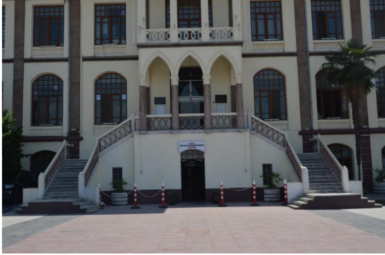
Fotoğraf 3. Manisa Hükümet Konağı kuzey cephesi giriş revakı.

Yapının güney cephesindeki giriş, kuzey cephesindeki ana girişle simetrik bir eksen üzerinde yer almaktadır (Fotoğraf 4). Çift kollu oval bir merdivenle ulaşılan bu giriş, cepheden dışa taşkın bir pozisyonda konumlanmıştır (Fotoğraf 5). Girişin üzerindeki dalgalı alınlık, rumi ve palmet motifleriyle zenginleştirilmiş olup yapının cephe kompozisyonuna hareketlilik kazandırmaktadır (Fotoğraf 6). Pencere düzenleri, katlar arasında farklılık göstermekle birlikte, genel olarak bir bütünlük içindedir. Zemin katta basık kemerli, orta katta yuvarlak kemerli ve üst katta dikdörtgen çerçeveli pencereler kullanılmıştır. Katlar arasındaki kalın silme ve pilastrlarla oluşturulan dikey ve yatay bölmelerle cephe, ritmik bir görünüm kazanmıştır (Fotoğraf 7) (Yıldız 2024: 54).