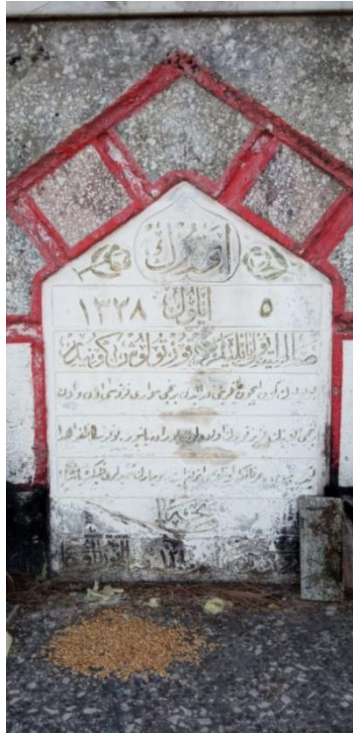
Fotoğraf 10. Salihli Abidesi kitabesinden detay.

Salihli Şehitler Abidesi, kare planlı yüksek bir kaide üzerine oturtulmuş, prizmatik bir gövdeye sahip bir anıttır. Anıtın dış yüzeyi, mozaik sıva tekniğiyle kaplanmıştır. Ön yüzündeki sivri kemerli alınlıkta, kazıma tekniğiyle işlenmiş sülüs yazı ile kaleme alınmış bir kitabe yer almaktadır (Fotoğraf 10).