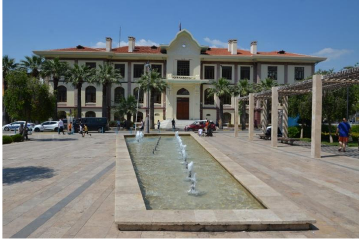
Fotoğraf 4. Manisa Hükümet Konağı güney cephesi.

Yapının güney cephesindeki giriş, kuzey cephesindeki ana girişle simetrik bir eksen üzerinde yer almaktadır (Fotoğraf 4). Çift kollu oval bir merdivenle ulaşılan bu giriş, cepheden dışa taşkın bir pozisyonda konumlanmıştır (Fotoğraf 5). Girişin üzerindeki dalgalı alınlık, rumi ve palmet motifleriyle zenginleştirilmiş olup yapının cephe kompozisyonuna hareketlilik kazandırmaktadır (Fotoğraf 6). Pencere düzenleri, katlar arasında farklılık göstermekle birlikte, genel olarak bir bütünlük içindedir. Zemin katta basık kemerli, orta katta yuvarlak kemerli ve üst katta dikdörtgen çerçeveli pencereler kullanılmıştır. Katlar arasındaki kalın silme ve pilastrlarla oluşturulan dikey ve yatay bölmelerle cephe, ritmik bir görünüm kazanmıştır (Fotoğraf 7) (Yıldız 2024: 54).