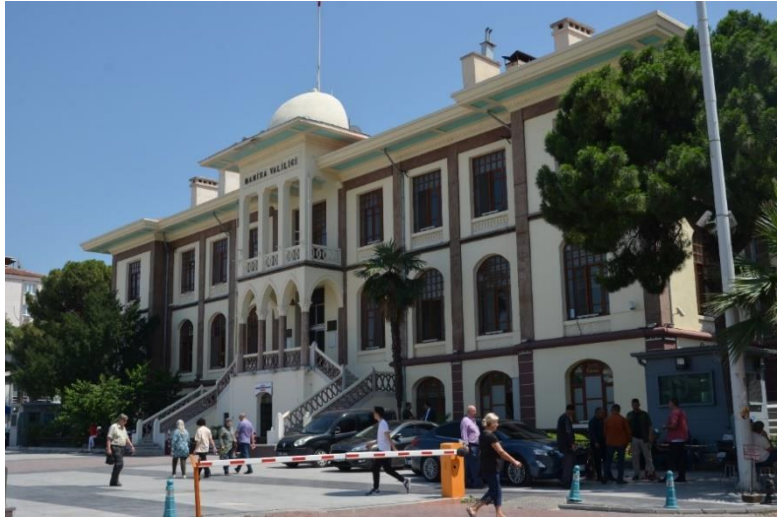
Fotoğraf 2. Manisa Hükümet Konağı kuzey girişi.

Hükümet Konağı, tipik bir Cumhuriyet dönemi devlet binası olarak, doğu-batı ekseninde uzanan dikdörtgen bir plana oturtulmuştur. Zemin kat üzerine yükselen üç katlı yapı, taş ve tuğla malzemelerin birlikte kullanıldığı bir teknikle inşa edilmiştir (Fotoğraf 2). Geniş saçaklı, kiremit kaplı çatısıyla yöresel mimari özelliklere gönderme yapan yapı, kuzey ve güney cephelerinde yer alan iki girişle hizmet vermektedir. Ana giriş, Cumhuriyet Meydanı'na bakmakta olup, hafifçe öne çıkarılmış köşe kuleleri ve iki kollu merdivenle ulaşılan bir giriş revakı ile vurgulanmıştır (Fotoğraf 3). Revakın üzerinde yer alan üç sivri kemerli balkon, yapının cephe kompozisyonunu hareketlendirmiştir. Simetrik olarak düzenlenen yan cepheler, dışa taşkın saçaklarla son bulmakta ve bu saçaklar kubbe ile taçlandırılarak cepheye görsel bir zenginlik kazandırmaktadır (Yıldız 2024: 54).