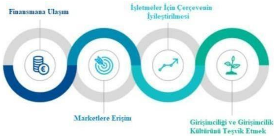
Şekil 2: COSME'nin Temel Amaçları

Avrupa Birliği'nde KOBİ'ler Avrupa kıtası ekonomisinde rekabetçi ortam oluşmasında ve dinamizmin yaratılmasında belirleyici bir rol oynamaktadırlar. Bu nedenle Avrupa Birliği; KOBİ'lerin büyüme potansiyelini arttırmak ve harekete geçirmek, girişimciliğin gelişmesini desteklemek, küçük işletmeler için uygun iş ortamı yaratmak ve KOBİ'lerin rekabetçiliğini artırmak yönünde çok sayıda çalışma yapmaktadır.