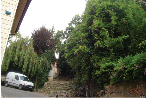
Şekil 4: Morsalkımlar, salkım söğütler ve taş merdivenler: Sırçacı Aralığı