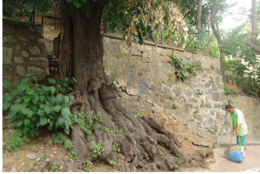
Şekil 2: Rumelihisarı'nda Doğa ve İnsan Ölçeği