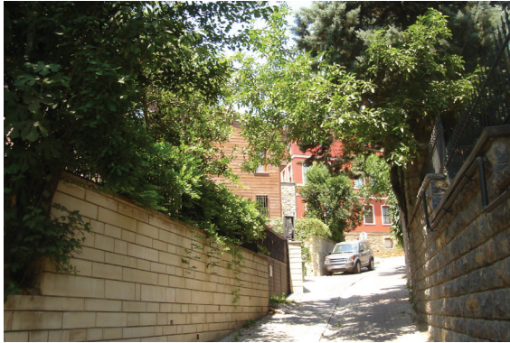
Şekil 3: Hanımeli kokan sokak: Ahmet Ağa Sokağı

Dernek web sitesinin işlevselliği sanal ortam üzerinden mahallenin hafızasını yenilemekte ve hatıralarını tazelemektedir. Böylece kent kimliğinin dinamiği toplumsallıklar, sanal ağ üzerinden mekânı aşkın boyutu ile yeniden ve farklı biçimlerde üretilmektedir.