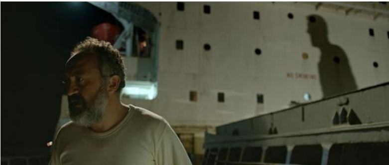
Görsel 5: Kürt’ün hayaleti

Foucault, sessiz muamelenin, belli bir derecede acı üreten, bir ritüelin parçasını oluşturan, herkes tarafından bir zafer olarak görülen bir gösteri yaratan bir işkence tekniği olabileceğini iddia eder (Foucault, 1995). Bu bağlamda filmde hiç konuşmayan “Kürt” karakteri bu işkencenin görünür kılınması olarak nitelenmelidir (Görsel 3.). “Foucault’ya göre, dil de birçok öge gibi iktidar kurmanın araçlarından biridir. İçinde yaşadığı yaşam kalıbının, dünyaya ait/dünyevi olana dair önemli sembollerinden olan “dil” ile anlaşma belki de bilinenin aksine asıl primitif olandır” (Velioğlu Metin, 2019, s. 488). Chion’a göre sessiz karakter, sesi olmayan bir karakter, anlatıya hizmet eder ve itaatkar bir rol oynar. Sosyoloji ve siyaset felsefesinde gücün meşru kullanımını gösteren iktidar kavramı, bir aktörün, eğer o temsilcinin otoritede olduğu algılanıyorsa, başka bir aktörün emirlerine isteyerek itaat etmesine hizmet eder. İktidara itaat, zorlama ve şiddet tehdidi yoluyla sağlanmaz. Onlar (itaat edenler) rahatsız etmek, katalize etmek veya açığa çıkarmak için bir araçtır. Dilsiz karakterin bilgi ve güçle çok yakın bir ilişkisi olduğunu, çünkü konuşamayacaklarını veya konuşmayacaklarını nadiren kesin olarak biliriz. Üstelik onlar sadece "bilinemez" değildir, aynı zamanda onları hikayenin önemli bilgilerinin saklandığı ve hiçbir zaman tamamen aktarılamayan yer olarak düşünebiliriz (Chion, 1999, s. 96-97).