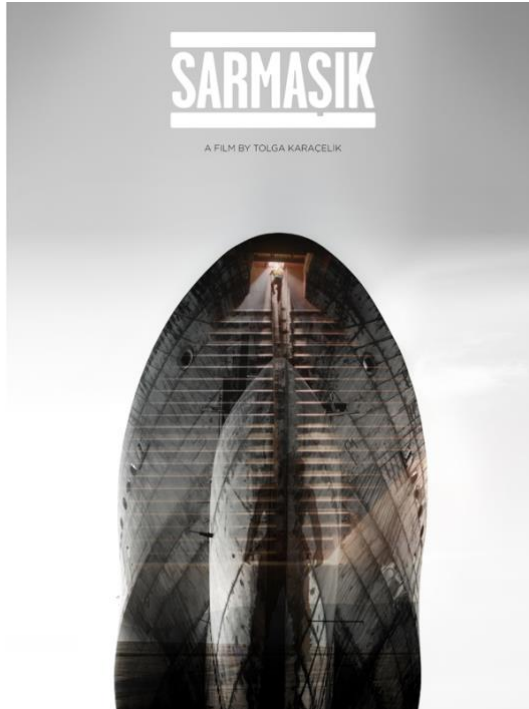
Görsel 6: Sarmaşık afişi