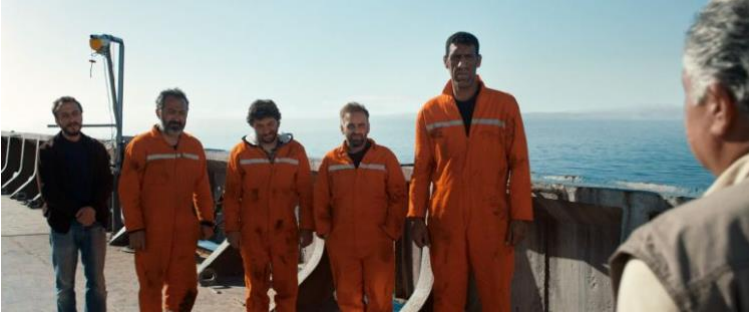
Görsel 1: Mürettebat

Sarmaşık, toplumun birey üzerindeki üstün etkisine karşı olarak; bir öznenin, geminin kaptanı olan Beybaba karakterinin geminin mürettebatı olan küçük topluma benimsetmeye çalıştığı kurallar bütünü üzerinden iktidar kavramını sorgular. Açık denizde mahsur kalan bir gemide, beş adet gemi görevlisini ast-üst ilişkisi bağlamında kontrol altında tutmaya çalışan Beybaba karakteri, personelin çatışmalarını baskın ve otoriter bir tavırla küçük görmeye ve her konuda kendisini haklı çıkarmaya çalışırken, her biri farklı toplumsal-kişisel ahlak anlayışına sahip olan diğer karakterler, birbirlerine ve Beybaba'ya (Görsel 2.) karşı kendilerini çözümsüz bir ikilemin içinde bulurlar. Sarmaşık, biyo-iktidar tanımının baş aşağı edildiği başarısız bir iktidar yaratma modelinin örneğini sunar. Filmde bireyi özgürlükten alıkoymayan, onlara özel yaşam alanı ve tam anlamıyla olmasa da serbestlik tanıyan bir yaklaşımla ele alınan iktidarı oluşturma ve koruma süreci, geminin belirsiz bir durumda denizin ortasında