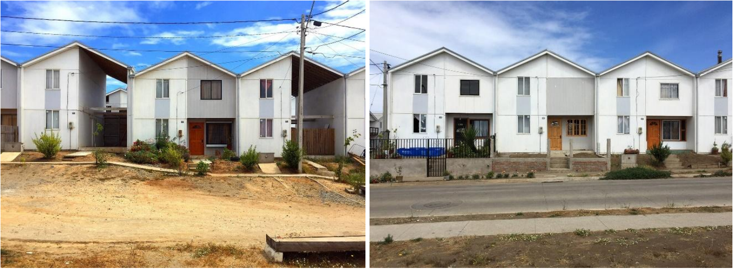
Şekil 5. Villa Verde Teslim Edilen ve Tamamlanmış Konutlar (ArchDaily, 2013)

Villa Verde konut birimleri başlangıçta 57 m 2 iken, genişlemeyle 85 m 2 alana sahip olabilmektedir. Elemental'in katılımcı tasarım süreci sonucunda 484 artımlı konut birimi oluşturulmuştur. İki kattan oluşan konutlarda zemin katta mutfak, banyo ve oturma odası bulunurken, birinci katta dört kullanıcı için yatak odası konumlandırılmıştır. Konutlarda nitelikli malzemeler, güneş enerjisi ve sismik izolatörlü sistemler kullanılmıştır. Kullanıcıların dikey mimari uygulamaya karşı çıkması sonucu iki kattan oluşmasına karar verilen yapılarda, mutfakta bulaşık makinesi, banyoda duş ve küvet de konumlandırılmıştır. Bu özellikler projenin daha lüks donatılarla yapıldığını göstermektedir. Ortak duvarlar, eğimli çatı, alt döşeme ve birinci