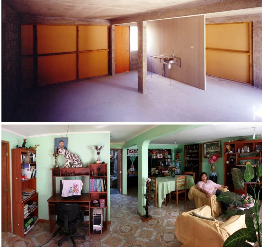
Şekil 4. Quinta Monroy İç Mekân Görselleri (ArchDaily, 2008)

Villa Verde Projesi, 2009 yılında Aravena ve ekibini arayan Arauco Orman Şirketi işçileri ve yüklenicileri için konut tasarımı yapılmasını istemesi üzerine tasarlanmıştır. Bu projede fazla kaynak ve fon elde edilmesiyle üst düzey bir sosyal konut politika örneği oluşturulmuştur. Villa Verde, Şili'nin Constitución bölgesinde 2009-2013 yılları arasında tamamlanmıştır. 2010 yılında Şili'de yaşanan 8.8 şiddetindeki depremden sonra bu projenin yapılması, bölgenin yapılanması açısından önemli rol oynamıştır. Bu proje, doğal afet sonrası zarar gören kıyı alanlarının yeniden kullanılmasını ve iyileştirilmesini amaçlayan bir yaklaşımı temsil etmektedir. Tsunami gibi doğal afetlerin etkisiyle zarar gören bölgelerde, doğal kaynakların ve çevrenin korunması önemlidir. Bu tür bir proje, zarar gören alanları onarmak ve toplum için kullanılabilir hale getirmek için tasarlanmıştır. Ahşap karkas sisteminden oluşan konut birimlerinin ormana yaklaştırılması, doğal ortamla uyumlu ve sürdürülebilir bir yerleşim modelini teşvik etmektedir. Bu yaklaşım, bölgenin ekosistemiyle daha uyumlu bir yaşam alanı