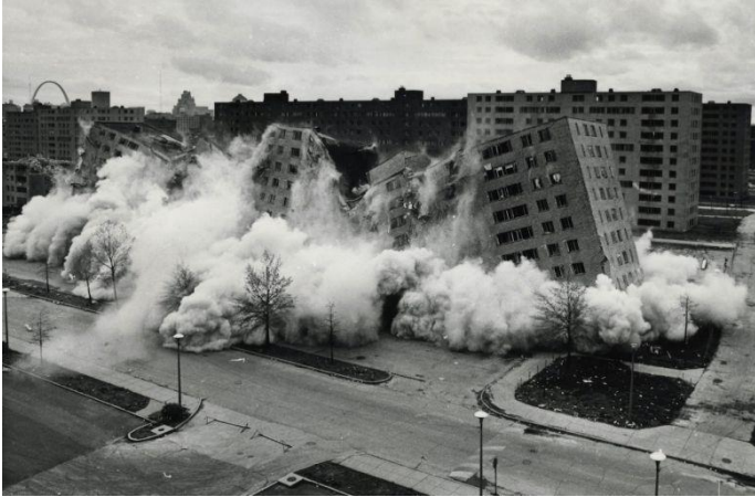
Şekil 1. The Pruitt-Igoe Myth [Pruitt-Igoe Miti] (2011) filminden bir kare

Sosyal konutlarda toplumsal sorunlara çözüm geliştirmenin geleneksel mimari yöntemlerle yeterince sağlanamaması, esneklik ve adaptasyonla kullanıcıyı sürece dahil eden katılımcı tasarım yaklaşımını ön plana çıkarmıştır. Mimar-kullanıcı iletişimsizliğinin en belirgin örneği olan Pruitt-Igoe konutları (Şekil 1) ise 1954 yılında New Orleans'ta inşa edilmiş, fakat fiziksel ve sosyal eksiklikleri nedeniyle 1972 yılında dinamitlerle yıkılmıştır (Jencks, 1977).