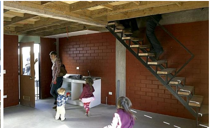
Şekil 8. Lo Barnechea Konutları (Arquitectura Viva, 2016)