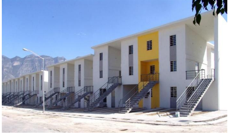
Şekil 7. Monterrey Konutları (ArchDaily, 2010)

Yıllık yağış miktarının Şili’ye göre oldukça yüksek olması farklı inşaat standartlarının kullanılmasını gerektirmiştir. Meksika hükümeti de bu anlamda Şili’deki desteklenen yatırımın iki katını Aravena’ya sunması projeyi kolaylaştırmıştır. Önceki projelerden edinilen deneyimleriyle Aravena, bu projede bir iç avlu oluşturarak kontrolsüz yeşil alanların oluşmasını ve güvenli bir kolektif alan yaratılmasını hedeflemiştir. Tüm dairelere kamusal alandan ve her birimin sahip olduğu otoparktan erişim mevcuttur. Metropol bir şehir olan Monterrey’de her kullanıcının bir araca sahip olması bu yaklaşımı getirmiştir (ArchDaily, 2010).