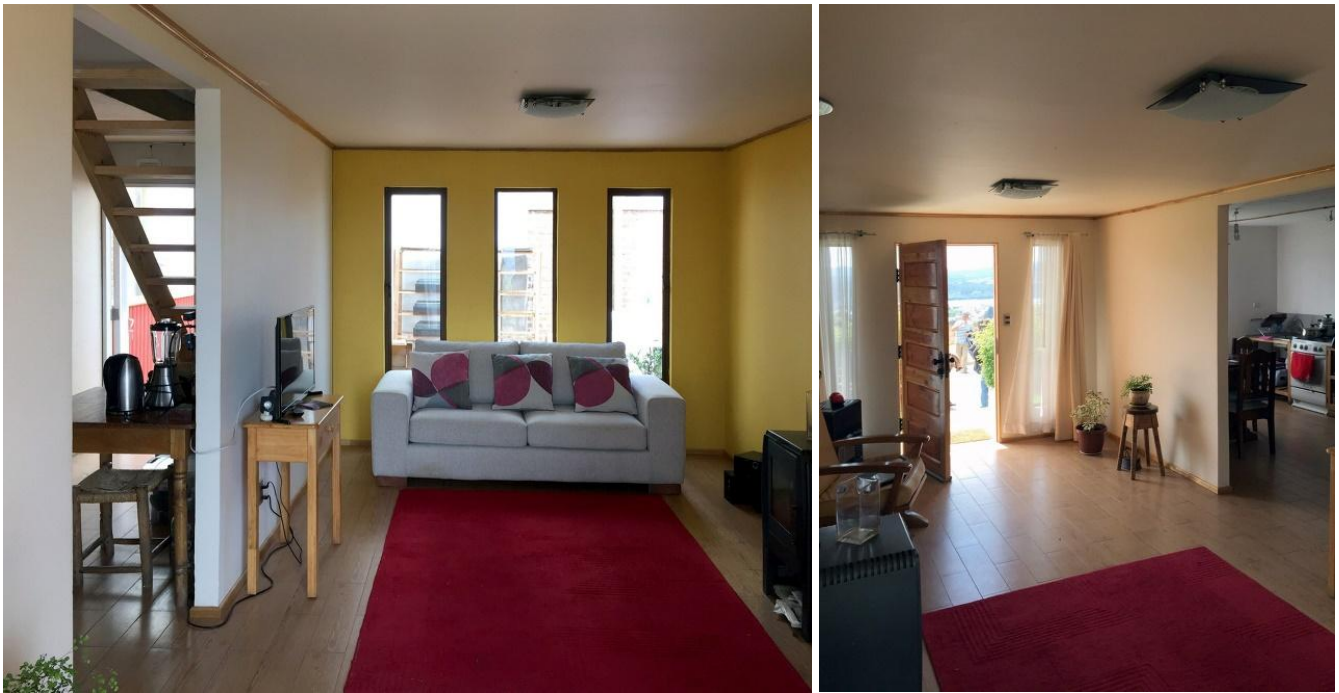
Şekil 6. Villa Verde İç Mekân Görselleri (ArchDaily, 2013)

katın döşemesi için kirişler tamamlanarak teslim edilmiştir. Kullanıcılar sadece bir döşeme ve iki dış duvar yaptırıldığında konutunu genişletmiş olmaktadır. Büyütme projelerini açıklayan ve tasarım kriterlerinin sorgulandığı çalıştaylar, bu projede de kullanıcılarla gerçekleştirilmiştir. Elemental, bütçenin tamamını ekonomik bir biçimde kullanabilirdi ancak, yine artımlı konut sistemini tercih ederek konutların kalitesini arttırmanın daha doğru olacağını düşünmüştür. Genişletme sonrasında maksimum sekiz kullanıcıya hizmet edebilen konut birimlerinin çoğu ise çok kısa sürede tamamlanmıştır (ArchDaily, 2013; Architect, 2016) (Şekil 6).