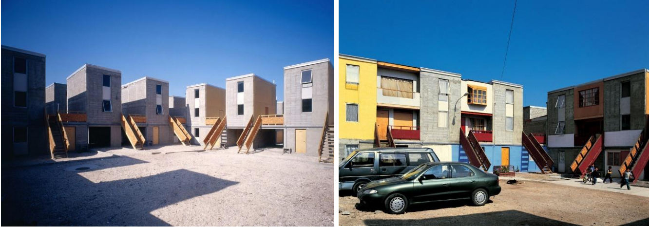
Şekil 3. Quinta Monroy Teslim Edilen ve Tamamlanmış Konutlar (ArchDaily, 2008)

özellikle artımlı konut modelini geliştirmiştir (Şekil 3, Şekil 4). Genel görüntünün kente uyumlu olması, genişlemeye izin veren malzemelerle esneklik sağlaması ve kütleler arası yirmi metre mesafe kurgulanmıştır (Kırlangıç Yoldaş, 2012). Kullanıcının inşa edemeyeceği düşünülen bölümlerden olan merdiven, mutfak ve banyo mekanları tamamlanan yarıya eklenmiştir.