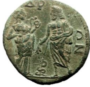
Görsel 15: Yılanlı asası ile Asklepios ve kızı Hygieia yılanı beslemektedir-Kilikya https://rpc.ashmus.ox.ac.uk/coins/6/30340 (23.10.2024).

Diğer taraftan Zeus'un oğlu kahraman Herakles'in 16 yılanlarla mücadelesi, Antakya'da bulunan MS 2. yüzyıla ait mozaiklerde görülmektedir. Hikayeye göre Zeus'un karısı Hera, üvey oğlu Herakles'i kıskandığı için öldürtmek istemiştir. Hera, bebek olan Herakles'in üzerine iki yılan yollamıştır. Fakat güçlü Herakles bu yılanları küçük çıplak elleriyle boğarak öldürmüştür (Görsel 16). Herakles'in birçok başarısı arasında, korkunç yılan Hydra'yı öldürmesi de resmedilen konular arasındadır. Herakles ve arkadaşı, birçok başı olan yılan Hydra'yı güçlkle öldürmeye çalışırken resmedilmiştir.