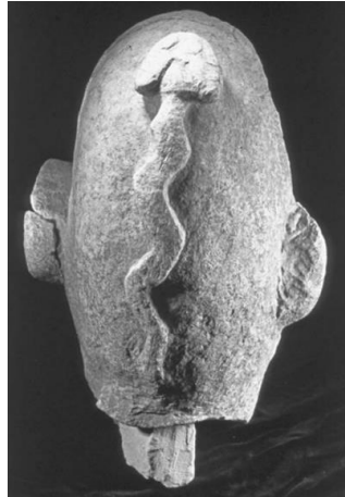
Görsel 4: Yılanlı insan başı-Nevali Çori (Benz ve Bauer, 2013: 17).

Yılan kutsal bir figür olarak Neolitik Çağ’ın önemli yerleşim yeri olan Çatalhöyük’te de görülmektedir. Çatalhöyük’ün VI. Tabakasında (yak.