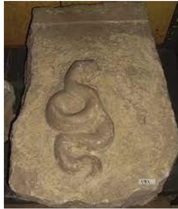
Görsel 17: Glykon için bir adak steli (Öztürk ve Öztürk, 2016: 235).

Daha önce bahsedildiği gibi, Karadeniz'in kıyısında yer alan Abonouteikhos antik kentinden başlayarak Roma kentlerine yayılan Glykon kültürünün sembolü bir yılanıdır. Mermerden, dikdörtgen formlu adak stel parçası üzerinde kabartma olarak kıvrılmış bir yılan tasvir edilmiştir (Görsel 17). Bu yılan figürünün, Sahte Peygamber Aleksandros'un yarattığı Yılan Tanrısı Glykon'a ait olabileceği düşünülmektedir (Öztürk ve Öztürk, 2016: 235). Kültürün etkisini artırmak ve daha geniş coğrafyaya ulaşmak için üretilen Glykon'a ait heykel, resim, ikon, sikke ve amulet gibi eserlere rastlanmaktadır (Yılmaz, 2015: 185).