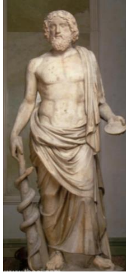
Gōrsel 13: Sađlık Tanrısı Asklepios