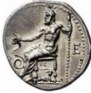
Görsel 11: Tahtta oturan Asklepios, elini kıvrılan yılanın başı üzerinde tutuyor-Epidauros (Tahberer, 2016: 7).

konularını sikkelerinde kullanmışlardır (Tahberer, 2005: 16-19). Yılan figürü sikkelerde genellikle Asklepios'un asasına sarılmış olarak tasvir edilmiştir (Görsel 11-12).