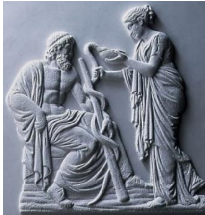
Gōrsel 14: Asklepios ve kızı Hygieia https://www.tipdunyasi.dr.tr/2021/01/antik-donemde-tip/ (06.04.2024)