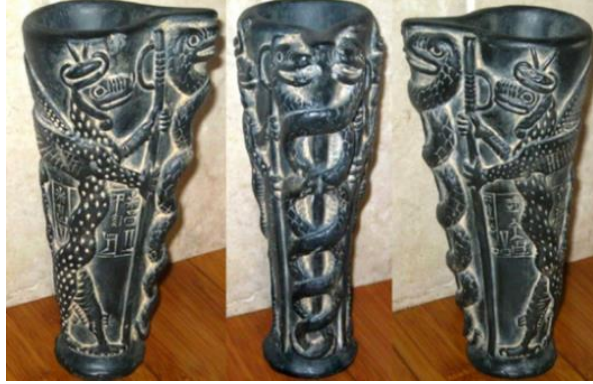
Görsel 6: Ningiřzida'nın sembolü olan bir sopaya ya da ağaca sarılmış biri erkek biri diři iki yılan.

Mitolojik metinlerde gönderme yapılan ve Sümer sanatında resmedilen yedi başlı yılan-ejderha “muřmahhu” adıyla geçmektedir. Yedi uzun boynu ve yedi başı olan yılanın, Tanrı Ningirsu ya da Ninurta tarafından öldürülen su yılanı olduđu düşünölmektedir. Ayrıca yılan tanrıları Akad Dönemi silindir mühürleri üzerinde görölmektedir. Vücudunun alt kısmı yılan, üst kısmı insan şeklinde olan tanrı yine Nirah'ı temsil etmektedir. Ayrıca Ortadođu'ya özgü zehirli bir yılan türü olan boynuzlu yılan bir simge olarak Kassit kudurruları (sınır taşları) üzerinde, Yeni Asur sanatında mühür süslemelerinde ve koruyucu, büyülu heykelcikler şeklinde ortaya çıkmıştır. Bu boynuzlu yılanın Akadca “başmu” (Sümerce MUŞ-ŞA-TUR) adlı yaratık olduđu düşünölmektedir.