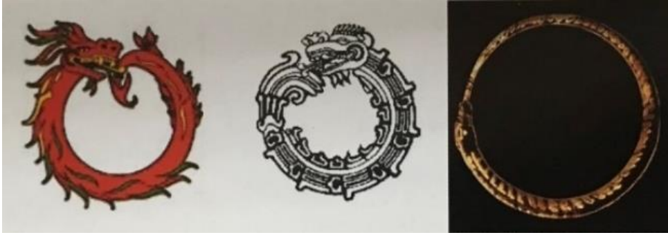
Görsel 9: Uroboros (Yöndemli, 2006: 354).

2013: 70). Ayrıca kuyruğunu ısırışı göz önüne getirildiğinde, bütün eski kozmogolojilerdeki daire şeklinde yüzen bir ada olan dünyayı (altından olduğu kadar içine de yayılan ve) çevreleyen suları düşündürür (Campbell, 2016: 18).