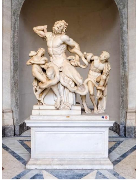
Görsel 10: Laocöon Heykeli https://vaticantips.com/the-laocöon-statue-vatican-museums/ (06.04.2024)