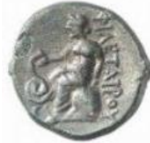
Görsel 12: Asklepios ve Yılan-Pergamon (Tahberer, 2016: 9).

Sağlık Tanrısı Asklepios bazen adak kabartmalarında karısıyla, iki oğluyla, kızları Hygieia (bazen boynundan sarkan bir yılanla kadehle içki 15 sunarken) tasvir edilmiştir (Cömert, 2010: 93). Asklepios yaşlı fakat sağlıklı, dinç vücudu, gür saçlı, uzun sakalı, sol omuzundan başlayan uzun harmanisi ve elinde asaya sarılmış bir yılanla canlandırılmıştır (Görsel 13-15). Asklepios'a göre bir hekim yılan gibi dilsiz olmalı, birisinin sırrını açıklamamalı, sabır içinde çalışmalıdır. Bir asa ile temsil edilmesi, tıp