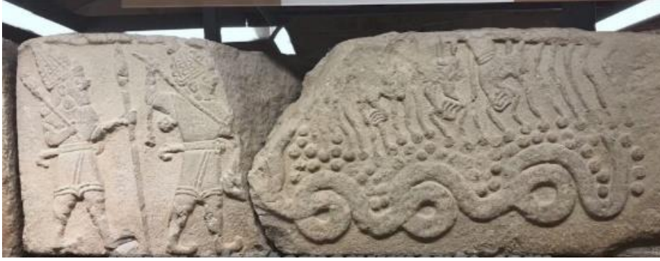
Görsel 7: Fırtına Tanrısı Teşup'un yılan İlluyanka'yı yenilgiye uğratma sahnesi https://www.hittitemonuments.com/arslantepe/arslantepe05-t.htm (04.04.2024)