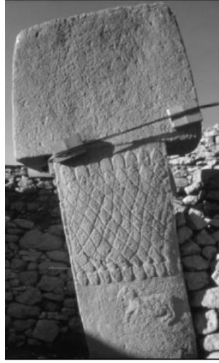
Görsel 2: Yılan kabartmalı dikilitaş-Göbekli Tepe (Henley ve Henley, 2019: 16).

Göbekli Tepe’de yılanlar tek başlarına, grup olarak ya da diğer hayvanlarla resmedilmişlerdir (Görsel 3). Bu yılanlar doğal boyutundan büyük ve kalp şeklindeki başıyla zehirli tür olan engerek yılanı grubuna dahil edilmektedir. Bütün bunlara rağmen Göbekli Tepe’deki yılanlı betimlemelerin ne anlama geldiği tam olarak bilinmemekte ve birer yorum olarak kalmaktadır. Ayrıca bir başka ilginç örnek Nevali Çori’de bulunmuştur. Taştan yapılmış bir insan kafası üzerinde yılan figürü