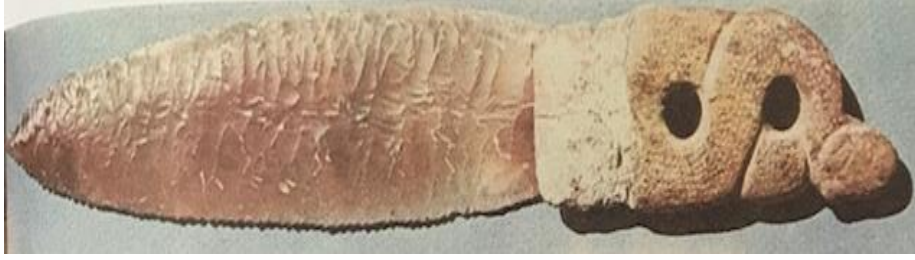
Görsel 5: Tören hançeri-Çatalhöyük (Mellaart, 1988: 81).

MÖ 5900) bir erkek mezarında çakmaktaşıdan yapılmış bir tören hançerinin kemikten yapılmış sap kısmı kıvrılmış yılan şeklindedir (Mellaart, 1988: 80). Tören hançeri olmasıyla bir nevi yılanın kutsallığı vurgulanmıştır (Görsel 5).