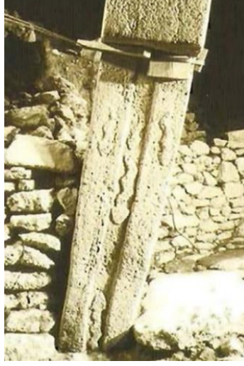
Görsel 1: Yılan kabartmalı dikilitaş-Göbekli Tepe (Schmidt, 2007:176).