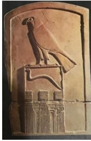
Görsel 8: Firavun bir yılan olarak tasvir edilmiştir (Lise, 1986: 41).

kobralar kraliyetin ve firavunun tanrısallığının sembolüdür. Öte yandan firavun yılan şeklinde de tasvir edilmiştir. Örneğin sembolik unsurlardan oluşan bir levha üzerinde Tanrı Horus'un simgesi şahin ile yılan şeklindeki firavun birlikte gösterilmiştir (Görsel 8). Bu levhanın alt kısmının toprağa gömülmüş olması öte dünya ile olan bütünleşmeye işaret etmektedir (Lise, 1986: 40-58). Gerçekten de yılanın toprakaltı ile olan irtibatı sürekli işlenmiş ve öte dünya ile olan ilişkisi vurgulanmıştır.