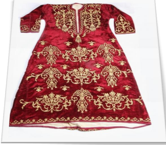
Şekil 3: Çanakkale dallısı