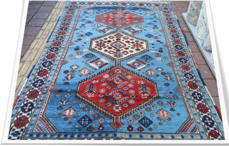
Şekil 6: Ayvacık halısı