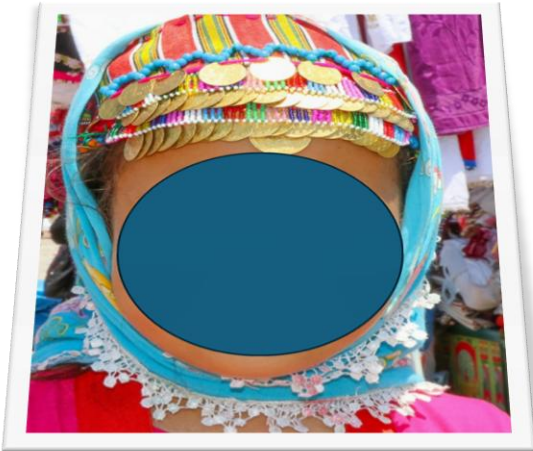
Şekil 4: Çanakkale başörtüsü ve başlıkları

Bayanlar baş örtüsü üzerinde “çeki” adı verilen çok renkli, işlemeli, oyalı, pullu örtü takarlar. Genellikle kırmızı renk ve tonları baskındır. Başa örtülen eşarp, çember ve örtülerin kenarlarına yapılan oyalar, baş örtüsü üzerine yapılan başlıkların giyenin kişinin medeni durumunu ifade edebilecek simgeler, semboller bulundurur. Başlıkların, yapımında kullanılan iplik, paar büyüklüğünde pul gibi nesnelere, renk, desen ve kompozisyonlar ve baş bağlama tarzlarıyla Yörük mü veya Türkmen mi olduğu anlaşılmaktadır. Beyaz pamuk veya polyester içerikli kare formundaki dokuma kumaştan yapılmış kenarları suzeni (zincir işi) tekniğiyle işlenen çember adı verilir. Çemberin çevresi firkete veya tığ ile yapılan oyalarla veya nakış ile işlenirse buna yazma denir. Genellikle çiçek desenleri (kabak çiçeği, mozak gülü, karanfil) tercih edilir. Beyaz başörtüsü genelle siyah ferace adı verilen palto ile kombine edilen kıyafetler yerelde yaygındır.