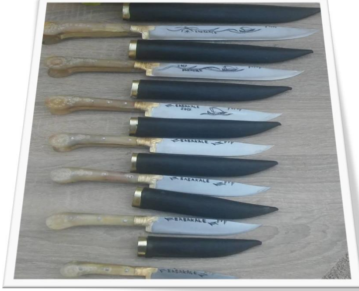
Şekil 5: Babakale bıçakları

Babakale’de, gerekse Ahmetçe’de sadece bir adet usta bu zanaatı devam ettirmektedir. Bıçaklar kınlı veya kınsız olabilmektedir. Kınlara çeşitli şekiller yazılar desenlenmektedir. Sap türüne göre: kabzalı, kulaklı, kulaksız olarak yapılabilmektedir. Aşırtma ve balçaklarda küflenmeyi ve korrazyonu önlemek için pirinç tercih edilmektedir. Geleneksel olarak keskinliğinin stabilitesi için dövme ve karbon çelik tercih edilmektedir. Saplar Ustalar talebe göre istenilen boyutta bıçağı veya çakıyı yapabilmektedir.