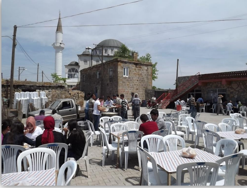
Şekil 7: Köy hayırlarından bir görünüm

Köy hayırları geleneksel olarak sosyal ilişkilerin pekiştirildiği, kendine has özelliklerin korunup geleceğe aktarıldığı, aynı zamanda sosyo-kültürel anlamda değişim açısından önemli unsurları içerisinde barındıran sosyolojik bir olgu haline gelmiştir.