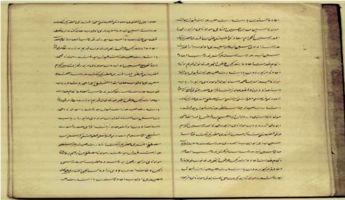
Resim-1/2: Kadı ve müderrislerin tayin kayıtlarını içeren Mülâzemet Defteri sayfaları.

T.C. Cumhurbaşkanlığı Devlet Arşivleri Başkanlığı Osmanlı Arşivinde yer alan Mülâzemet Defteri 'nin ilk iki sayfası, belirtilen konuda tipik bir örnektir: