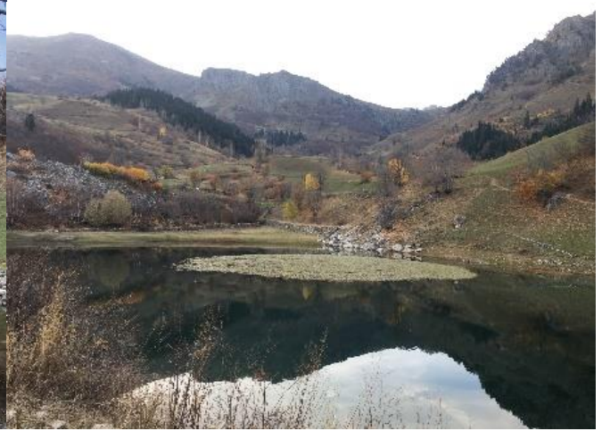
Şekil 2. Maden gölünden görüşler. Figure 2. Views from the mine lake.