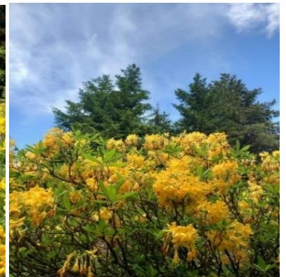
Şekil 4. Maden köyünde doğal çiçeklerden kesitler ( Rhododendron luteum , Sweet, Helichrysum arenarium , Medicago arborea , vb) Figure 4. Sections of natural flowers in Maden village ( Rhododendron luteum , Sweet, Helichrysum arenarium , Medicago arborea , vb)

Maden Köyü, üç tarafı kayalarla çevrili ve ormanlarla kaplı bir vadiye şekillenmiştir. Vadi alanının güney tarafında Büyük Tepe ve Sezgiret Tepesi