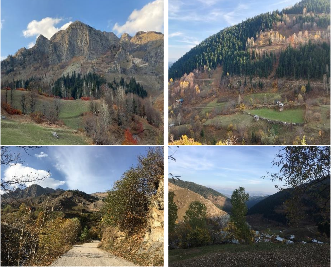
Şekil 5. Maden köyünün yerleşimi ve yakın çevresinden görüntüler Figure 5. Images of the settlement of Maden village and its immediate surroundings

yerleşiminin özellikle batı yamacındaki ormanlar gittikçe azalmaktadır. Bu azalmanın nedenleri arasında burada yaşayan yerel halkın yakacak odun temin etme ihtiyacın karşılamak ve tarım arazisi oluşturmak amacıyla ağaçları kesmek zorunda olduğu söylenebilir (Şekil 5).