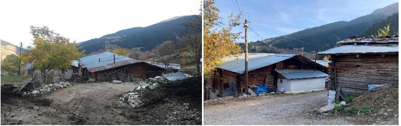
Şekil 9. Köy konutları ve iki yöne eğimli, saç kaplamalı çatı görüntülerinden örnekler. Figure 9. Examples of images of village houses and two-way sloped, sheet metal-coated roofs.