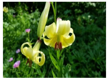
Şekil 3. Paeonia sp. (şakayık), Fritillaria sp. (ters lale), Lilium monadelphum (bey zambağı) (Tüfekçioğlu, 2024) Figure 3. Paeonia sp. (peony), Fritillaria sp. (inverted tulip), Lilium monadelphum (lily of the lord) (Tüfekçioğlu, 2024)