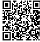
Tablo 9. Arter'de Miam Konserleri | Miam Concerts At Arter – 2 ‘Gelenekten Çağdaş’ Konseri ‘Asumani’.