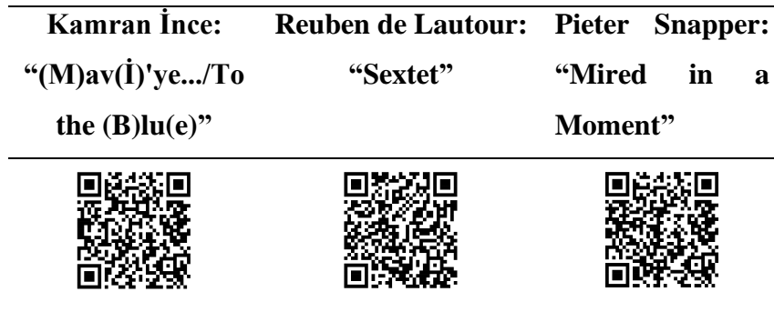
Tablo 13. Miam Modern Music Ensemble “From İstanbul” Albümü.

2017 yılında MİAM bünyesinde çalışan sekiz akademisyen bestecinin yaptığı “From İstanbul” adlı albüm yayınlanmıştır. Albüm, “Yeni Müzik” anlayışı ile bestelenmiş kompozisyonlardan oluşmaktadır. Albümdeki 3 esere “MIAM Modern Music Ensemble” içerisinde geleneksel Türk müziği çalgıları eşlik etmektedir. Kamran İnce’nin “(M)av(İ)'ye.../To the (B)lu(e)” adlı eserinde gitar, ud, klasik kemençe, kanun ve bağlama yer almaktadır. Reuben de Lautour’ un “Sextet” eserinde klasik kemençe, Pieter Snapper’ ın “Mired in a Moment” adlı eserinde ise bağlama yer almaktadır.