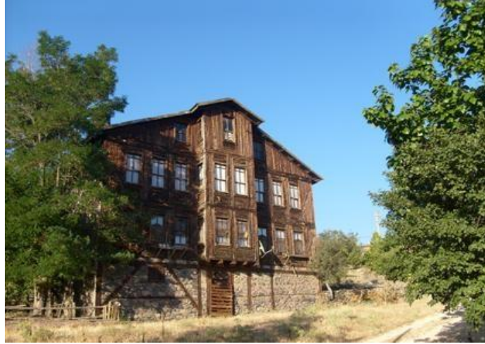
Seben Evleri: ("seben.gov.tr/ilce-fotografllari",2024).

İlçenin ilk eğitim kurumlarının ve farklı alanlarda esnafının da varlığını göstermiş olduğu (cami ve çevresi) alan.