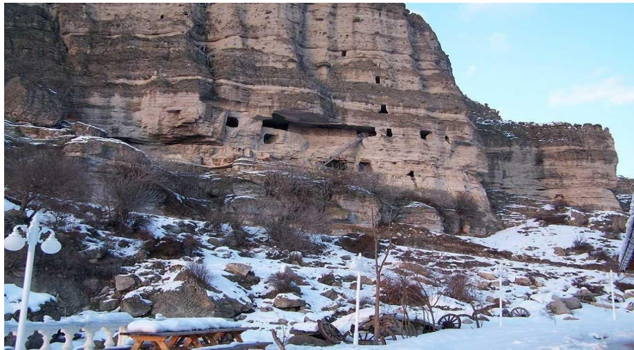
Şekil 3: Seben Solaklar Kaya Evleri

("kulturportali.gov.tr/turkiye/bolu/gezilecekyer/seben-kaya-evler", 2024).