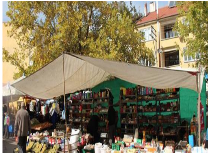
Şekil 2: Çarşamba İsmi İlçede Çarşamba Günü Kurulan Pazardan Aldığı: Asırlık Faal Pazar

(“sebenbungalov.com/seben/festival-ve-panayirlar”,2024).