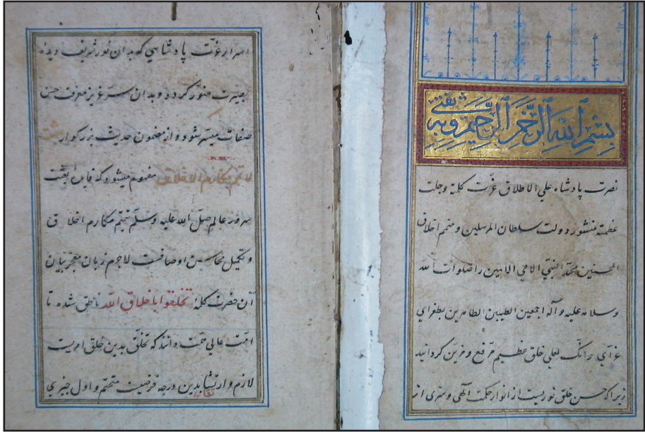
Ek-2., Ahlâk-ı Muhsinî (Kâşifî, 900/1494-1495, vr. 256 b -257 a ) 49