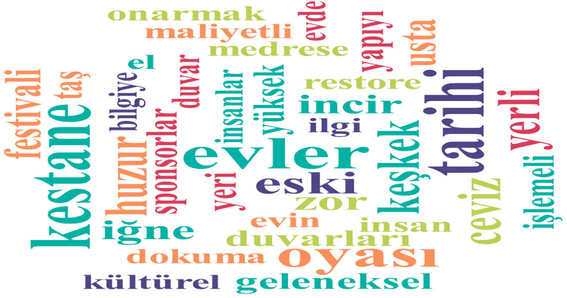
Tablo 5. 2021 Yılına İlişkin Kelime Bulutu

Tablo 5 incelendiğinde en çok kullanılan kelimelerin evler, eski, incir, keşkek, ceviz, tarih, medrese kelimelerinin olduğu görülmektedir. Bu kelime bulutu ve önceki kodlar ve görüşmeler bir bütün olarak düşünüldüğünde Birgi’de yaşayan yer halkın en çok üstünde durduğu konunun evlerin eski olması, değişiklik yapmanın önündeki yasal engeller, restorasyonun çok masraflı olmasının yer aldığı görülmektedir. Tablo 6’da 2024 yılında gerçekleştirilen görüşmelere ilişkin kelime bulutu yer almaktadır.