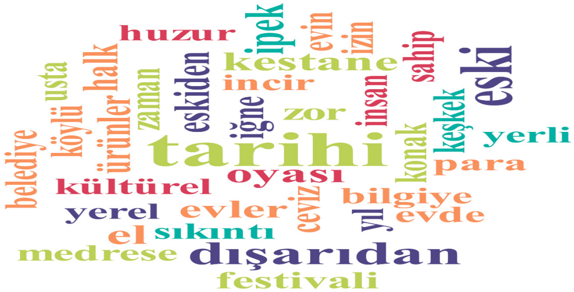
Tablo 7. 2021 ve 2024 Kelime Bulutu

Tablo' 7 incelendiğinde; 2021 ve 2024 yıllarında gerçekleştirilen görüşmelerde en çok kullanılan kelimenin Birgi'nin tarihi olduğu görülmektedir. Ayrıca incir, kestane, konak, huzur, dışarıdan, kültürel, iğne oyası kelimelerinin de sıklıkla kullanıldığı görülmektedir.