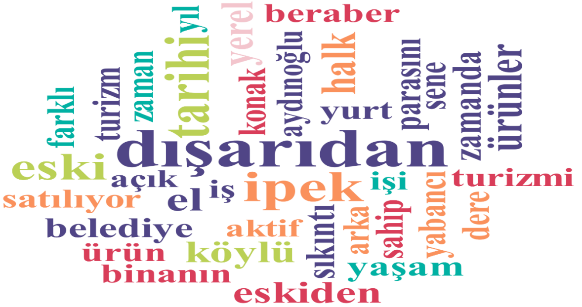
Tablo 6. 2024 Yılına İlişkin Kelime Bulutu

Tablo 6’ da yer alan kelime bulutu incelendiğinde Birgi halkının 2024 yılında en çok tekrar eden kelimelerin “dışarıdan, ipek, tarih, turizm, ürün” olduğu görülmektedir. Bu kelimeler üzerinden de Birgi halkının 2024 yılında en çok üzerinde durduğu konuların, dışarıdan gelen insanlar ve ürünler, yok olmaya yüz tutan ipek-