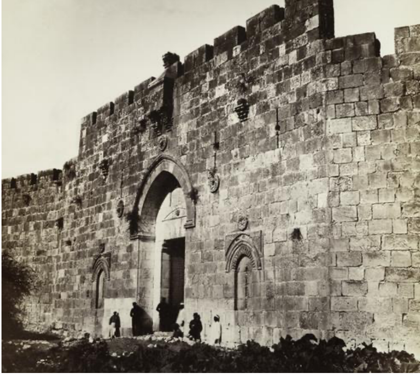
Res. 7. Bâbu'n-Nebî Dâvûd (Davud Kapısı), 1865