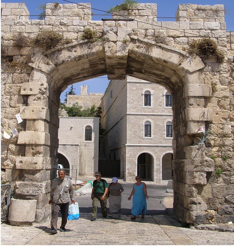
Res. 9. Bâb-ı Cedîd (Hamidiye Kapısı/Yeni Kapı) ( https://tr.wikipedia.org/wiki/Kudüs_Eski_Şehri_Kapıları#/media/Dosya:Jerusalem,_Old_City,_New_Gate_01.jpg ).