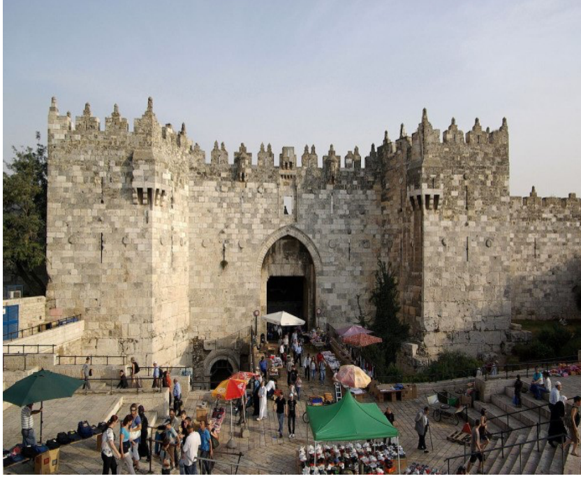
Res. 3. Bâbu'l-Amûd (Şam Kapısı) ( https://www.davamizkudus.org/blog/kudus-surlarindaki-kapilar/ ).