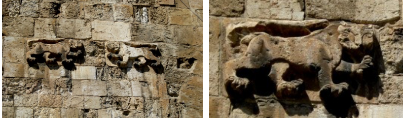
Res. 5. Bâbu'l-Esbât'ın (Aslanlı Kapı) Genel Görünümü ve Cephesinde Yer Alan Pars Tasvirleri Detayı. ( https://www.davamizkudus.org/blog/kudus-surlarindaki-kapilar/ ).