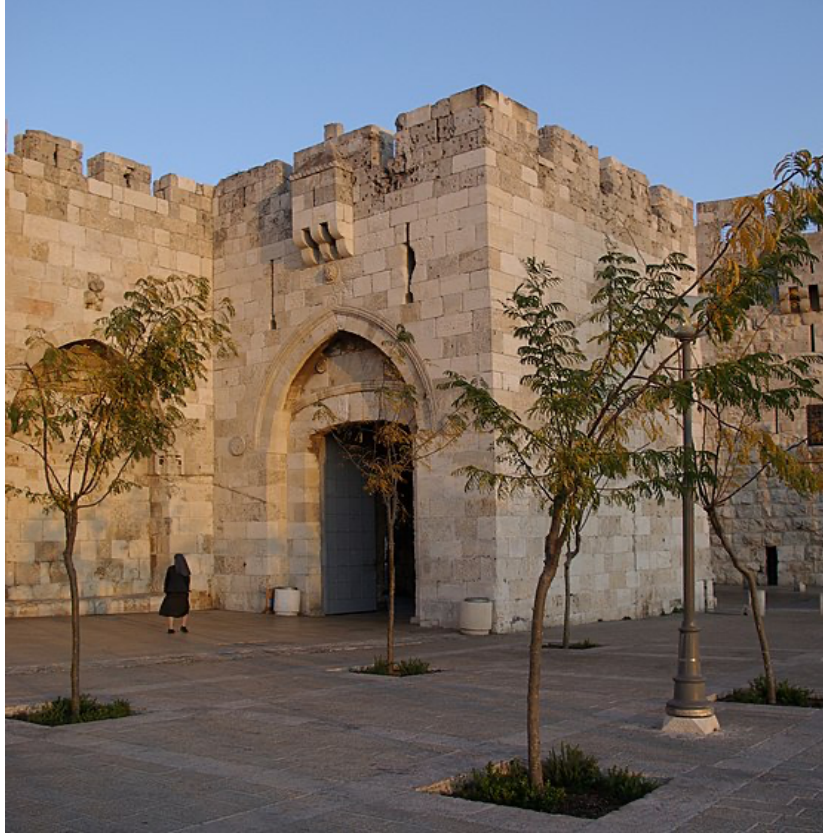
Res. 8. Bâbu'l-Halîl (Yafa Kapısı).