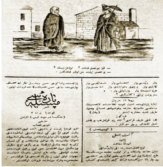
Resim 3. Kıyafetlerinden dolayı birbirini tenkit eden alafranga ve alaturka giyimli iki kadını gösteren bir karikatür ( Hayâl , nr. 157, 5 Haziran 1291) 6

Karikatürün altında geçen diyalogda kadınlar birbirlerine: