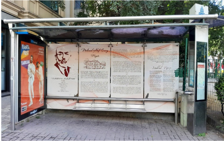
Şekil 1. Mehmet Âkif Ersoy Durağı, 2024. (Kişisel Arşiv).

Mehmet Âkif Ersoy durağı, şairin vefatının 78. yıl dönümü anısına tasarlanmış olup Vefa Durağı Projesi kapsamında tasarlanan durakların ilk örneğini oluşturmaktadır (URL-1). Fatih ilçesi Akdeniz Caddesi üzerinde karşılıklı iki adet Mehmet Âkif Ersoy isimli durak bulunmaktadır. Adnan Menderes Bulvarı (Vatan Caddesi) yönüne doğru devam eden yolun üzerindeki durak, bayrak durak olarak tasarlandığı için tabeladan ibarettir. Fevzi Paşa Caddesi yönüne doğru devam eden yolun üzerindeki diğer durak ise kapalı durak özelliği taşımakta olup çalışmanın konusunu oluşturmaktadır. Bu bağlamda Mehmet Âkif Ersoy durağı, biri çift yönlü kullanılmak kaydıyla toplam beş panodan oluşmaktadır. Durağın arka kısmında bulunan dört panoda Mehmet Âkif Ersoy'a dair bilgilendirmelerde bulunulmuştur. Buna göre soldan sağa doğru ilk panoda şairin görseli ve eserleri yer alırken ikinci ve üçüncü panoda hayatına dair bilgiler yer almaktadır. Toplam yedi bölüm hâlinde sunulan tasarımdaki son panoda ise İstiklal Marşı'nın yazım süreci ve on kıtadan oluşan İstiklal Marşı ele alınmıştır.