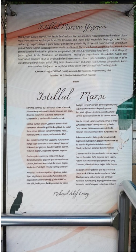
Şekil 7. Mehmet Âkif Ersoy Durağı Dördüncü Pano, 2024. (Kişisel Arşiv).

Şekil 7’de Mehmet Âkif Ersoy durağındaki dördüncü panoya yer verilmiştir. Dikey bir tasarıma sahip olan ve beyaz zemin rengi üzerine yerleştirilen dördüncü panoya pembe renk tonundan beyaz renk tonuna doğru ilerleyen degrade işlemi uygulanmıştır. Sade bir görsellik arz eden ve tipografik öğelerden oluşan bu tasarımın üst kısmına İstiklal Marşı’nın yazılması sürecini özetleyen bir metin, alt kısmına ise İstiklal Marşı’nın on kıtası ve serifli olacak biçimde brush script std yazı fontunda “Mehmet Âkif Ersoy ifadesi konumlandırılmıştır. Ayrıca metin içerisinde geçen ifadelerdeki keskin geçişleri vurgulamak için beyaz renkten kırmızı renk tonuna dönüşen şerit biçiminde bir degrade işlemi uygulanmış ve İstiklal Marşı’nın arka fonuna ay yıldız motifi yerleştirilmiştir.