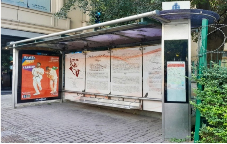
Şekil 2. Mehmet Âkif Ersoy Durağının Sol İstikametten Görünümü, 2024.

Şekil 2’de Mehmet Âkif Ersoy durağının sol istikametten fotoğraflanmış bir görünümü yer almaktadır. Görüldüğü üzere yatay yöndeki ilk pano reklam amacıyla kullanılıyorken bitişik hâlde bulunan dört pano mevcut proje için kullanılmaktadır.