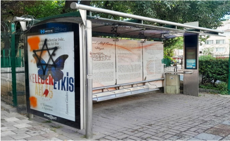
Şekil 3. Mehmet Âkif Ersoy Durağının Sağ İstikametten Görünümü, 2024. (Kişisel Arşiv).

Şekil 2’de Mehmet Âkif Ersoy durağının sol istikametten fotoğraflanmış bir görünümü yer almaktadır. Görüldüğü üzere yatay yöndeki ilk pano reklam amacıyla kullanılıyorken bitişik hâlde bulunan dört pano mevcut proje için kullanılmaktadır.