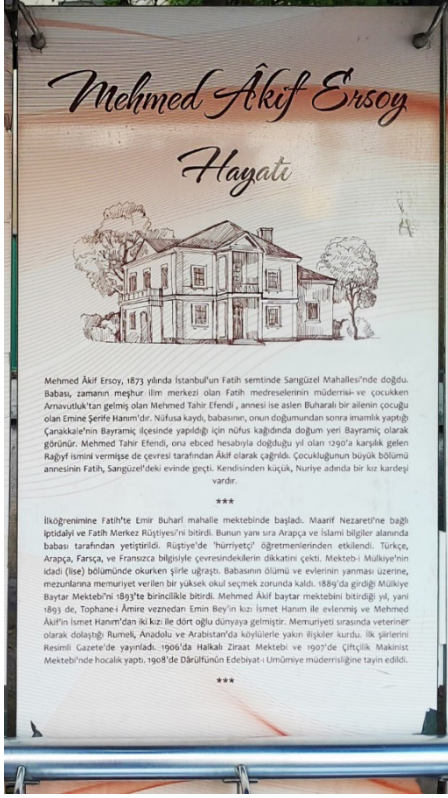
Şekil 5. Mehmet Akif Ersoy Durağı İkinci Pano, 2024.

Şekil 5'te Mehmet Akif Ersoy durağındaki ikinci panoya yer verilmiştir. Dikey bir tasarıma sahip olan ve beyaz zemin rengi üzerine yerleştirilen ikinci panoda üst kısma Mehmet Akif Ersoy'un yaşadığı evin illüstrasyonu hemen üstüne de serifli olacak biçimde brush script std yazı fontunda "Mehmet Akif Ersoy Hayatı" tipografisi konumlandırılmıştır. Tipografideki mesajı ön plana çıkarmak için künyenin alt kısmı kırmızı, üst kısmı beyaz olacak biçimde bir şerit ile belirginleştirilmiştir. Sade bir görsellik arz eden bu tasarımda alt kısma iki bölümden oluşan bir metin yerleştirilmiştir. Metinleri ayırmak ve konunun önemini vurgulamak için de üç adet yıldız sembolü kullanılmıştır. Birinci metinde şairin ailesi ve yaşadığı çevresi hakkında bilgilendirmelere yer verilmişken ikinci metinde eğitimi ve mesleği hakkında bilgilendirmelerde bulunulmuştur.