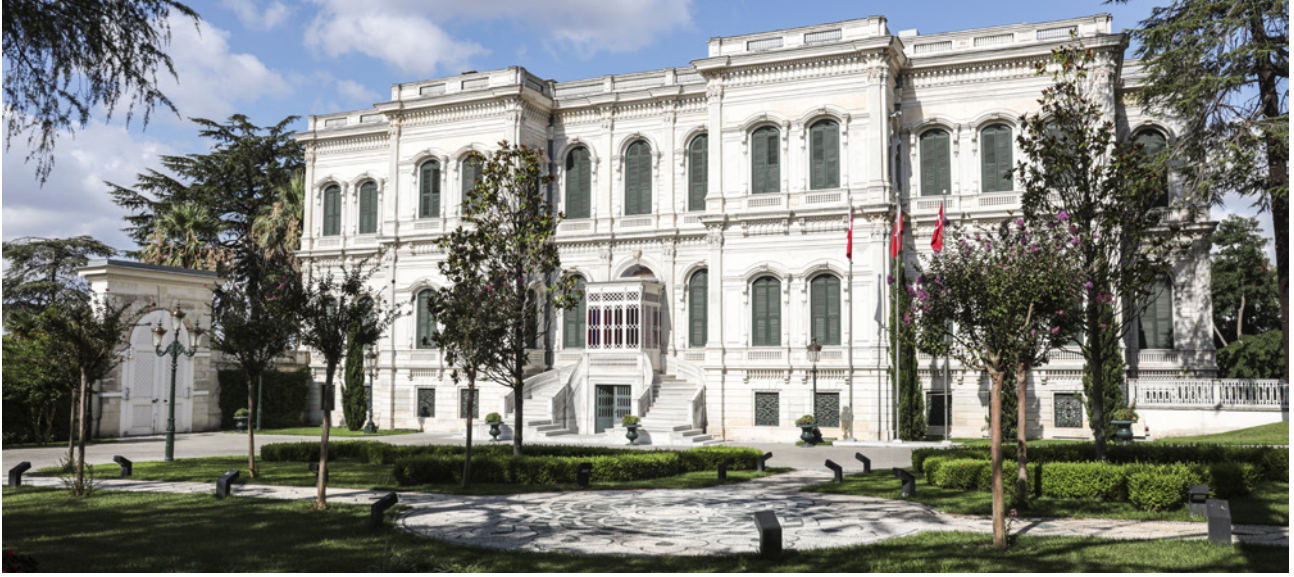
4 Büyük Mâbeyn Köşkü