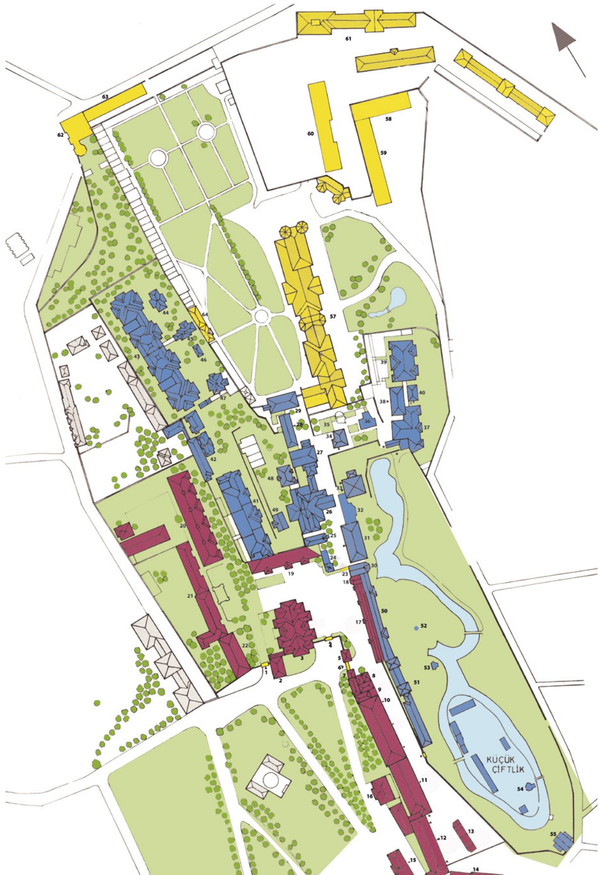
3 Yıldız Sarayı Vaziyet Planı (Sedat H. Eldem, Boğaziçi Anıları , Cilt 2, İstanbul: Aletaş Alarko Eğitim Tesisleri, 1979, 43)