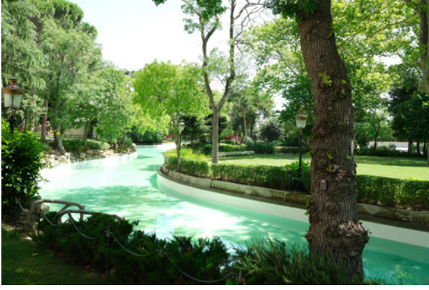
5 Yıldız bahçeleri

tasarlanan çeşme, İtalya ve Fransa'nın meydanlarında ya da bahçelerinde görülen süs çeşmelerine benzemektedir.