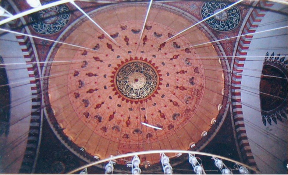
Resim 7: Süleymaniye Camii merkez kubbesi içi