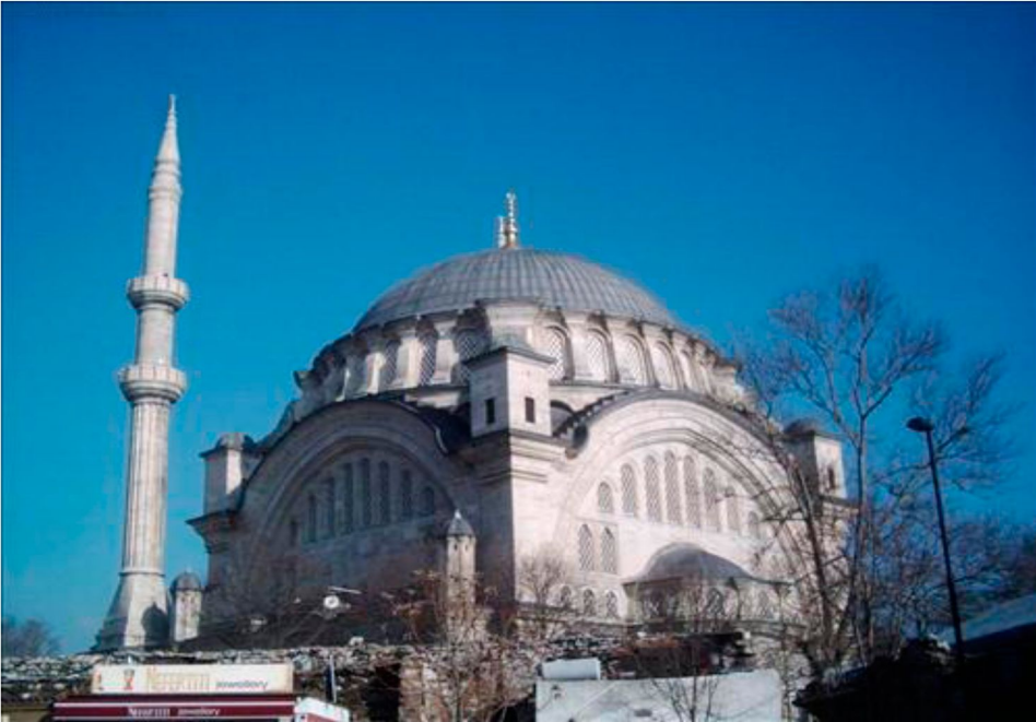
Resim 13: Nuruosmaniye Camii