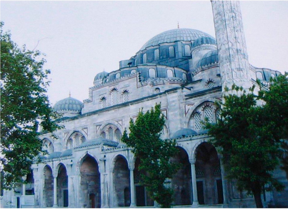
Resim 5: Şehzade Camii