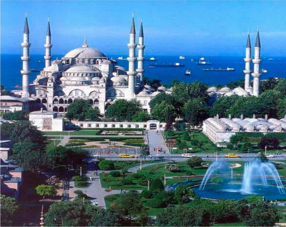
Resim 11: Sultanahmed Camii