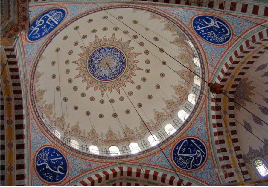
Resim 2: Fatih Camii, merkezi kubbe içi