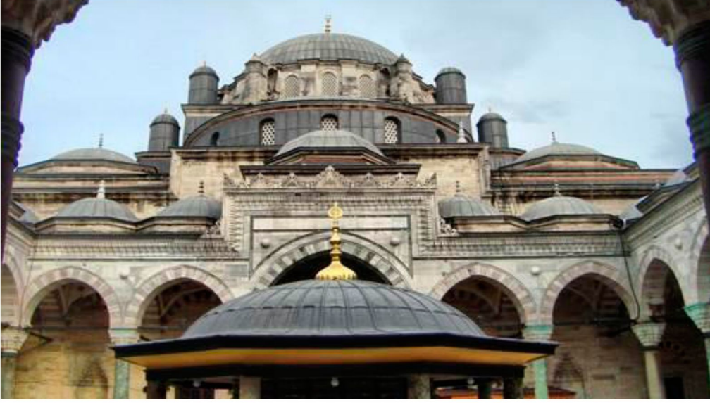
Resim 4: II. Bayezid Camii, kuzey cephesi