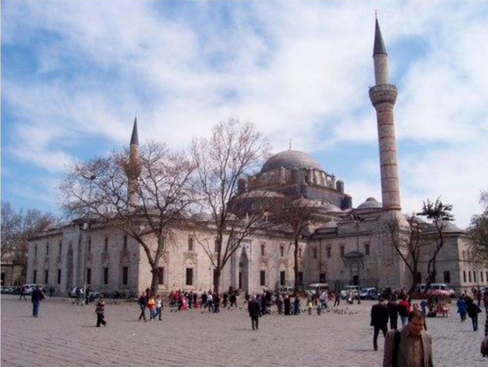
Resim 3: II. Bayezid Camii