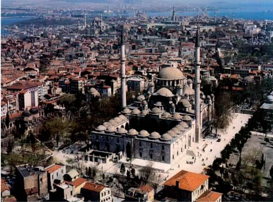
Resim 1: Fatih Camii