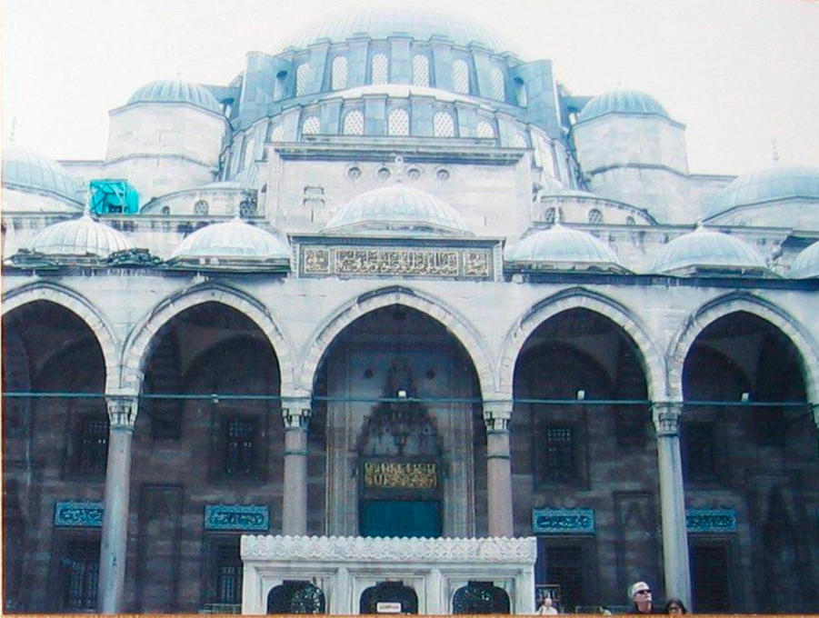
Resim 9: Süleymaniye, Kuzey Cephesi