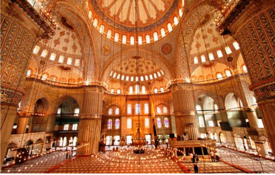
Resim 12: Sultanahmed Camii, iç mekanı