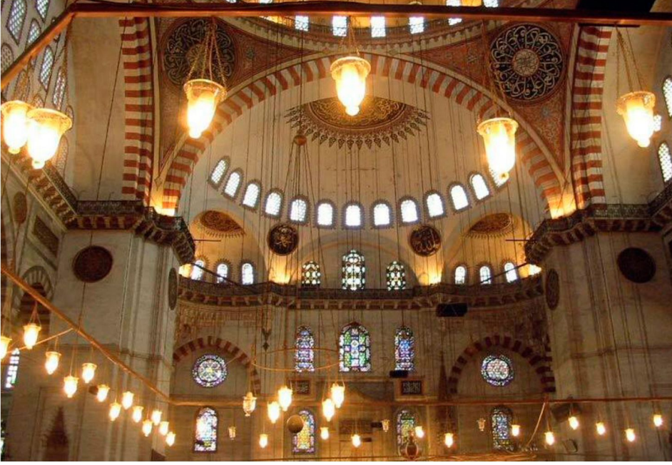
Resim 8: Süleymaniye Camii mihrap duvarı