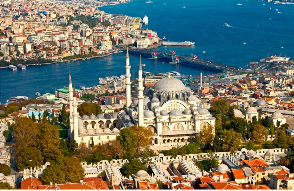
Resim 6: Süleymaniye Camii