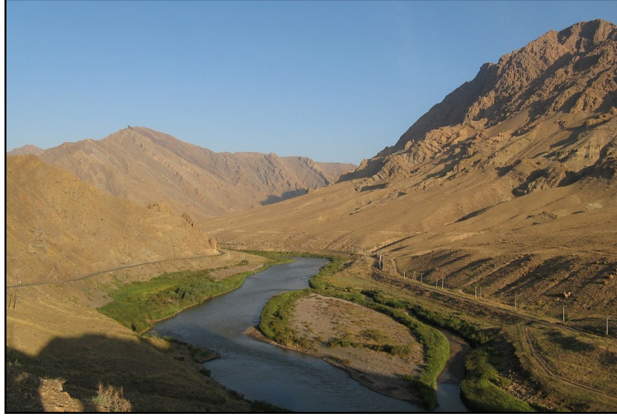
Fotoğraf 1: Yüksek dağlara arasında yapıya gömülmüş Aras Vadisi.

ülkeler, su kaynaklarındaki kalite, miktar ve ortak su kaynaklarının bütünleşik yönetimi konularında birbirleriyle ortak bir anlaşma yapmamışlardır. Bu durum, Aras Nehri'nin su kaynaklarının etkin ve sürdürülebilir bir şekilde yönetilmesini zorlaştırmaktadır (Kelanteri ve Hekmetara, 2020: 2874).