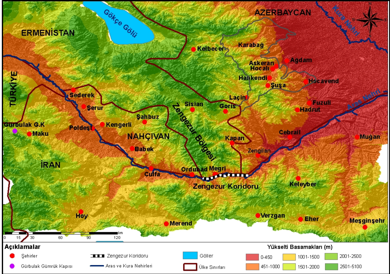
Harita 3: Kuzey-Güney, Doğu-Batı Arasında Zengezur Dehlizi (Koridoru)

okuması ve konumunu buna göre belirlemesi, Vadi açısında hayatidir. Aras Vadisine en uzun kıyısı bulunan ülke İran'dır. Tarih boyunca bölgesel denge noktası olmanın yanı sıra kültürel ve ekonomik bir merkez olarak da dikkat çekmiştir. Ancak, coğrafi avantajları ve zengin enerji kaynakları, ülkeyi hem bölgesel hem de küresel politikada dikkate değer bir oyuncu haline getirmiştir. Aras Vadisi üzerindeki güvenlik denetimi, İran'ı dünya enerji ticaretinde kilit bir konuma yerleştirirken, bölgedeki diğer devletlerle olan ilişkileri, jeopolitik dinamiklerin şekillenmesinde belirleyici unsurlardan birisidir.