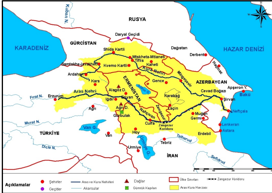
Harita 2: Aras-Kura Havzasının Belirleyici Olduğu Siyasi Sınırlar (2024).

Aras Nehri'nin sınır ötesi su kaynaklarının paylaşımı, Türkiye, Azerbaycan, İran, Gürcistan ve Ermenistan gibi beş ülke arasında henüz yasal bir düzenlemeye kavuşmuş değildir. Nehrin su miktarı ve kalitesini düzenleyen çok taraflı bir anlaşmanın eksikliği, bölgesel su yönetiminin iyileştirilmesi ve iş birliği konusundaki çabaların önünde büyük bir engel teşkil etmektedir.