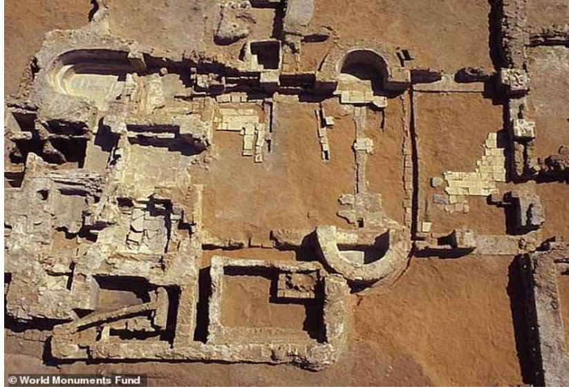
Şekil 3: Tell Umm Amer/Aziz Hilarion Manastırı (UNESCO (2023b)), Gaza: UNESCO grants enhanced provisional protection to Saint Hilarion Monastery. https://www.unesco.org/en/articles/gaza-unesco-grants-enhanced-provisional-protection-saint-hilarion-monastery?hub=102070 adresinden 18.09.2024 tarihinde erişilmiştir.