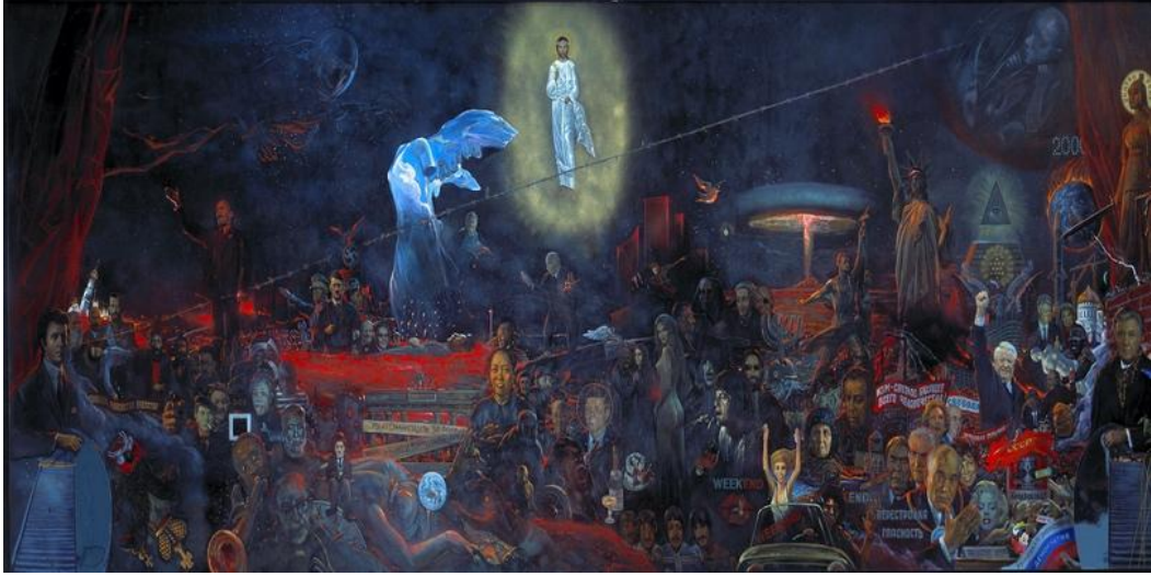
Resim 3. 20. Yüzyılın Gizemi , İlya Glazunov, 1978

İlya Glazunov'un 1978 yılında tamamladığı 20. Yüzyılın Gizemi eseri, sadece bir sanat eseri değil, aynı zamanda 20. yüzyılın trajik tarihini bir sahne oyununa dönüştüren etkileyici bir tablo olarak nitelendirilmektedir. Bu güçlü eser, Sovyetler Birliği'nin ideolojik baskı ortamında yaratılmış ve sanatçının kariyerini riske atarak sergilemek istediği bir direniş simgesi haline gelmiştir. Tabloda yer alan sembol ve figürler, tarihin farklı dönemlerine ait olayları, liderleri, sanatçıları ve toplumsal ikonları bir araya getirirken, merkezdeki İsa figürü tüm bu kaotik manzaraya kutsal bir ışık tutmaktadır. Alt kısmı kanla, sağ kısmı ise nükleer bir patlamayla aydınlatılan tablo, yalnızca tarihsel bir kronoloji sunmakla kalmayıp, aynı zamanda insanoğlunun yıkıcı eğilimlerine derin bir eleştiri getirmektedir. Glazunov'un bu eseri, hem Sovyetler Birliği'nde hem de yurtdışında büyük yankı uyandırmış, sanat dünyasında derin tartışmalara yol açmıştır.