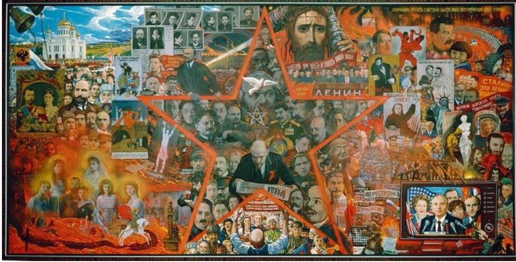
Resim 1. Büyük Deney , İlyâ Glazunov, 1990

Glazunov'un eseri, Rusya'nın tarihi sürecine dair önemli bir yorum sunarken, aynı zamanda sosyal ve politik deneylerin ne denli yıkıcı olabileceğine dair güçlü bir uyarı işlevi görmektedir.