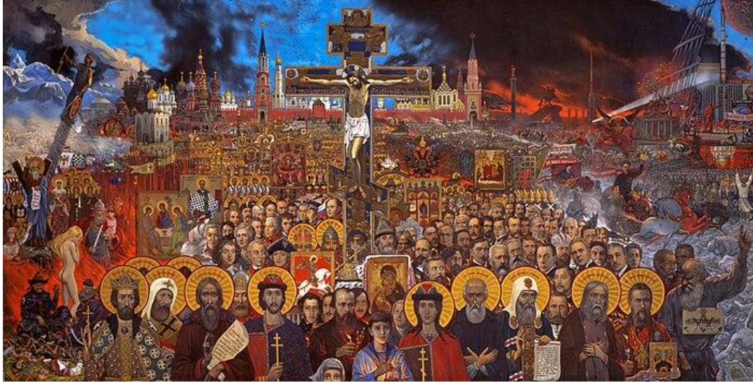
Resim 2. Ebedî Rusya , İlya Glazunov, 1988

Tablo, tarih boyunca Rusya'ya yön veren liderlerden sanatçılara, savaşçılardan azizlere kadar bir ulusun kolektif hafızasını temsil eden figürleri içermektedir. Her bir figür, büyük Rus İmparatorluğu'nun mirasını ve ruhunu betimlerken, arka planda ikonografik öğeler tarihsel olayların derin anlamlarını çağrıştırmaktadır. Ortasında yükselen haç sembolü, eserin hem dinî hem de ulusal kimliği arasındaki güçlü bağı vurgulamaktadır. Bu bağlamda, Ebedî Rusya yalnızca bir sanat eseri değil, aynı zamanda bir tarih kitabı ve ulusal bir manifesto olarak okunabilir.