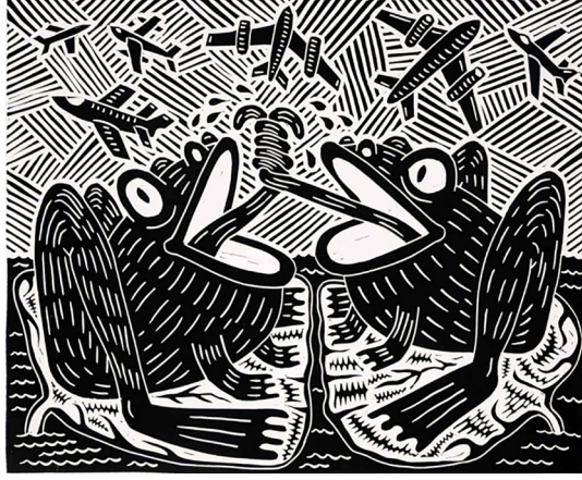
Görsel 10. Richard Mock, CIA- FBI , 2002, 45x51 cm, Linolyum Baskı

Richard Mock'un 2002 tarihli CIA-FBI adlı baskıresmi (Görsel 10), sanatçının Amerikan istihbarat örgütlerine yönelik eleştirilerini güçlü bir şekilde yansıtmış ve toplumsal hiciv içeren bir eser olarak dikkat çekmiştir. Eserde figürler, abartılı yüz ifadeleriyle CIA ve FBI'nın gizlilik, gözetim ve halk üzerindeki baskıcı güçleri sembolize edilmiştir. Mock, siyah-beyaz kontrastlarını kullanarak kompozisyonda dramatik bir etki yaratmış ve mesajın izleyiciye net bir şekilde ulaşmasını sağlamıştır. Mock, bu eseriyle devletin birey üzerindeki gözetim gücüne felsefi bir eleştiri getirmiş ve bu kurumların gizlilik politikalarını sorgulayarak bireysel özgürlüklerin tehlikeye atıldığını vurgulamıştır. Toplumsal açıdan ise devletin, halk üzerindeki kontrol mekanizmasını ve bu yapıların toplumun haklarını kısıtlayan işleyişini hicvetmiştir. Eser, bireyin devlet karşısındaki zayıflığını ve sistemin birey üzerindeki baskısını göstermiştir. Abartılı formlar ile cesur çizgiler kullanarak CIA ve FBI gibi kurumların karmaşıklığını yansıtan bu eser, Mock'un politik ve toplumsal meselelere dair eleştirilerini mizahi bir dille aktardığı önemli çalışmalarından biri olmuştur (Vranich & Hendrick, 2006).