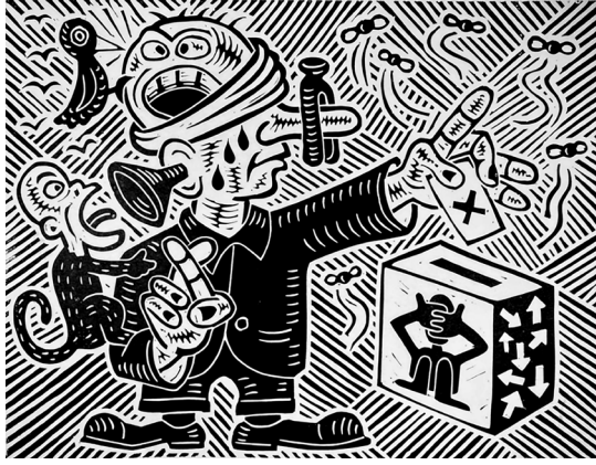
Görsel 9. Richard Mock, Amerikalı Seçmen (American Voter) , 2002, 38x50 cm, Linolyum Baskı

Richard Mock'un 2001 tarihli Yeni Amerikan Natürmort (New American Still Life) adlı eseri (Görsel 8), geleneksel natürmort türüne modern ve politik bir yorum getirerek Amerikan toplumunu ve hükümet politikalarını simgeleyen semboller kullanmış ve alışılmışın dışına çıkmıştır. Geleneksel natürmortun sakinliği yerine, eserde dinamizm ve karışıklık hissi uyandıran bir yapı yaratılmıştır. Sanatçı, siyah-beyaz kontrastlar ve cesur çizgilerle oluşturduğu eserini elle renklendirmiştir. Kompozisyonunda yer alan sembolik objeler aracılığıyla Amerika'nın ekonomik ve politik sistemlerini eleştirmiştir. Eser, Amerikan kapitalizmi, tüketim kültürü ve devlet politikalarına dair Mock'un eleştirel bakış açısını yansıtmış; modern Amerikan yaşam tarzının materyalizmi ve bozulmuş değerleri ön plana çıkarmıştır. Bireyin toplumdaki yerini ve hükümetin birey üzerindeki kontrolünü sorgulamış, Amerikan toplumunun içsel çelişkilerine dikkat çekmiştir. Sembolik objeler arasındaki bağlantılar, eserin politik yorumunu derinleştirerek izleyiciye güçlü bir görsel ve eleştirel deneyim sunmuştur (Whitman, 2015). Pop Art'a göndermeler yapan minimal renk paleti, Mock'un eleştirel mesajlarını ve eserin dramatik yapısını daha belirgin hale getirmiştir. Eserde kullanılan renkler, modern Amerikan yaşamının karmaşıklığını ve toplumsal çelişkilerini vurgulayan sembollerle birleşerek, izleyiciyi düşündürmeye yönelmiştir.