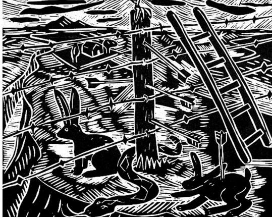
Görsel 1. Richard Mock, Kaderin Sınırlarını Aşmak (Crossing Fate's Boundaries) , 1978, 33x42 cm, Linolyum Baskı

zamanda eleştirel bir platform haline getirmiştir. Sanatçı, teknik ustalığını eleştirel bir bakış açısıyla birleştirerek toplumsal meseleleri görselleştiren çarpıcı metaforlar üretmiştir. Eserlerindeki görsel unsurlar ve kavramsal bütünlük hem güncel olaylara göndermelerde bulunmuş hem de evrensel değerler taşıyan bir anlatım sunmuştur. Mock'un linolyum baskıları, modern sanatın eleştirel işlevini başarıyla yerine getiren güçlü örnekler arasında yer alarak, sanat tarihi ve eleştirel sanat pratiği açısından önemli bir konuma ulaşmıştır.