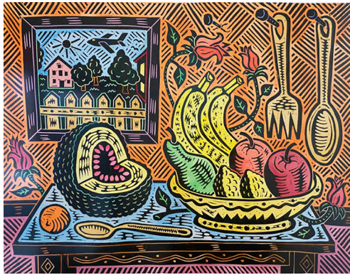
Görsel 8. Richard Mock, Yeni Amerikan Natürmort ( New American Still Life ), 2001, 42,5 x 55,9 cm, Linolyum Baskı

1999 yılına tarihlenen Japon Kadın Endüstriyel Kirliliğe Karşı Savaşıyor ( Japanese Woman Fights Industrial Pollution ) adlı linolyum baskısı (Görsel 7), Richard Mock'un toplumsal ve çevresel meseleleri hiciv ve ironi ile ele aldığı önemli bir çalışma olmuştur. Eserde, kompozisyonun ön planında yer alan Japon bir kadın, bir elinde çay fincanı tutarken diğer eliyle yelpaze sallayarak etrafındaki kirliliği uzaklaştırmaya çalışmış; aynı zamanda gaz maskesi takmıştır. Japon kültürüne göndermelerde bulunan eser, gaz maskesi ise endüstriyel kirliliğin bireylerin günlük yaşamlarını nasıl etkilediğini vurgulamıştır. Arka planda ise fabrikaların bacalarından çıkan yoğun dumanlar, çevresel yıkımı sembolize etmiştir. Mock, bu eserinde sanayileşmenin çevre üzerindeki yıkıcı etkilerini ve bireylerin bu duruma karşı verdiği mücadeleyi ironik bir şekilde vurgulamış, toplumsal eleştirilerini çarpıcı bir görsellikle ifade etmiştir. Ön plandaki kadının zarif detayları ile arka plandaki fabrikaların kirli atmosferi arasındaki tezat, linolyum baskı tekniğiyle başarıyla aktarılmıştır. Linolyumun işlenme kolaylığı sayesinde, detaylı bir kompozisyon ortaya koymuş ve siyah-beyaz kontrastlarla eserin eleştirel bakışını güçlendirmiştir (Mock, 2000).