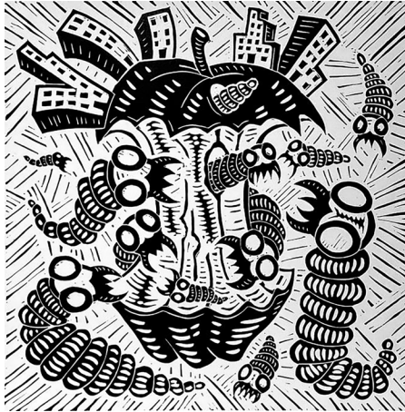
Görsel 5. Richard Mock, Büyük Elma (Big Apple) , 1990, 43x43 cm, Linolyum Baskı

Richard Mock'un Amerikan hükümet yapısını hicvettiği Hükümette Çok Fazla Kişi Var (Too Many People in Government) adlı eseri (Görsel 4), linolyum baskı tekniğiyle yapılmıştır. Mock, kaotik ve kalabalık bir yönetim sistemine yönelik eleştiriyi görselleştirmiştir. Eserde, abartılı ifadelerle hükümetin hantallığı ve işlevsizlik sorunları eleştirel bir şekilde vurgulanmıştır. Eser, siyah-beyaz kontrastların hâkim olduğu tipik Mock tarzında yapılmış olup, keskin çizgilerle hükümetin karmaşıklığı ve yoğun bürokrasisi görsel olarak vurgulanmıştır. Keskin çizgiler kompozisyonun dinamikliğini artırmış ve Mock'un hükümetin verimsizliğine dair eleştirisini aktarmada güçlü bir araç olarak kullanılmıştır. Eser, bireyin devlet tarafından nasıl yönetildiğini, bürokrasinin boğucu etkisini ve hükümetin halk üzerindeki kontrolünü sorgulamış; sanatçı, sistemin karmaşıklığının bireysel özgürlükleri engellediğini ve hükümetin halktan kopuk hale geldiğini hicvetmiştir. Baskıdaki abartılı/şaşkın yüz ifadesi ve uzayan gövde üzerine basan ayaklar karikatürize bir dil oluşturmuş ve sanatçının esprili, ironik ve anti-otoriter temalarla dolu tarzını yansıtmıştır. Sanatçı, toplumsal yapıları, özellikle de kurumsal açgözlülüğü ve siyasi yozlaşmayı eleştirmiştir (Kotik, 2021).