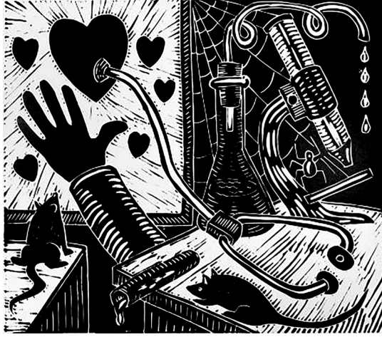
Görsel 3. Richard Mock, Tehdit Altındaki Tıp (Medicine's Threatened) , 1980, 33x38 cm, Linolyum Baskı

1980 yılına tarihlenen Tehdit Altındaki Tıp (Medicine's Threatened) adlı linolyum baskı eseri (Görsel 3), Richard Mock'un toplumsal ve politik eleştirilerini sağlık sistemi üzerinden hiciv ve ironi kullanarak yansıttığı önemli çalışmalarından biri olmuştur. Bu eser, modern sağlık sistemindeki sorunları ve tıbbın karşı karşıya kaldığı tehditleri çarpıcı bir görsel dil ile izleyiciye sunmuştur. Güçlü siyah-beyaz kontrastlar ve keskin çizgilerle dikkat çeken eserde, tıp sembolleri ve figürler abartılı bir biçimde kullanılmıştır. Doktor olduğu düşünülen bir figür büyük ve dramatik bir şekilde betimlenmiş, etrafında dolaşan sembollerle sağlık sisteminin karşı karşıya kaldığı baskıları simgelemiştir. Bu figürlerin karikatürize halleri, tıp camiasının gerçekliğini abartı yoluyla vurgulayarak, eserin eleştirel mesajını güçlendirmiştir. Eser, modern tıp sisteminin finansal çıkarlar, bürokrasi ve politik müdahalelerle nasıl tehdit altında olduğunu eleştirmiştir. Mock, bu temayı sağlık hizmetlerinin kalitesinin düşmesi ve hasta haklarının ihlal edilmesi gibi konular üzerinden ele almış; kullanılan figürler sağlık çalışanlarının ve hastaların yaşadığı zorlukları ve çaresizliği yansıtırken, arka plandaki sembolik unsurlar ise sistemin karmaşıklığını ve çarpıklığını vurgulamıştır.