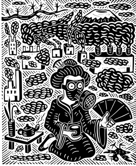
Görsel 7. Richard Mock, Japon Kadın Endüstriyel Kirliliğe Karşı Savaşıyor ( Japanese Woman Fights Industrial Pollution ), 1999, 45x51 cm, Linolyum Baskı

eserin sosyal mesajını izleyiciye doğrudan ulaştırmıştır. Sınırlı sayıda üretilmiş olan bu eser, mülteci krizlerine dair derin bir duyarlılık ve eleştirel bir bakış açısı sunarak izleyiciyi hem düşündürmüş hem de duygusal olarak etkilemiştir (Kotik, 2021).