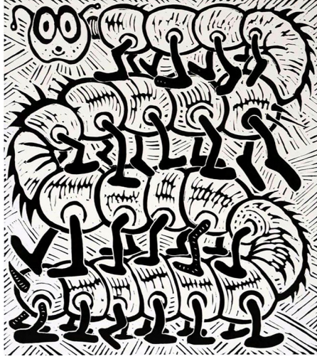
Görsel 4. Richard Mock, Hükümette Çok Fazla Kişi Var (Too Many People in Government) , 1988, 45x51 cm, Linolyum Baskı

Richard Mock'un Amerikan hükümet yapısını hicvettiği Hükümette Çok Fazla Kişi Var (Too Many People in Government) adlı eseri (Görsel 4), linolyum baskı tekniğiyle yapılmıştır. Mock, kaotik ve kalabalık bir yönetim sistemine yönelik eleştiriyi görselleştirmiştir. Eserde, abartılı ifadelerle hükümetin hantallığı ve işlevsizlik sorunları eleştirel bir şekilde vurgulanmıştır. Eser, siyah-beyaz kontrastların hâkim olduğu tipik Mock tarzında yapılmış olup, keskin çizgilerle hükümetin karmaşıklığı ve yoğun bürokrasisi görsel olarak vurgulanmıştır. Keskin çizgiler kompozisyonun dinamikliğini artırmış ve Mock'un hükümetin verimsizliğine dair eleştirisini aktarmada güçlü bir araç olarak kullanılmıştır. Eser, bireyin devlet tarafından nasıl yönetildiğini, bürokrasinin boğucu etkisini ve hükümetin halk üzerindeki kontrolünü sorgulamış; sanatçı, sistemin karmaşıklığının bireysel özgürlükleri engellediğini ve hükümetin halktan kopuk hale geldiğini hicvetmiştir. Baskıdaki abartılı/şaşkın yüz ifadesi ve uzayan gövde üzerine basan ayaklar karikatürize bir dil oluşturmuş ve sanatçının esprili, ironik ve anti-otoriter temalarla dolu tarzını yansıtmıştır. Sanatçı, toplumsal yapıları, özellikle de kurumsal açgözlülüğü ve siyasi yozlaşmayı eleştirmiştir (Kotik, 2021).